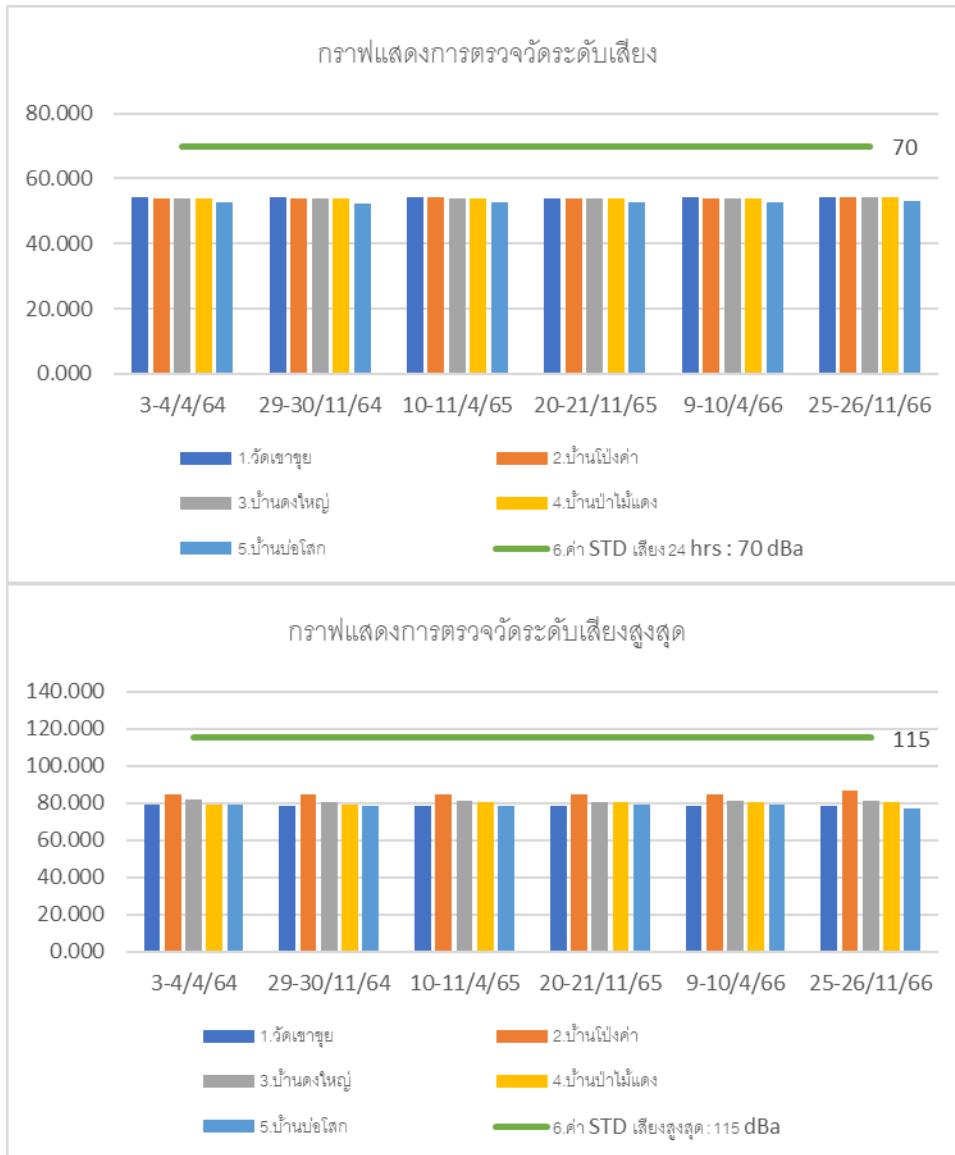
รูปที่ 3-2 กราฟแสดงการตรวจวัดระดับเสียงปีพ.ศ. 2564-2566