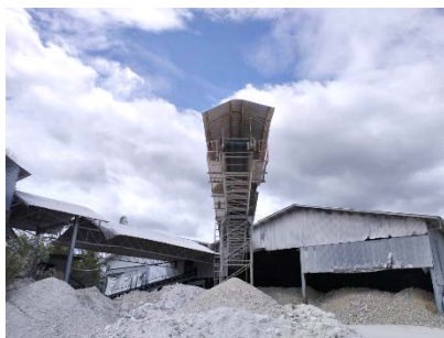
พื้นที่โรงแต่งแร่ของโครงการ