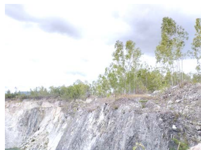
แนวเวนพื้นที่ทำเหมือง