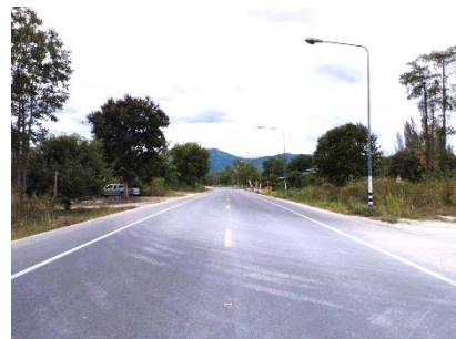
ทางหลวงหมายเลข 3313