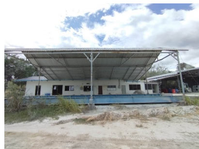
อาคารสำนักงาน

ที่มา : www.google-earth.com (2561) และการสำรวจภาคสนาม (2566)