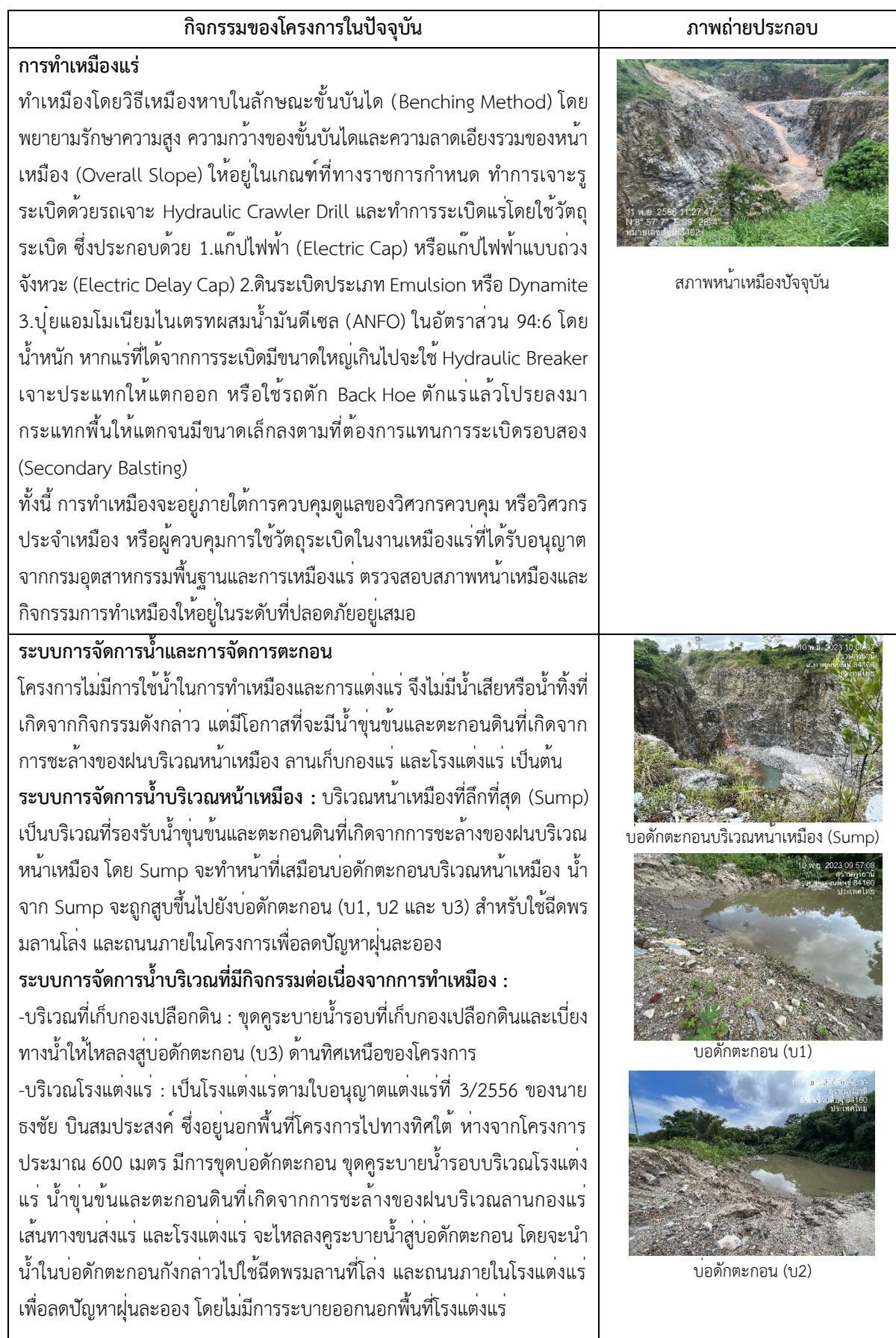
ตารางที่ 1-1 แสดงรายละเอียดของการดำเนินกิจกรรมของโครงการในปัจจุบัน