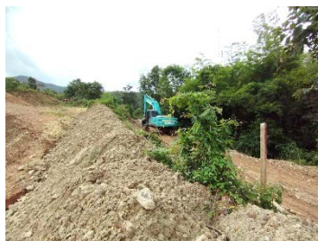
แนวเวนไม่ทำเหมือง