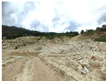
พื้นที่หน้าเมืองปัจจุบัน

พื้นที่โครงการ ประทานบัตรที่ 30451/15783