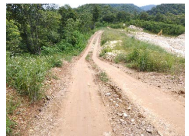
เส้นทางขนส่งแร่