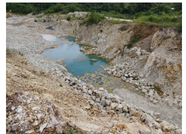
บ่อรองรับน้ำ