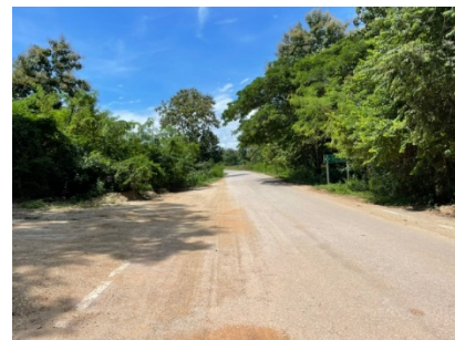
ทางหลวงหมายเลข 1335