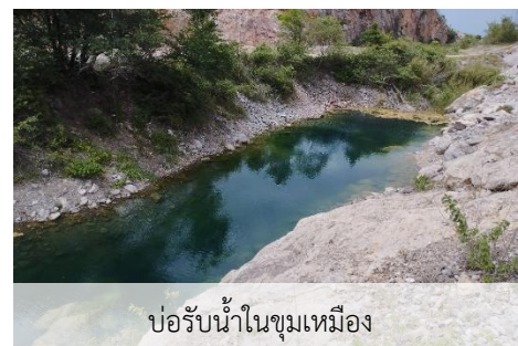
บ่อรับน้ำในชุมเหมือง