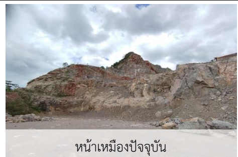
หน้าเหมืองปัจจุบัน