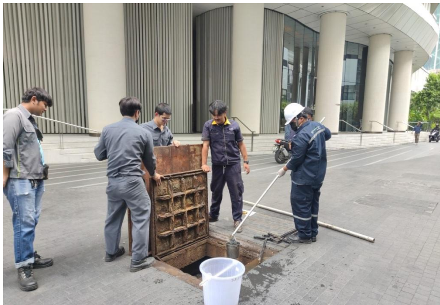
ถึงปรับสภาพน้ำ

รูปที่ 3-4 จุดการตรวจวัดคุณภาพน้ำทิ้ง (Waste Water Quality) ถึงปรับสภาพ ของโครงการ Magnolias Ratchadamri Boulevard บริษัท แมกโนเลีย ไฟน์เนสต์ คอร์ปอเรชั่น จำกัด