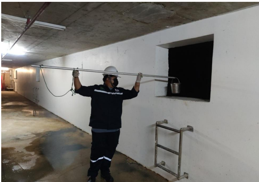
ถึงพักน้ำใส

รูปที่ 3-4 จุดการตรวจวัดคุณภาพน้ำทิ้ง (Waste Water Quality) ถึงปรับสภาพ ของโครงการ Magnolias Ratchadamri Boulevard บริษัท แมกโนเลีย ไฟน์เนสต์ คอร์ปอเรชั่น จำกัด