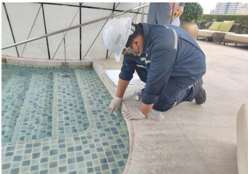
สระว่ายน้ำบริเวณส่วนตื้น

รูปที่ 3-6 จุดผลการตรวจวัดคุณภาพน้ำจากสระว่ายน้ำ (Swimming pool water) สระว่ายน้ำบริเวณส่วนลึก ของโครงการ Magnolias Ratchadamri Boulevard บริษัท แมกโนเลีย ไฟน์เนสต์ คอร์ปอเรชั่น จำกัด