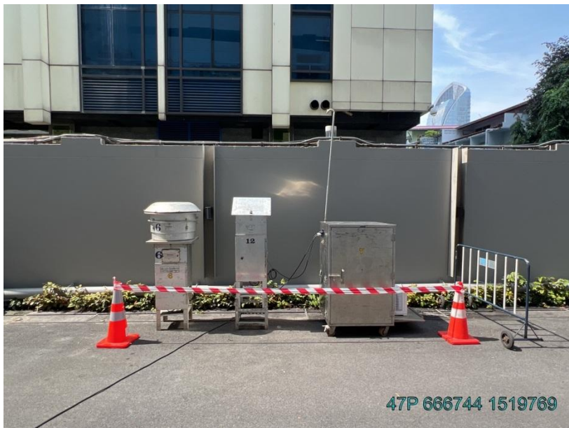
ภายในพื้นที่โครงการ

รูปที่ 3-2 จุดตรวจวัดคุณภาพอากาศในบรรยากาศโดยทั่วไป (Ambient Air Quality) ของโครงการ โรงแรม Magnolias Ratchadamri Boulevard บริษัท แมกโนเลีย ไฟน์เนสต์ คอร์ปอเรชั่น จำกัด