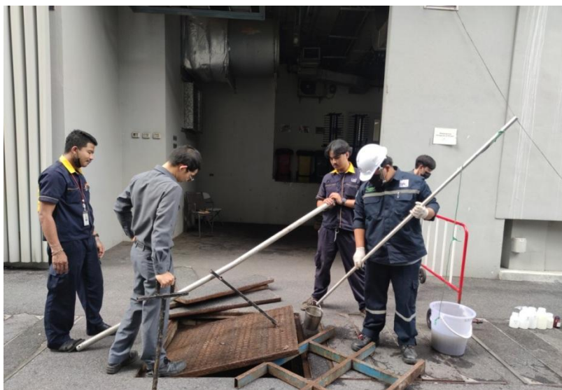
บ่อพักสุดท้าย

รูปที่ 3-2 จุดตรวจวัดคุณภาพอากาศในบรรยากาศโดยทั่วไป (Ambient Air Quality) ของโครงการ โรงแรม Magnolias Ratchadamri Boulevard บริษัท แมกโนเลีย ไฟน์เนสต์ คอร์ปอเรชั่น จำกัด