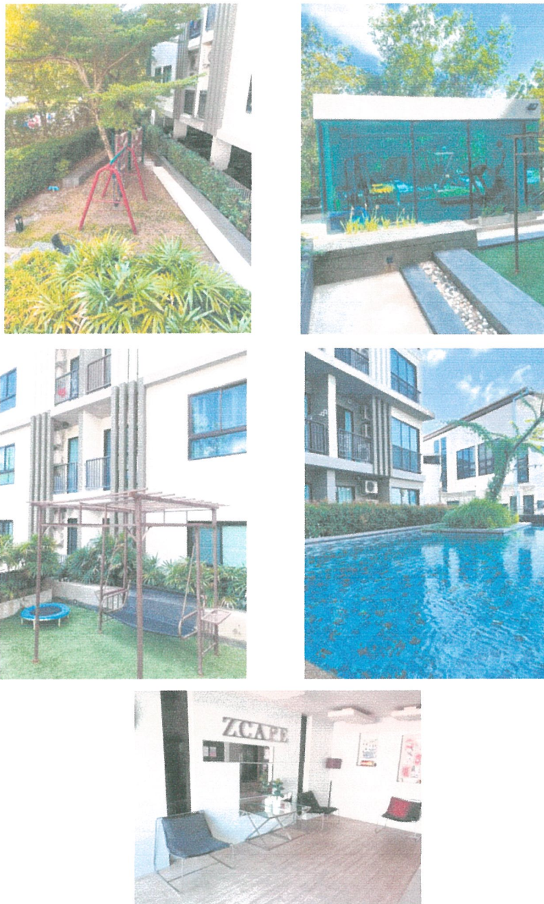
รูปภาพที่ 1.3 การใช้พื้นที่อาคาร