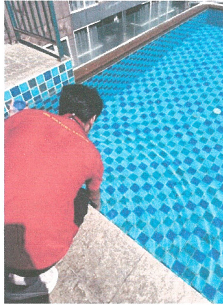
รูปภาพที่ 3.2 การเก็บตัวอย่างน้ำสระว่ายน้ำ