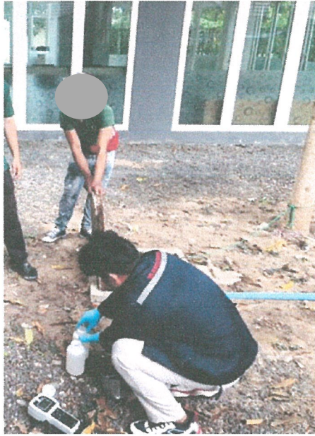
รูปภาพที่ 3.1 การเก็บตัวอย่างน้ำผ่านการบำบัด

การตรวจวิเคราะห์คุณภาพน้ำของโครงการ OZONE Condotel Kata beach ในระยะดำเนินการ ประจำเดือน มกราคม-มิถุนายน 2566 คือ น้ำผ่านการบำบัด แสดงดังรูปภาพที่ 3.1 และน้ำสระว่ายน้ำ แสดงดังรูปภาพที่ 3.2