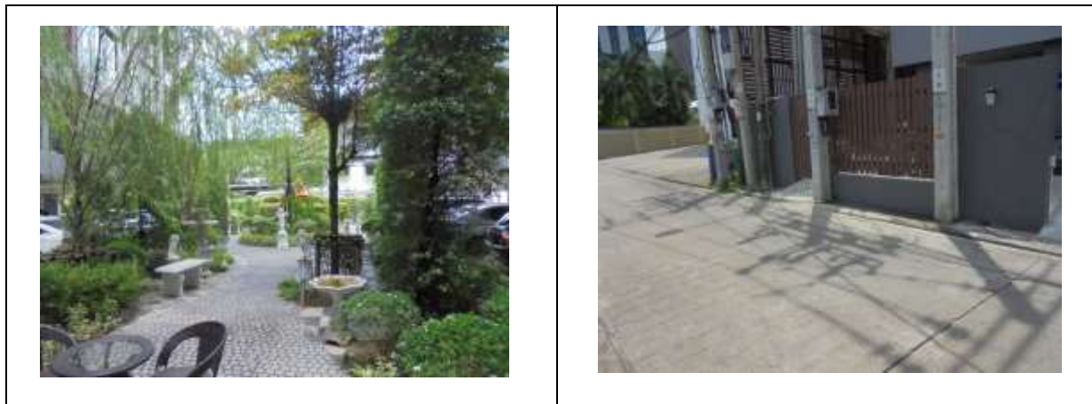
รูปที่ 1.7-1 สถานภาพปัจจุบันของโครงการ

สถานภาพของโครงการในปัจจุบัน ขณะทำการสำรวจเมื่อเดือนมิถุนายน 2566 พบว่า โครงการอยู่ในช่วงระยะดำเนินการ แสดงสถานภาพโครงการในปัจจุบันได้ดังรูปที่ 1.7-1