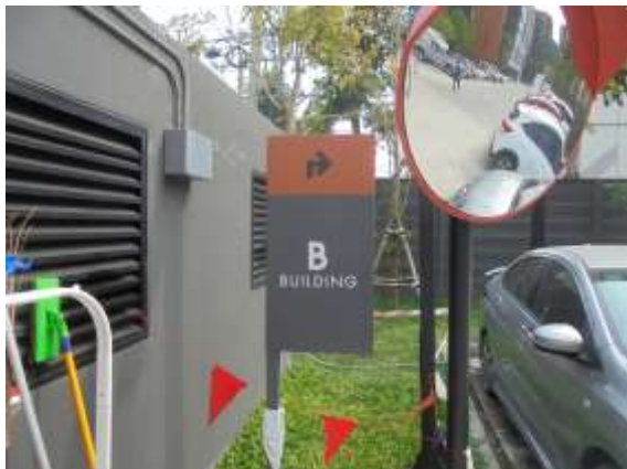
รูปที่ 25 ป้ายจราจรภายในพื้นที่โครงการ