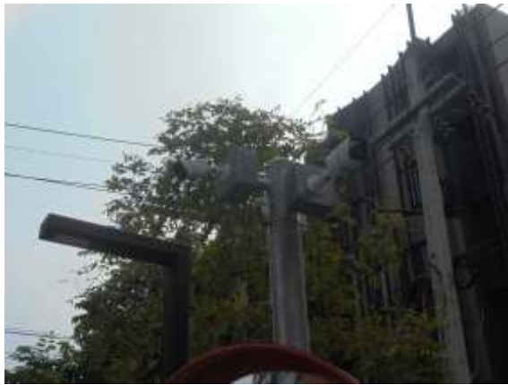
รูปที่ 31 ติดตั้งกล้องวงจรปิด CCTV