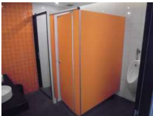
รูปที่ 41 ห้องน้ำและห้องส้วมบริเวณสระว่ายน้ำ