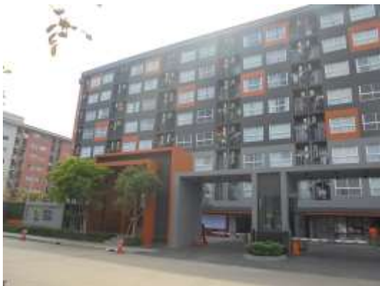
รูปที่ 1 คู่มือรักษาพื้นที่จัดภูมิทัศน์ให้สะอาดและเป็นระเบียบเรียบร้อย