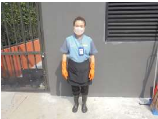
รูปที่ 11 อุปกรณ์ป้องกันอันตรายส่วนบุคคลสำหรับ พนักงานเก็บมูลฝอย