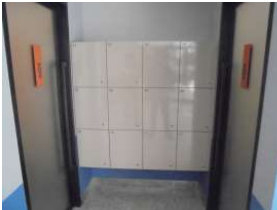
รูปที่ 39 ห้องเปลี่ยนเสื้อผ้า