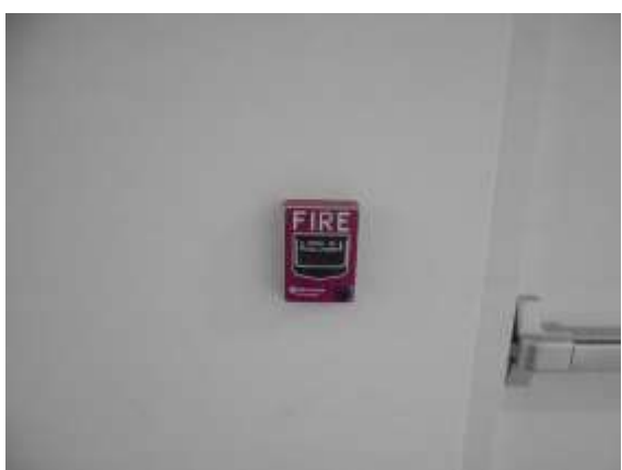
รูปที่ 17 ปุ่มกดแจ้งสัญญาณอัคคีภัย