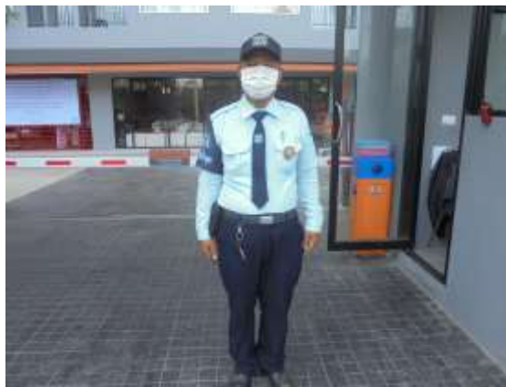
รูปที่ 26 เจ้าหน้าที่อำนวยความสะดวกบริเวณ ทางเข้า-ออกโครงการ