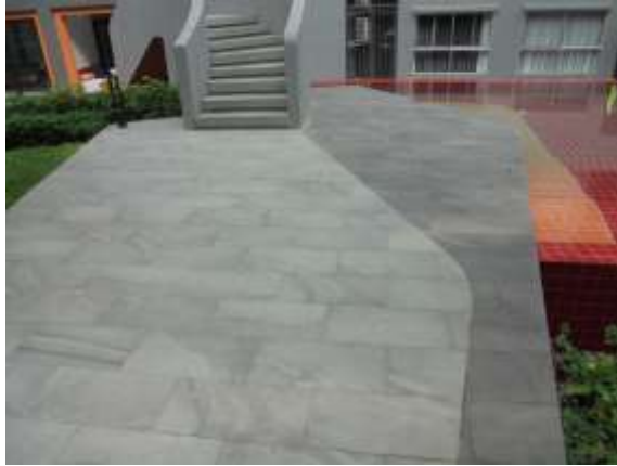
รูปที่ 43 ทางเดินรอบสระ