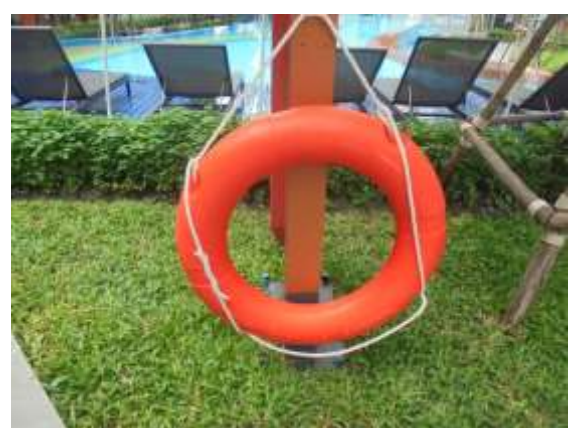
รูปที่ 36 ห่วงชูชีพ