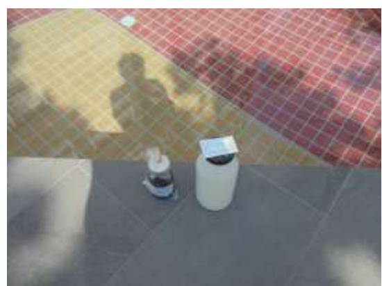
รูปที่ 48 ตรวจวัดคุณภาพสระว่ายน้ำ