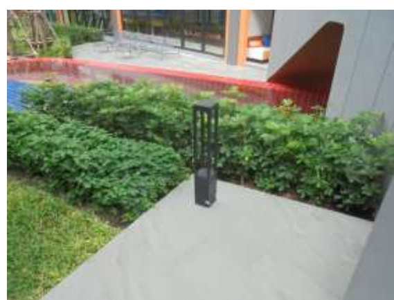
รูปที่ 46 ติดตั้งไฟส่องสว่างบริเวณสระว่ายน้ำ