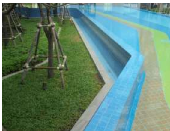
รูปที่ 35 รางระบายน้ำล้น