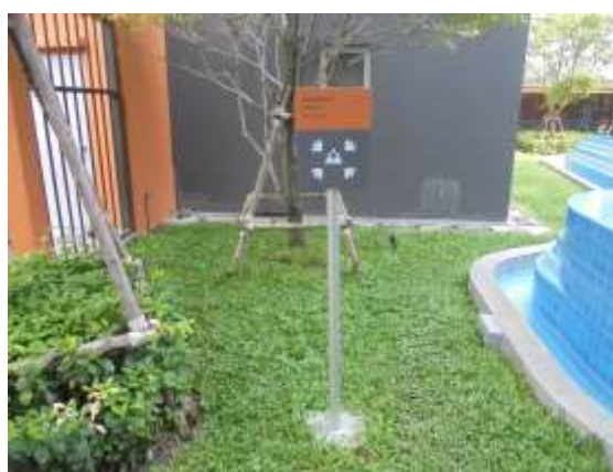
รูปที่ 22 จุดรวมพล