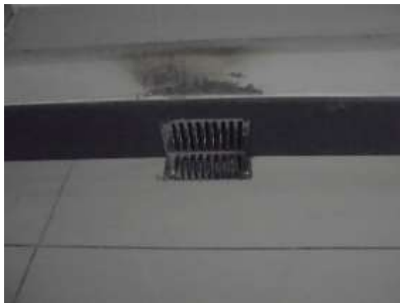
รูปที่ 33 ตะแกรงครอบระบายน้ำทิ้ง