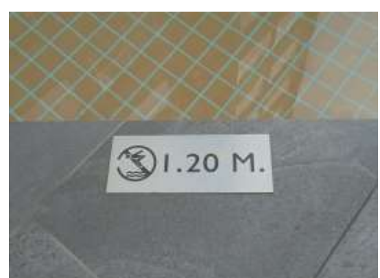
รูปที่ 42 ป้ายบอกความลึก