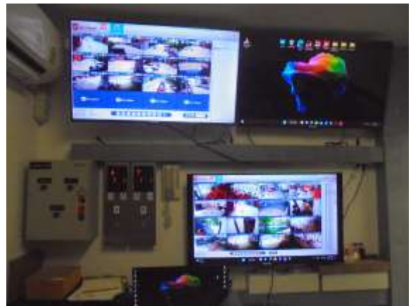
รูปที่ 32 ติดตั้งกล้องวงจรปิด