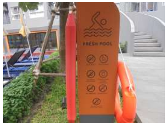
รูปที่ 40 ป้ายแสดงข้อปฏิบัติสำหรับผู้ที่มาใช้บริการ บริเวณสระว่ายน้ำ