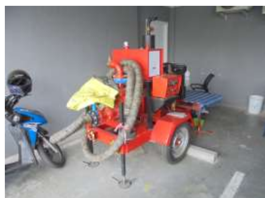
รูปที่ 6 เครื่องสูบน้ำเคลื่อนที่