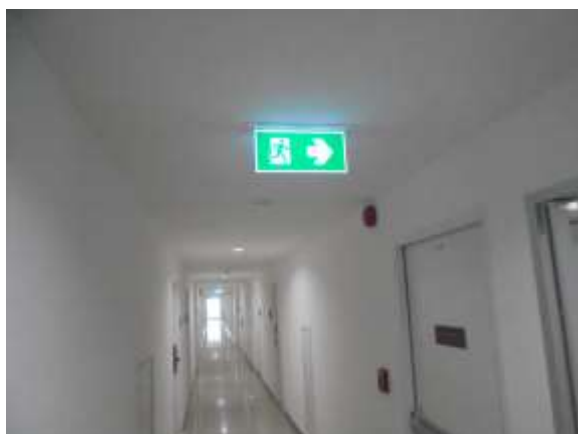
รูปที่ 21 ป้ายบอกทิศทางหนีไฟ