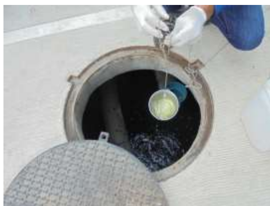
รูปที่ 47 ตรวจวัดคุณภาพน้ำทิ้ง