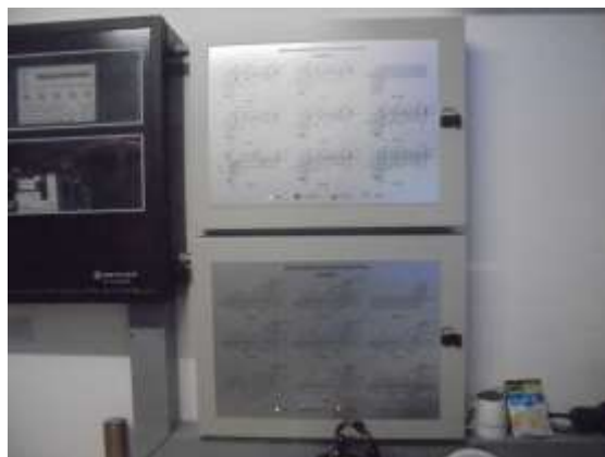
รูปที่ 14 แผงควบคุมระบบแจ้งเหตุอัคคีภัย