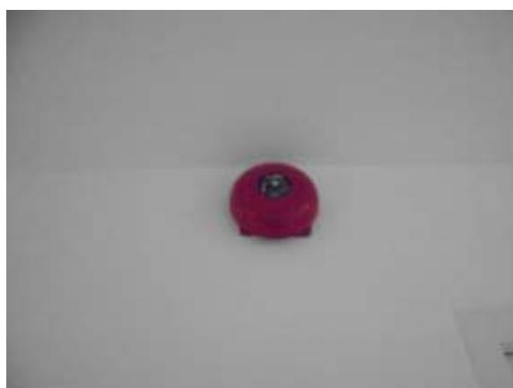
รูปที่ 16 กริ่งสัญญาณเตือนภัย