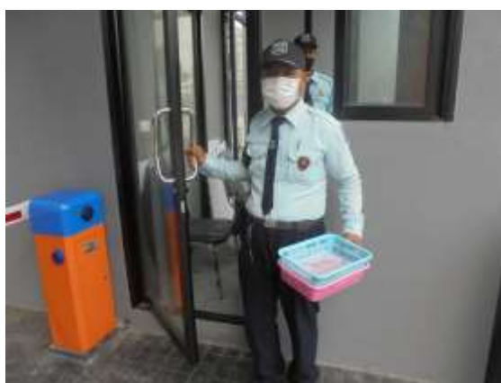
รูปที่ 29 จุดรับ-คืนบัตรจอดรถภายในพื้นที่โครงการ