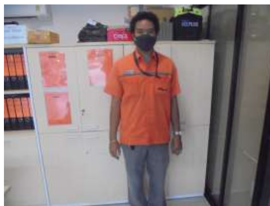
รูปที่ 4 เจ้าหน้าที่ดูแลรักษาและควบคุมระบบบำบัดน้ำเสีย