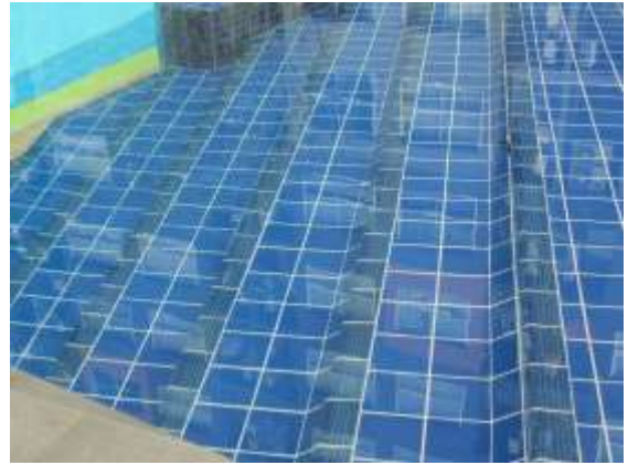
รูปที่ 44 แถบกันลื่นบริเวณบันได