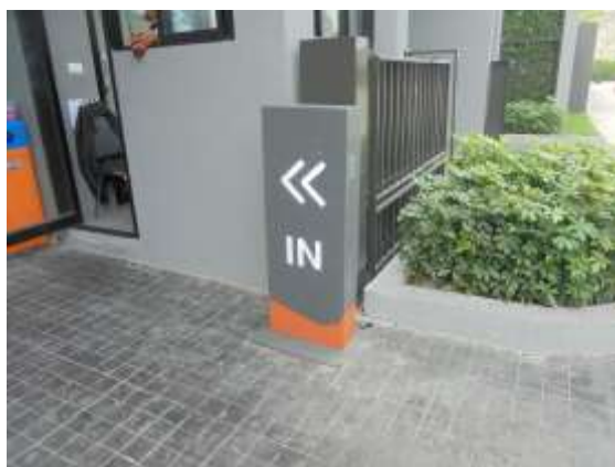
รูปที่ 27 ป้ายแสดงทางเข้า-ออกโครงการ