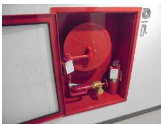
รูปที่ 18 ถังดับเพลิงเคมีแบบถือในตู้ FHC