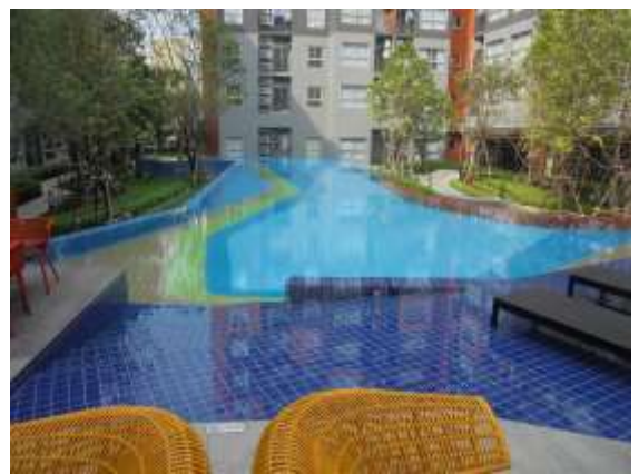
รูปที่ 34 โครงสร้างสระว่ายน้ำ