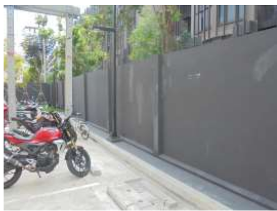
รูปที่ 30 รั้วรอบพื้นที่โครงการ