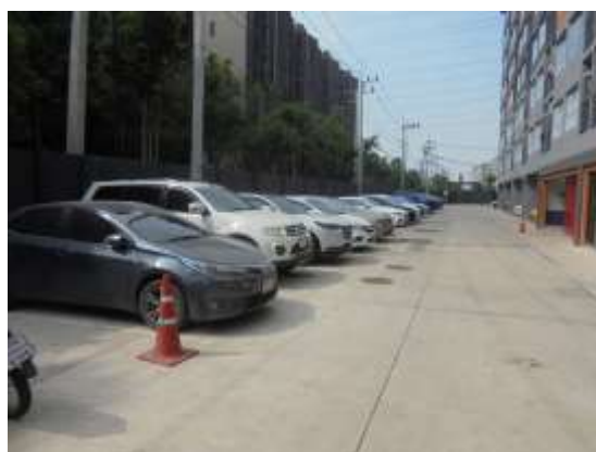
รูปที่ 24 บริเวณพื้นที่จอดรถยนต์