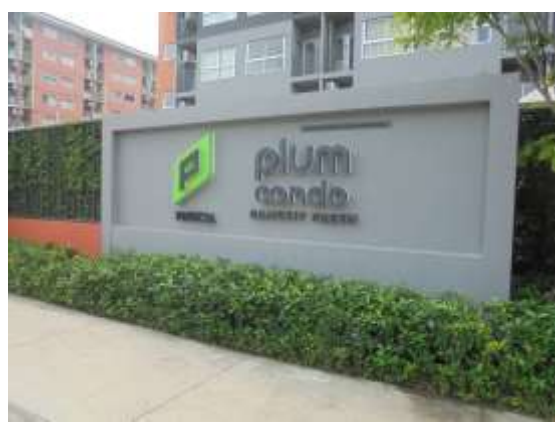
รูปที่ 28 ป้ายบอกชื่อโครงการ