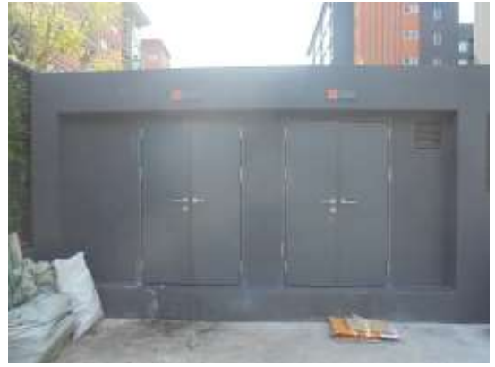
รูปที่ 8 ห้องพักขยะรวม