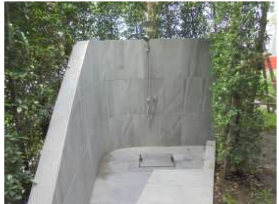
รูปที่ 38 อ่างล้างมือบริเวณล้างตัวก่อนลงสระว่ายน้ำ