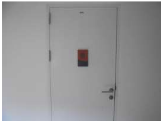
รูปที่ 10 ห้องพักขยะอันตราย