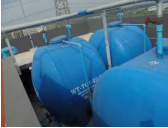
รูปที่ 7 ถังสำรองน้ำใช้