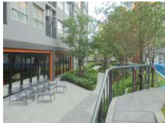
รูปที่ 2 พื้นที่สีเขียวภายในโครงการ