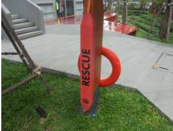
รูปที่ 37 โฟมช่วยชีวิต