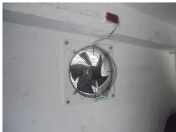
รูปที่ 23 ติดตั้งพัดลมระบายอากาศ