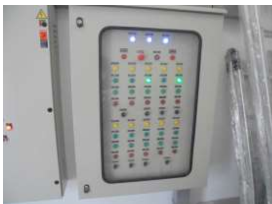
รูปที่ 5 ตู้ควบคุมไฟฟ้าแสดงสถานการณ์ทำงาน