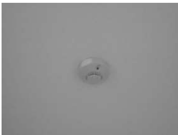
รูปที่ 15 เครื่องตรวจจับควัน