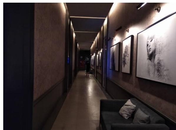
รูปที่ 1.4-1 แสดงสถานภาพปัจจุบันของโครงการ (ช่วงเดือนมกราคม - มิถุนายน 2566)