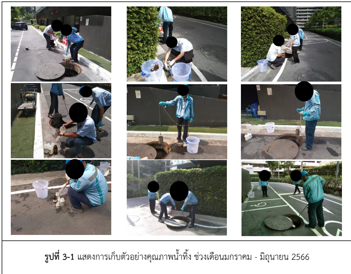
รูปที่ 3-1 แสดงการเก็บตัวอย่างคุณภาพน้ำทิ้ง ช่วงเดือนมกราคม - มิถุนายน 2566

การตรวจวัดคุณภาพน้ำทิ้ง ทำการเก็บตัวอย่างคุณภาพน้ำ 2 จุด ได้แก่ บริเวณจุดปล่อยน้ำเสียก่อนเข้าระบบบำบัดน้ำเสีย และบริเวณจุดปล่อยน้ำทิ้งจากบ่อพักน้ำทิ้ง ช่วงเดือนมกราคม - มิถุนายน 2566 เดือนละ 1 ครั้ง (แสดงการเก็บตัวอย่างคุณภาพน้ำทิ้ง ช่วงเดือนมกราคม - มิถุนายน 2566 ดังแสดงในรูปที่ 3-1)