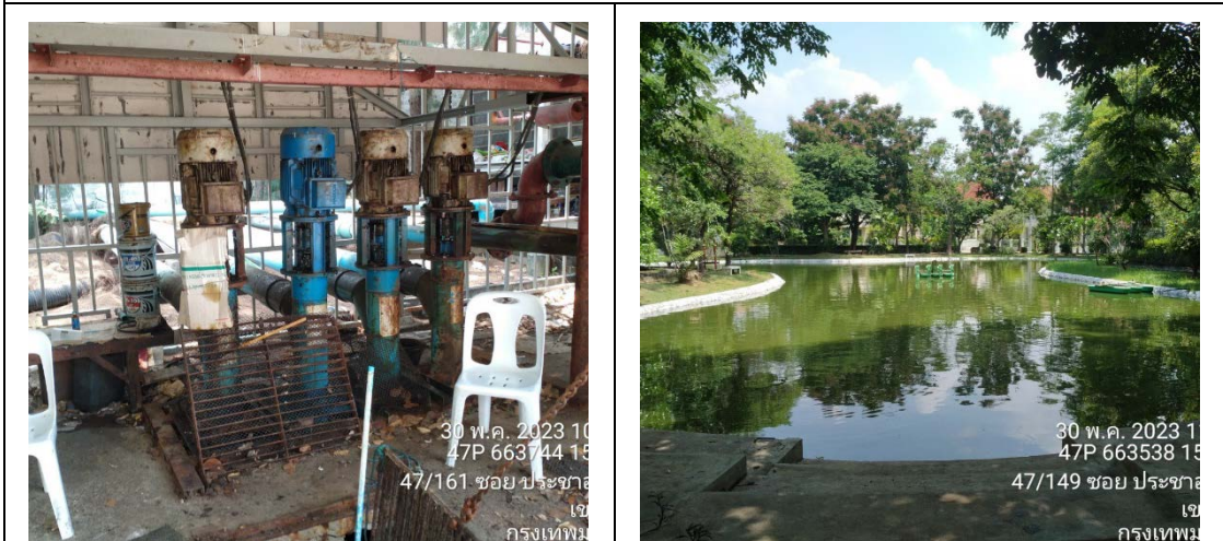
รูปที่ 2 ระบบบำบัดน้ำเสียประจำโครงการ