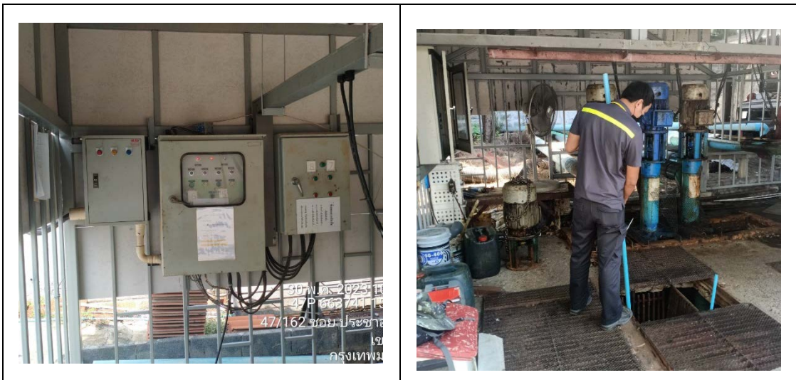
รูปที่ 1 ปัมระบบบำบัดน้ำเสียและเจ้าหน้าที่ดูแลระบบ