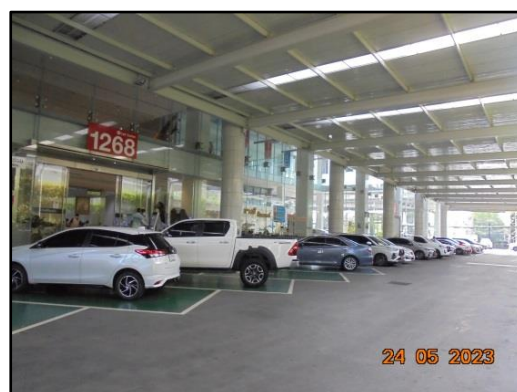
รูปที่ 1.2 สภาพปัจจุบันของโครงการ