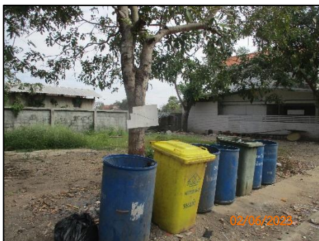
จุดทิ้งขยะภายในโครงการ