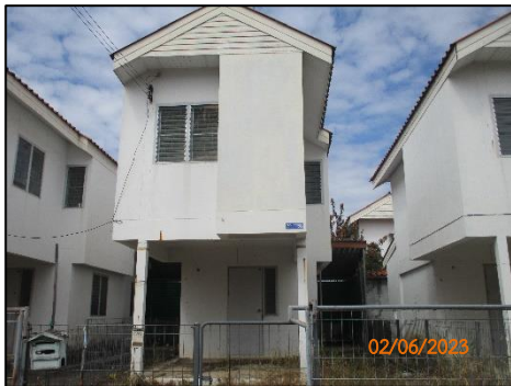
ลักษณะหน่วยพักอาศัย