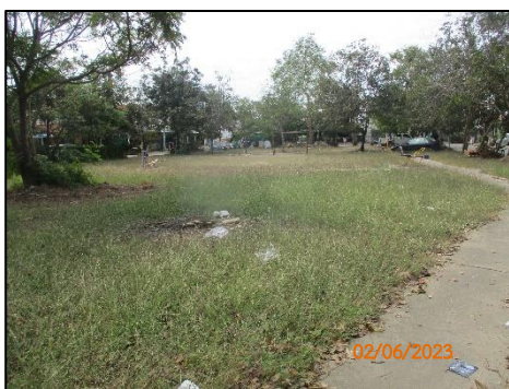
พื้นที่สีเขียว