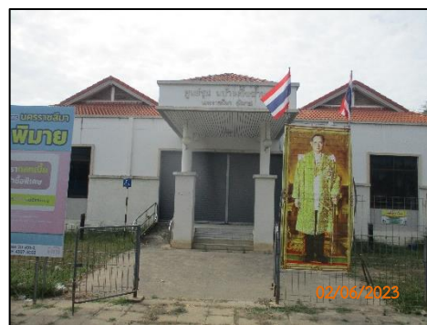
ศูนย์ชุมชน