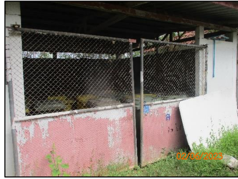
โรงพักขะมูลฝอย

รูปที่ 1-3 พื้นที่ภายในโครงการปัจจุบัน (ต่อ)