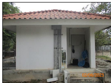
ระบบบำบัดน้ำเสีย ชุดที่ 1