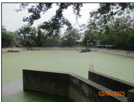
บ่อหน่วยน้ำชุดที่ 2