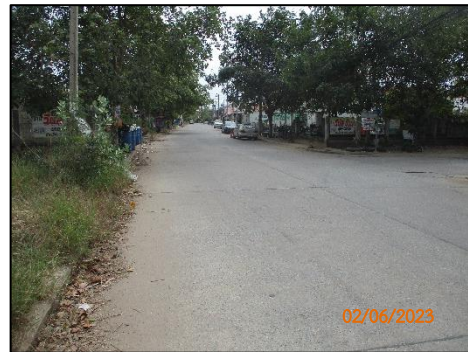
ถนนภายในโครงการ