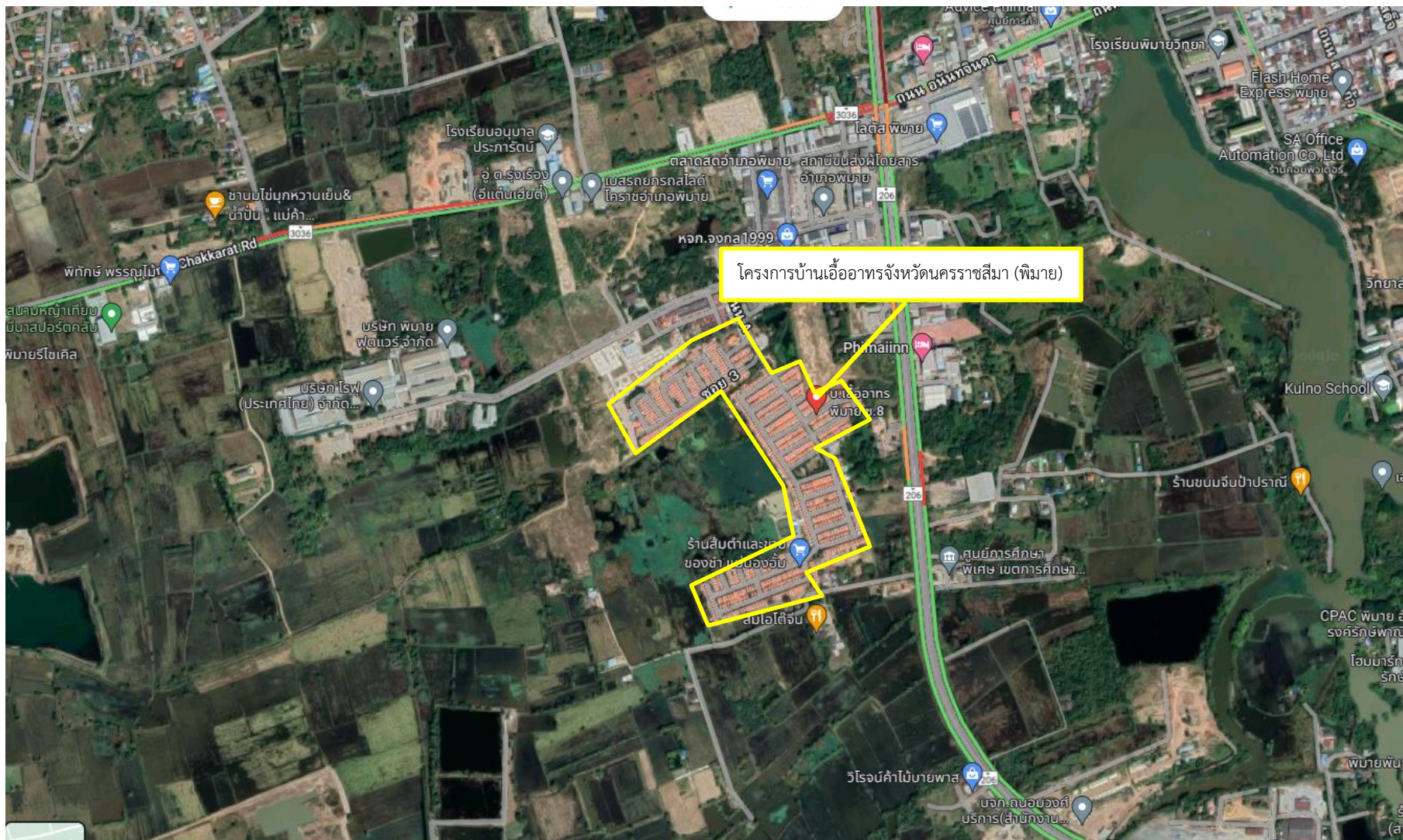
รูปที่ 1-1 ที่ตั้งโครงการ