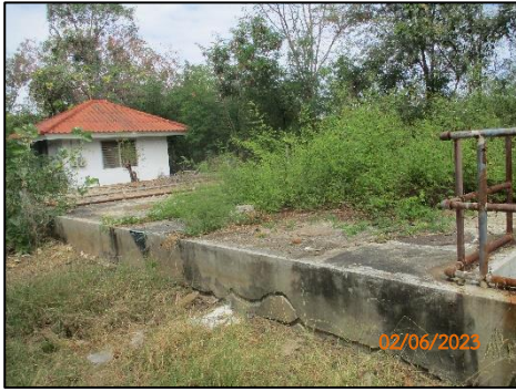
ระบบบำบัดชุดที่ 2