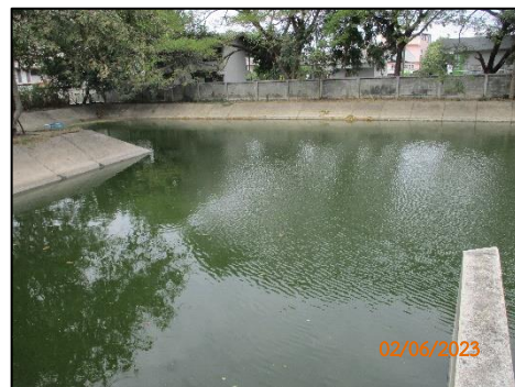
บ่อหน่วยน้ำชุดที่ 1