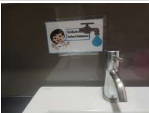
รูปที่ 9 ป้าย “รณรงค์การใช้น้ำอย่างประหยัด”