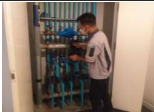
รูปที่ 12 เจ้าหน้าที่ดูแลเส้นท่อประปา