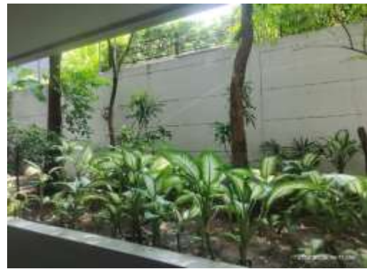
รูปที่ 4 รั้วรอบพื้นที่โครงการ