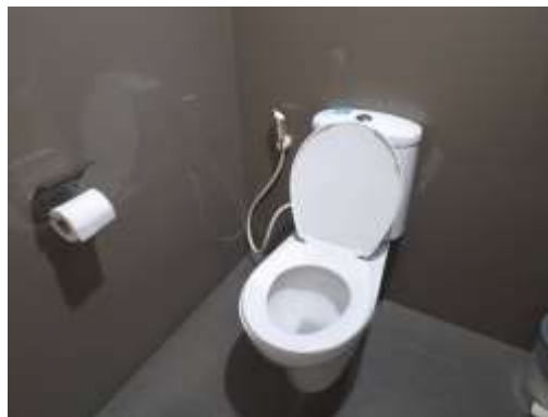
รูปที่ 11 สุขภัณฑ์ประหยัน้ำ