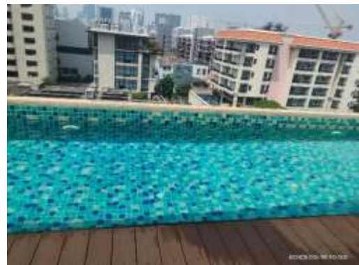
รูปที่ 47 สระว่ายน้ำ