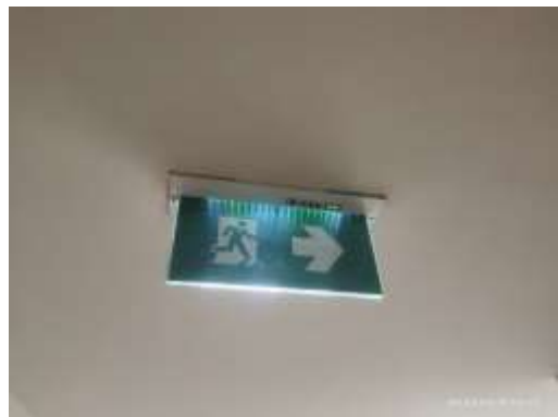
รูปที่ 37 ป้ายทางหนีไฟ