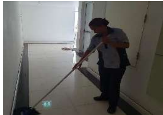
รูปที่ 1 เจ้าหน้าที่ทำความสะอาดภายในโครงการ