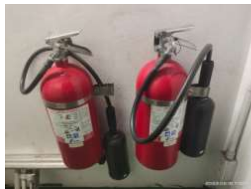
รูปที่ 32 ถังดับเพลิงและตู้เก็บสายฉีดน้ำดับเพลิง