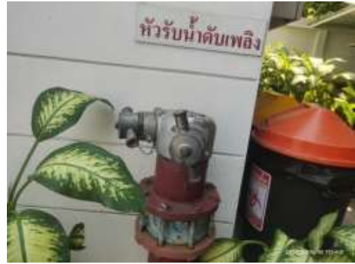
รูปที่ 42 หัวรับน้ำดับเพลิง