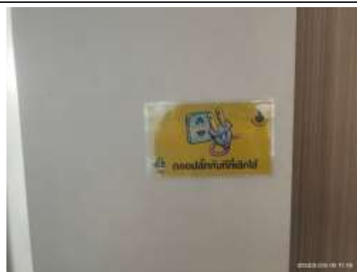
รูปที่ 10 ป้าย “รณรงค์การใช้พลังงานอย่างประหยัด”