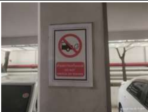
รูปที่ 5 ป้าย “ห้ามสตาร์ทเครื่องยนต์”