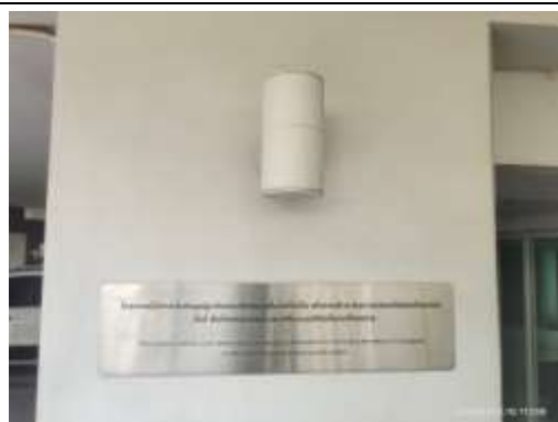
รูปที่ 23 ไฟฟ้าส่องสว่างบริเวณรั้วโครงการ