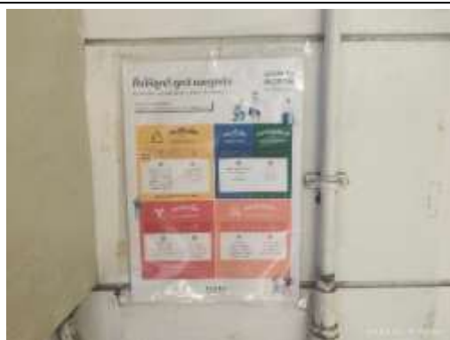
รูปที่ 16 ป้าย “รณรงค์คัดแยกขยะ”