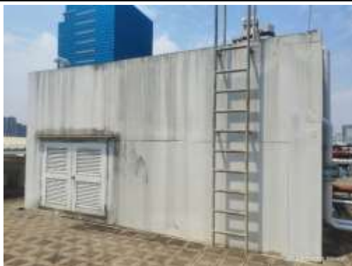
รูปที่ 13 ถังเก็บน้ำสำรองชั้นดาดฟ้า