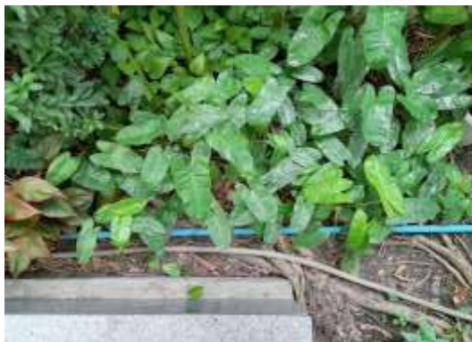
รูปที่ 48 ท่อน้ำที่ผ่านการบำบัดแล้ว