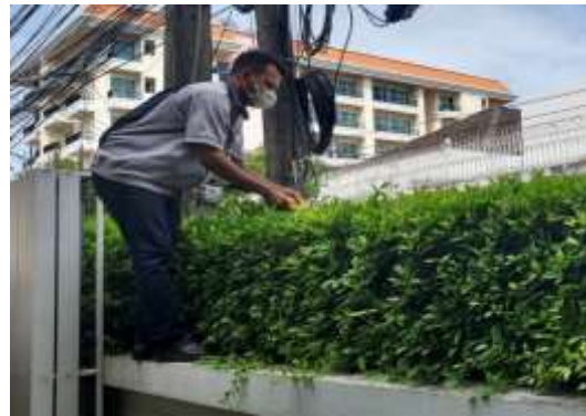
รูปที่ 3 เจ้าหน้าที่ดูแลพื้นที่สีเขียว