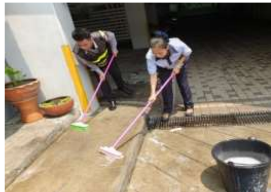
รูปที่ 2 เจ้าหน้าที่ทำความสะอาดฉีดล้างถนนบริเวณพื้นที่โครงการ