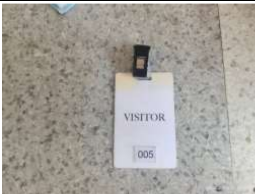
รูปที่ 38 บัตรผู้มาติดต่อ