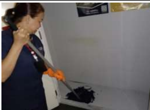
รูปที่ 22 เจ้าหน้าที่ทำความสะอาดห้องพักมูลฝอย