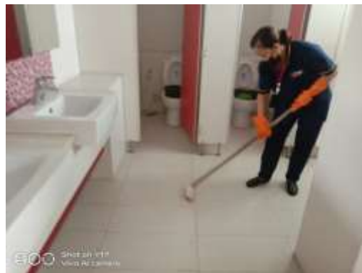
รูปที่ 29 เจ้าหน้าที่ทำความสะอาดห้องน้ำ