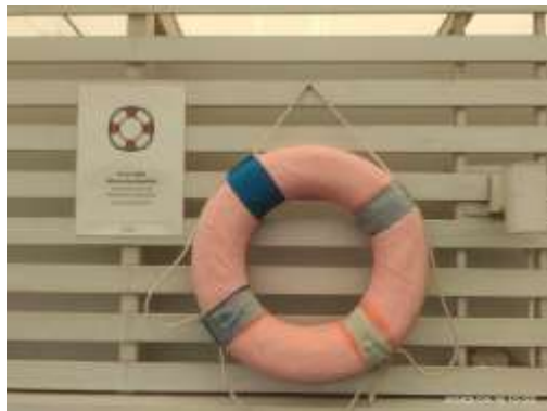
รูปที่ 45 ห่วงชูชีพ