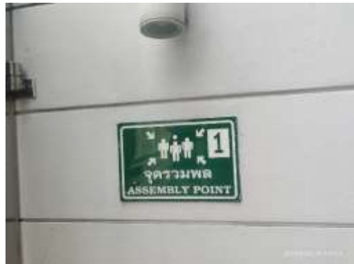
รูปที่ 36 จุดรวมพล