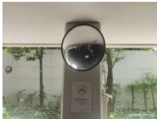
รูปที่ 20 กระงกหนู