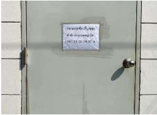
รูปที่ 41 ป้ายบอกช่วงเวลาการเก็บขนมูลฝอย