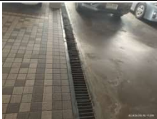
รูปที่ 15 รางระบายน้ำ