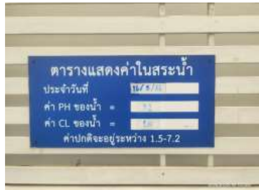
รูปที่ 46 ป้ายแสดงค่า pH และคลอรีน