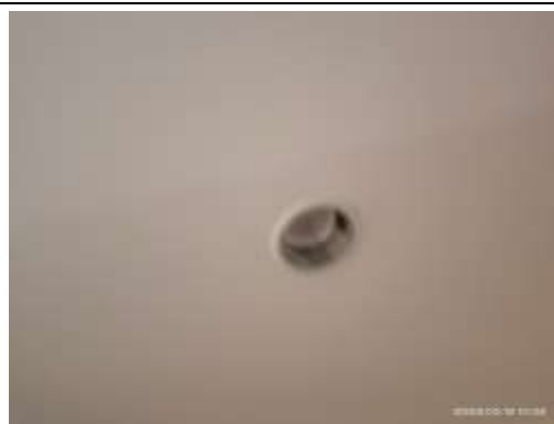
รูปที่ 25 สุขภัณฑ์ไฟฟ้า