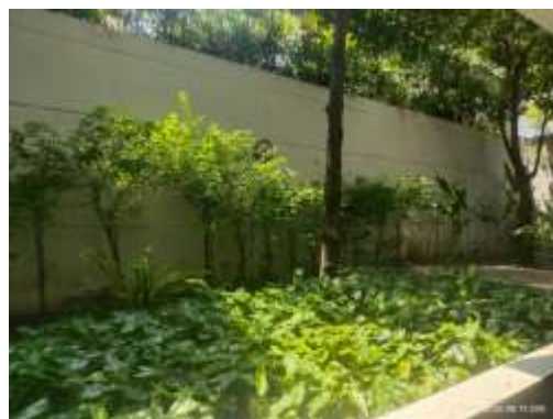
รูปที่ 26 พื้นที่สีเขียว