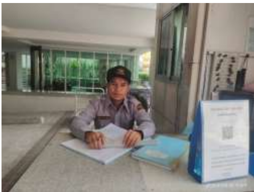
รูปที่ 19 เจ้าหน้าที่รักษาความปลอดภัย ภายในโครงการ