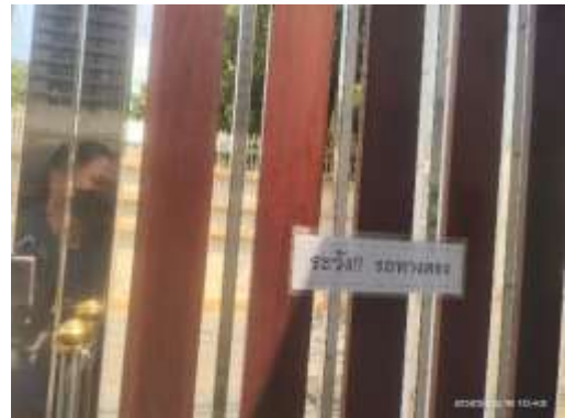
รูปที่ 44 ป้ายระวางรถด้านหน้าโครงการ