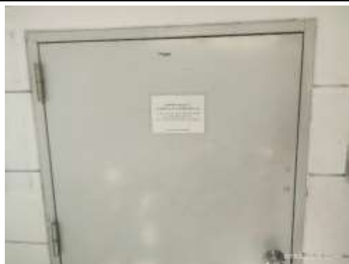
รูปที่ 18 ห้องพักมูลฝอยรวม