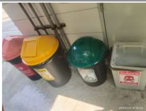
รูปที่ 17 ภาชนะรองรับมูลฝอย