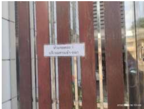
รูปที่ 43 ป้ายห้ามจอดรถหน้าโครงการ