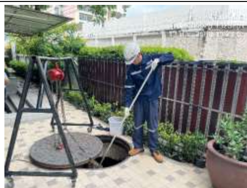
รูปที่ 7 เจ้าหน้าที่ตรวจสอบคุณภาพน้ำ