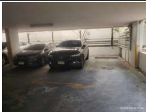
รูปที่ 24 พื้นที่จอดรถ