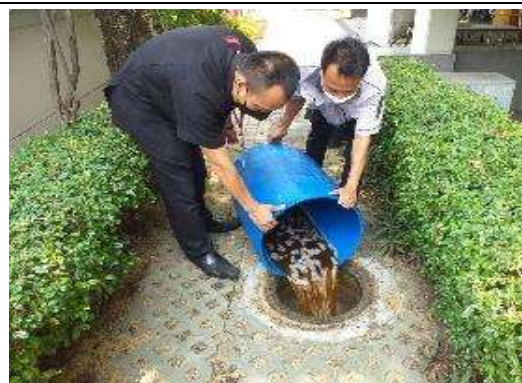
รูปที่ 8 เจ้าหน้าที่ดูแลระบบบำบัดน้ำเสีย