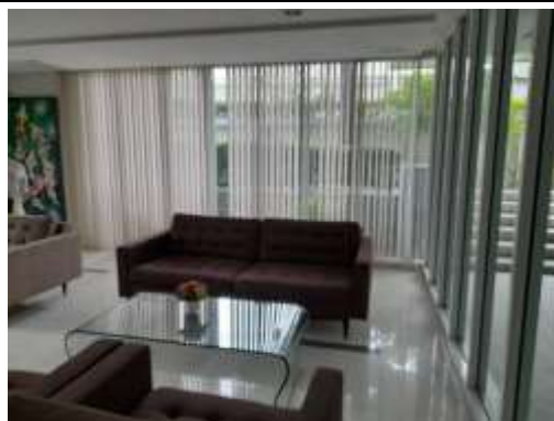
รูปที่ 49 กระจัดภายในโครงการ