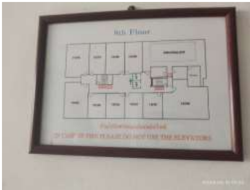
รูปที่ 35 แผนผังเส้นทางหนีไฟ