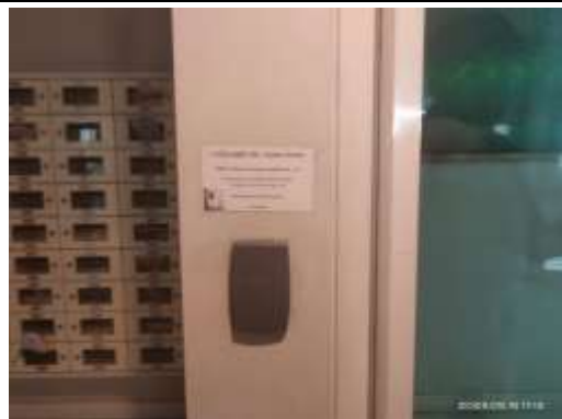
รูปที่ 39 ระบบคีย์การ์ดเข้า-ออกอาคาร