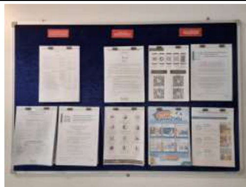
รูปที่ 6 เบอร์ติดต่อฉุกเฉิน