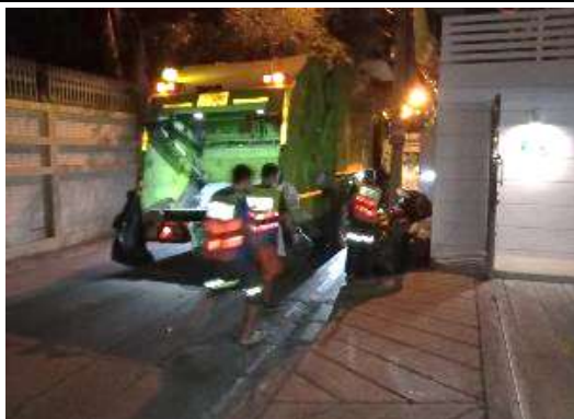
รูปที่ 21 เจ้าหน้าที่ขนย้ายขยะมูลฝอย