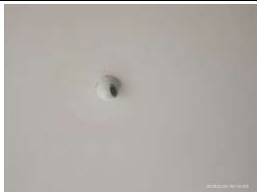
รูปที่ 40 ระบบโทรทัศน์วงจรปิด (CCTV System)