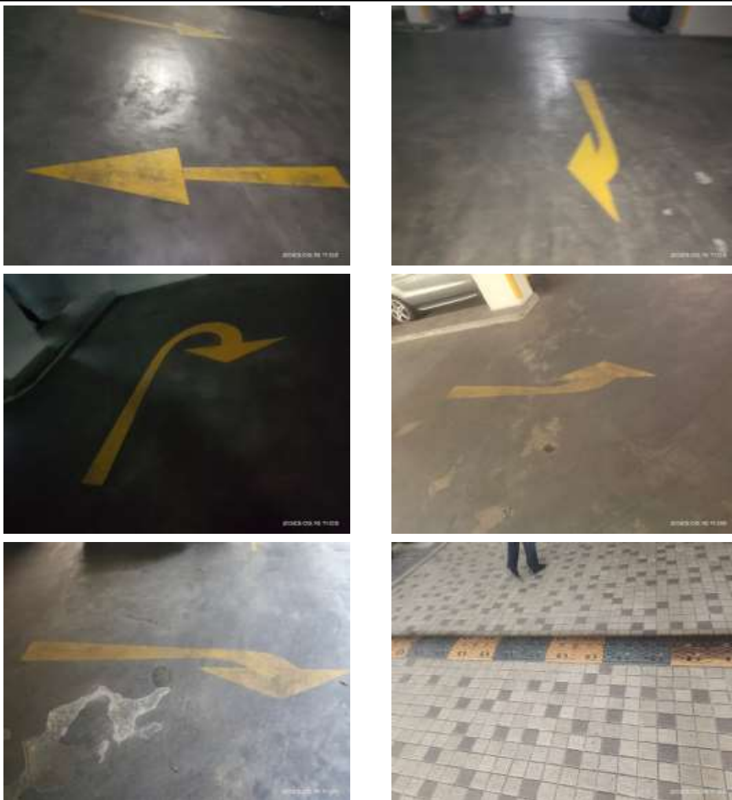
รูปที่ 27 เครื่องหมายจราจรแสดงทิศทางการเดินรถบนพื้นถนน