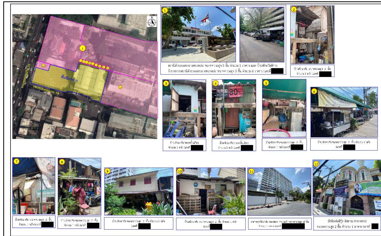
รูปที่ 1-1 ผังแสดงที่ตั้งโครงการ