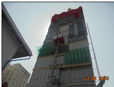
รูปที่ 1-2 สภาพปัจจุบันของโครงการ