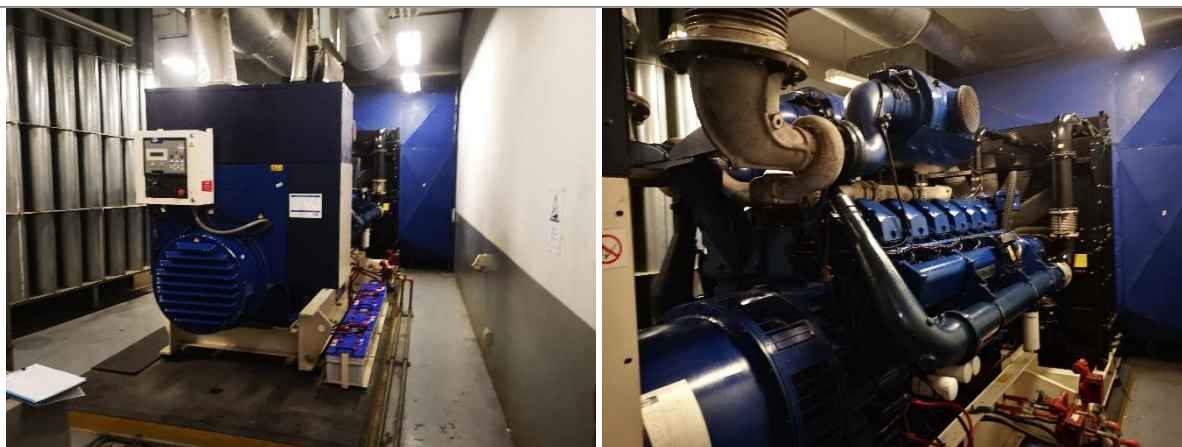
รูปที่ 2-9 เครื่องกำเนิดไฟฟ้าฉุกเฉินโดยเครื่องยนต์ดีเซล ขนาด 1500 KVA

1) พลังงานที่เกี่ยวข้องกับระบบรวม : ทางโครงการได้ติดตั้งอุปกรณ์บันทึกการใช้พลังงาน ได้แก่ อุปกรณ์บันทึกค่าความต้องการพลังไฟฟ้าและอุปกรณ์บันทึกค่าเพาเวอร์แฟคเตอร์ โดยอุปกรณ์ควบคุมค่าเพาเวอร์แฟคเตอร์ใช้คาปาซิเตอร์ ขนาด 12 x 40 กิโลวาร์ จำนวน 2 สามารถรองรับพลังงานไฟฟ้ารีแอกตีฟได้สูงสุด 960 กิโลวาร์