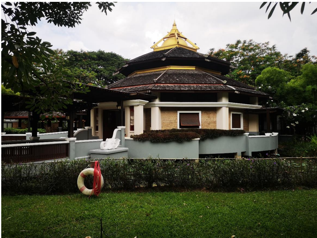
รูปที่ 2-3 อาคารสปา