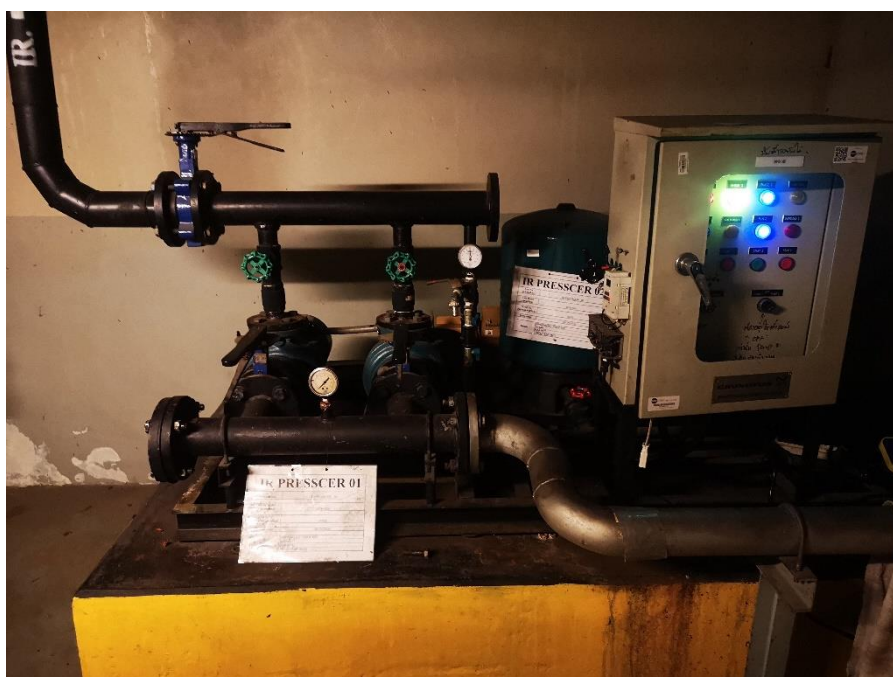
รูปที่ 2-5 เครื่องสูบน้ำหมุนเวียนกลับมาใช้ใหม่และดึงเก็บน้ำหมุนเวียนกลับมาใช้ใหม่