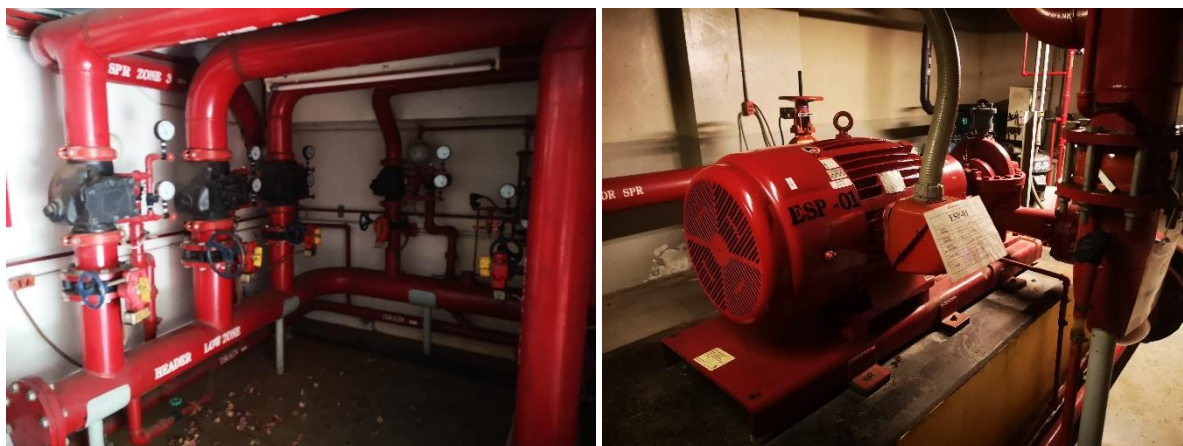
รูปที่ 2-7 เครื่องสูบน้ำดับเพลิงแบบขับเคลื่อนด้วยไฟฟ้า

นอกจากนี้ ระบบแจ้งเหตุเพลิงไหม้ยังประกอบด้วยอุปกรณ์การเชื่อมต่อกับระบบอื่น ๆ ได้แก่ ระบบลิฟท์ ระบบปรับอากาศ เครื่องสูบน้ำดับเพลิง โดยจัดเตรียม Monitor module Control module และ Voltage Free Contact สำหรับเชื่อมต่อกับระบบอื่น ๆ เพื่อให้เกิดความปลอดภัยอย่างเพียงพอต่อผู้ให้บริการและเจ้าหน้าที่ที่ปฏิบัติงานและเป็นไปตามมาตรฐาน NFPA 72