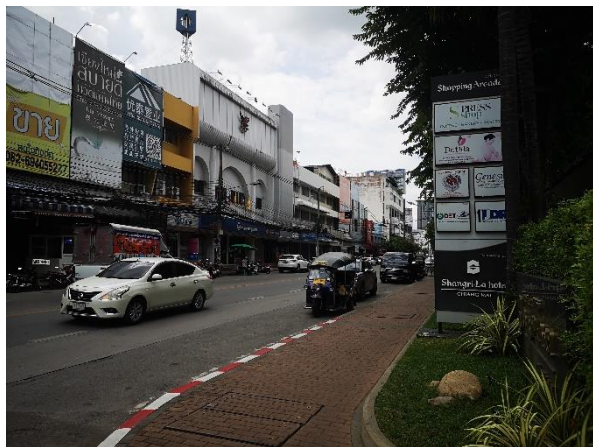
รูปที่ 2-8 ทางเข้าออกโครงการจากถนนช้างคลาน