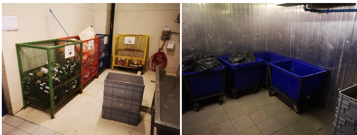
รูปที่ 2-6 ห้องพักขยะมูลฝอยรวม

สำหรับห้องพักขยะมูลฝอยรวมตั้งอยู่บริเวณชั้นล่างติดกับถนนทางทิศใต้ของโครงการ ภายในแบ่งพื้นที่ออกเป็น 3 ห้อง คือ ห้องเก็บขยะมูลฝอยแห้งและขยะรีไซเคิล มีขนาดกว้าง 2.40 เมตร ยาว 3.82 เมตร และสูง 4.80 เมตร ปริมาตรรองรับขยะ 97.54 ลบ.ม. และห้องเก็บถังขยะเปล่า สำหรับขยะมูลฝอยอันตราย จะเก็บภายในห้องพักขยะมูลฝอยแห้ง