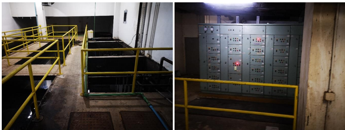
รูปที่ 2-4 ระบบบำบัดน้ำเสีย

2.6 ส่วนกำจัดเชื้อโรค (Chlorine Disinfection Tank): จำนวน 1 ถัง มีขนาดกว้าง 1.5 เมตร ยาว 4.25 เมตร ลึก 2.60 เมตร ปริมาตรกักเก็บน้ำเสีย 16.6 ลบ.ม. และมีระยะเวลาสัมผัสคลอรีน 30 นาที จากนั้นน้ำเสียซึ่งผ่านการฆ่าเชื้อโรคแล้วจะถูกรวบรวมไว้ใน Discharge Tank มีขนาดกว้าง 3.75 เมตร ยาว 4.37 เมตร ลึก 2.60 เมตร ปริมาตรกักเก็บน้ำเสีย 42.60 ลบ.ม. จากนั้นน้ำเสียส่วนหนึ่งจะถูกระบายผ่านท่อขนาดเส้นผ่าศูนย์กลาง 0.05 เมตร ไปเก็บยังถังเก็บน้ำหมุนเวียนกลับมาใช้ใหม่ ซึ่งมีความจุ 61.0 ลบ.ม. (กว้าง 3.23 เมตร ยาว 7.27 เมตร ลึก 2.60 เมตร) เพื่อนำน้ำที่ผ่านการบำบัดแล้วกลับมาใช้ประโยชน์ภายในพื้นที่โครงการ โดยใช้เครื่องสูบน้ำเพื่อนำน้ำไปรดน้ำต้นไม้ สำหรับน้ำส่วนที่เหลือจะไหลล้นออกจาก Discharge Tank ระบายผ่านท่อขนาด 0.08 เมตร ลงสู่ท่อระบายน้ำสาธารณะของเทศบาลนครเชียงใหม่บริเวณด้านหน้าโครงการต่อไป