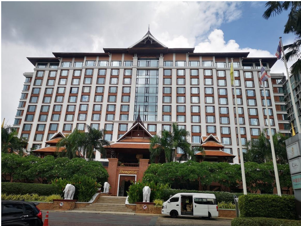
รูปที่ 2-2 อาคารโรงแรม