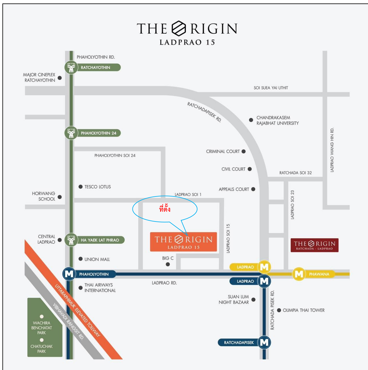
รูปที่ 1-1 แผนที่แสดงตำแหน่งที่ตั้งโครงการ

ทั้งนี้ ในการเดินทางเข้า - ออกพื้นที่โครงการสามารถใช้บริการรถไฟฟ้ามหานครสายสีน้ำเงิน ซึ่งสถานีที่ใกล้โครงการมากที่สุดคือ สถานีลาดพร้าว โดยมีระยะห่างจากโครงการประมาณ 500 เมตร เส้นทางเดินทางเข้า - ออกโครงการ แสดงดังรูปที่ 1-2