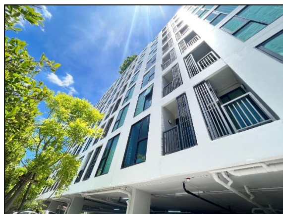
รูปที่ 1-3 สภาพโครงการปัจจุบัน