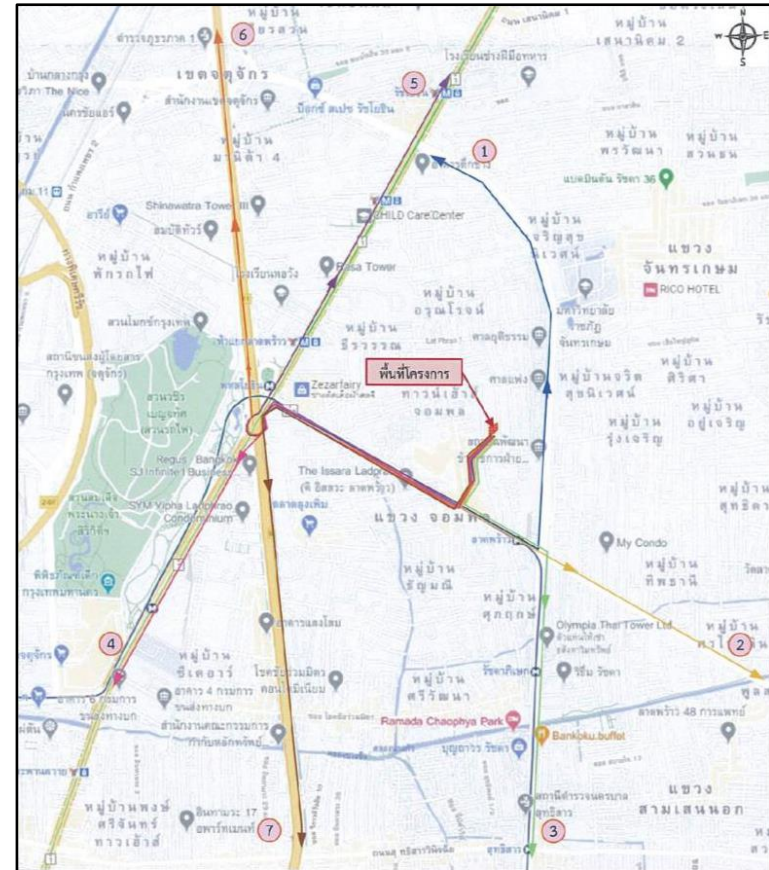
(2) เส้นทางเดินทางออกจากโครงการ