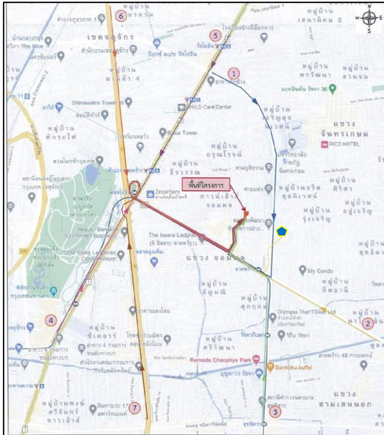
(1) เส้นทางเดินทางเข้าสู่โครงการ