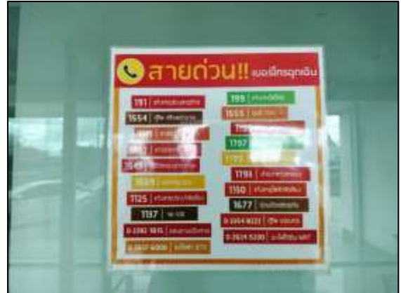
ภาพที่ 25 เบอร์โทรฉุกเฉิน