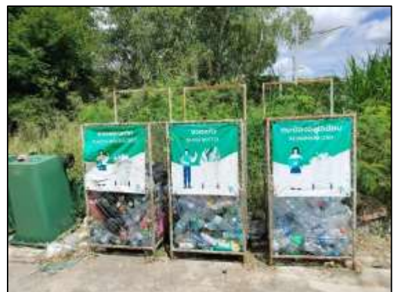
ภาพที่ 16 ถังขยะแยกประเภท