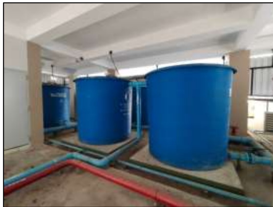
ภาพที่ 13 ถังสำรองน้ำใช้