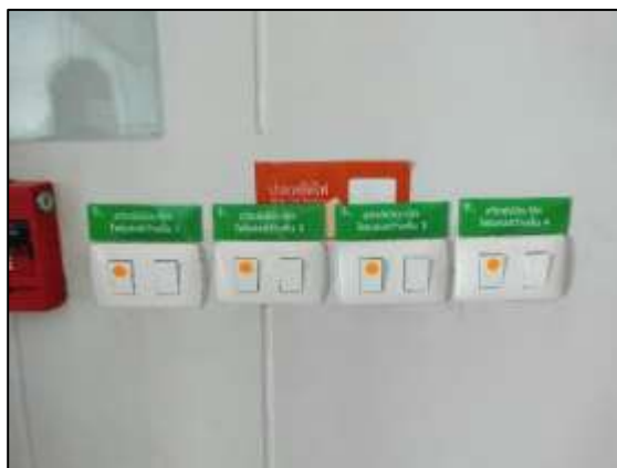
ภาพที่ 15 ป้ายประหยัดไฟ