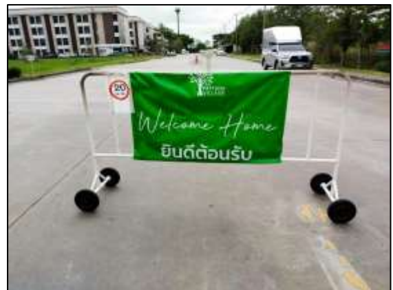
ภาพที่ 4 ป้ายกำหนดความเร็ว