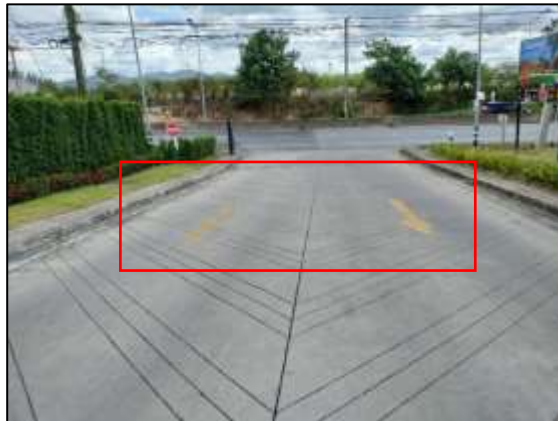
ภาพที่ 11 ลูกศรแสดงทิศทางเข้า – ออกโครงการ