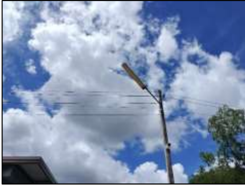
ภาพที่ 24 ไฟส่องสว่างรอบโครงการ