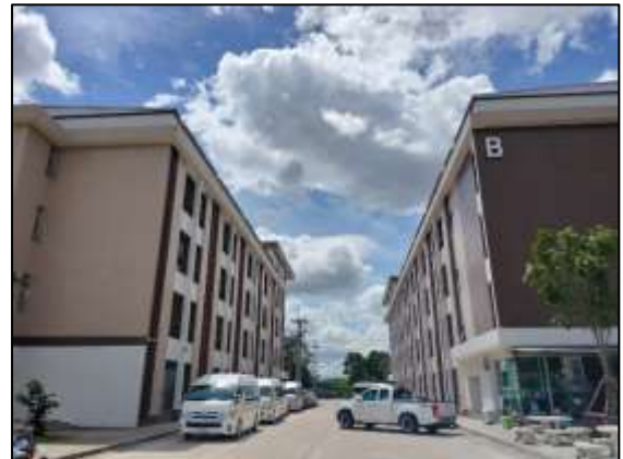
ภาพที่ 12 พื้นที่จอดรถของโครงการ