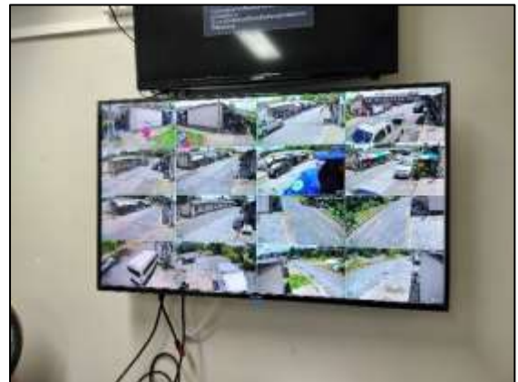
ภาพที่ 27 กล้อง CCTV / ห้องควบคุม CCTV