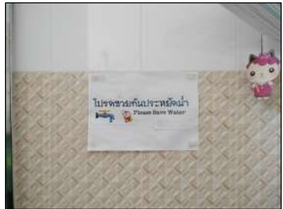
ภาพที่ 14 ป้ายประหยัดน้ำ