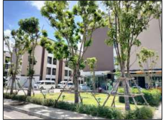
ภาพที่ 1 พื้นที่สีเขียว