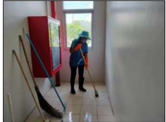
ภาพที่ 26 ทำความสะอาดพื้นที่โครงการ