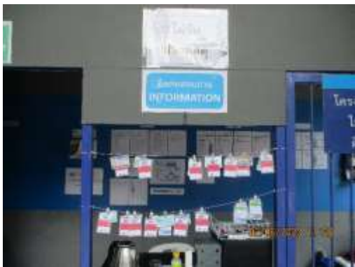
รูปที่ 59 บัตรสำหรับผู้ที่มาติดต่อ