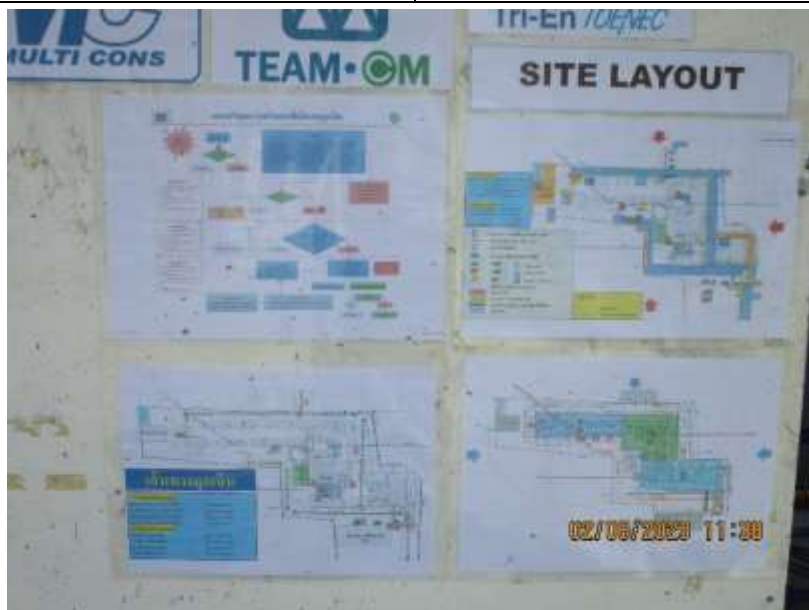
รูปที่ 38 แผนเตรียมความพร้อมกรณีเกิดเหตุฉุกเฉิน และเส้นทางฉุกเฉิน