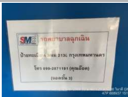
รูปที่ 43 รถพยาบาลฉุกเฉิน