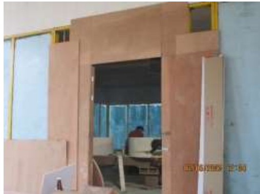
รูปที่ 23 ห้องเก็บเสียง และฝุ่นในการตัดเจียรกระเบื้อง