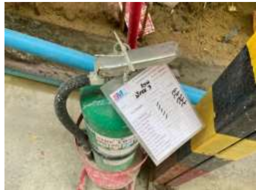
รูปที่ 37 ตรวจสอบสภาพการใช้งาน