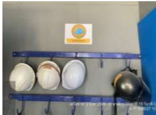
รูปที่ 70 อุปกรณ์ป้องกันอันตรายส่วนบุคคล