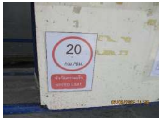
รูปที่ 30 ป้ายจำกัดความเร็ว