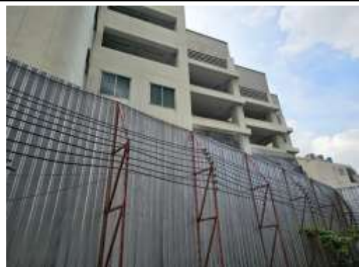
รูปที่ 19 สเปรย์ฉีดน้ำอัตโนมัติ