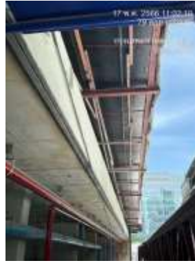
รูปที่ 56 ตะแกรงป้องกันวัสดุตกหล่นโดยรอบอาคาร