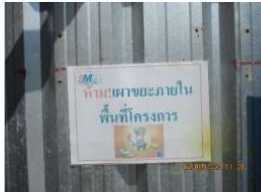
รูปที่ 28 ป้าย “ห้ามเผาขยะภายในพื้นที่โครงการ”