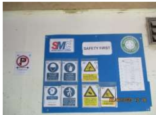
รูปที่ 72 ป้ายความปลอดภัย