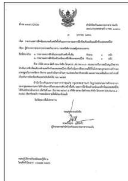
รูปที่ 42 รายงานผลการฝึกซ้อมบรณดับเพลิงขั้นต้น และผลการฝึกซ้อมดับเพลิงและฝึกซ้อมอพยพหนีไฟ