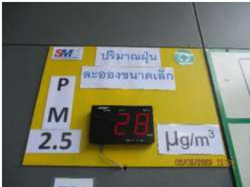
รูปที่ 27 ผลการตรวจวัดคุณภาพปริมาณฝุ่นละออง ขนาดไม่เกิน 2.5 ไมครอน ( PM_{2.5} )