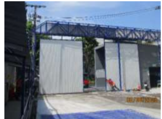
รูปที่ 9 ประตูทางเข้า-ออกโครงการ