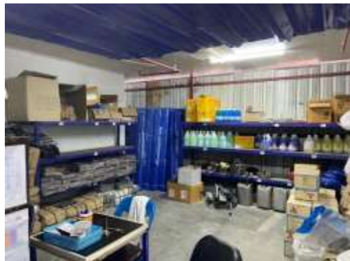
รูปที่ 24 ห้องสไตร์