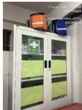
รูปที่ 34 อุปกรณ์ปฐมพยาบาล