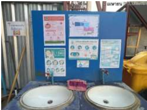
รูปที่ 49 ป้าย “รณรงค์ประหยัดน้ำ”