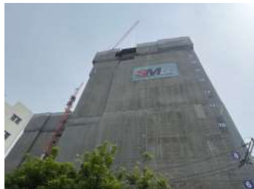
รูปที่ 17 การกวาดล้างของเครน