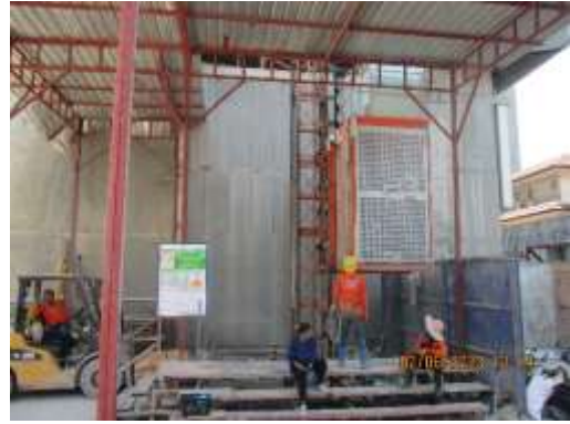
รูปที่ 26 ลิฟต์ขนส่งวัสดุก่อสร้าง