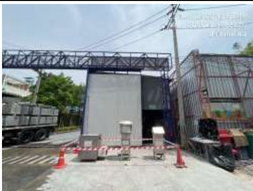
รูปที่ 31 ติดตั้งเครื่องตรวจวัดคุณภาพอากาศ