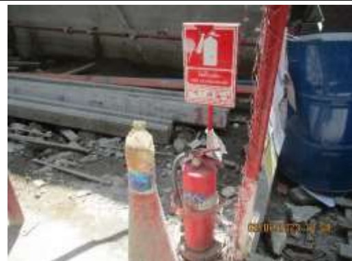
รูปที่ 35 ถังดับเพลิง