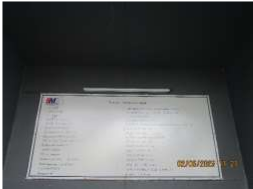
รูปที่ 1 ป้ายรายละเอียดโครงการ