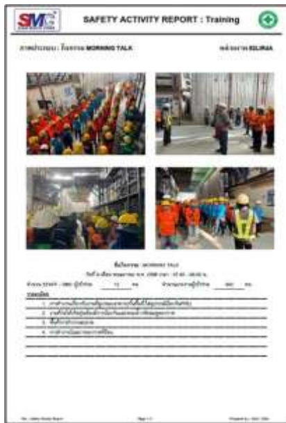
รูปที่ 39 กิจกรรม Safety Talk