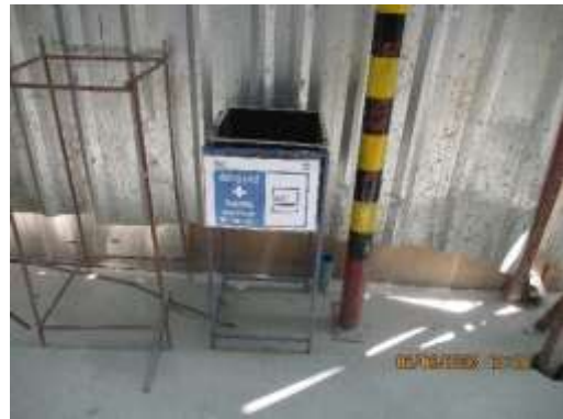
รูปที่ 58 พื้นที่สุขาบุหรื