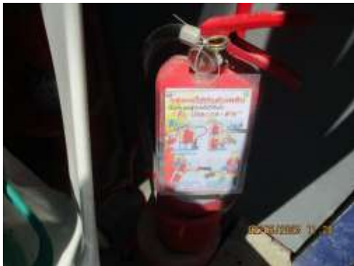
รูปที่ 36 ป้ายแนะนำการใช้อุปกรณ์ดับเพลิง