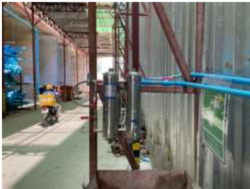
รูปที่ 57 น้ำดื่ม