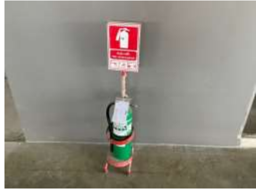
รูปที่ 35 ถังดับเพลิง (ต่อ)