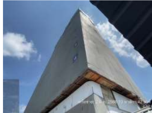
รูปที่ 22 ติดตั้งผ้าใบการก่อสร้าง (Mesh Sheet ชนิดกันไฟลุกลาม) คลุมอาคาร