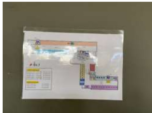
รูปที่ 60 แผนผังเส้นทางหนีไฟ