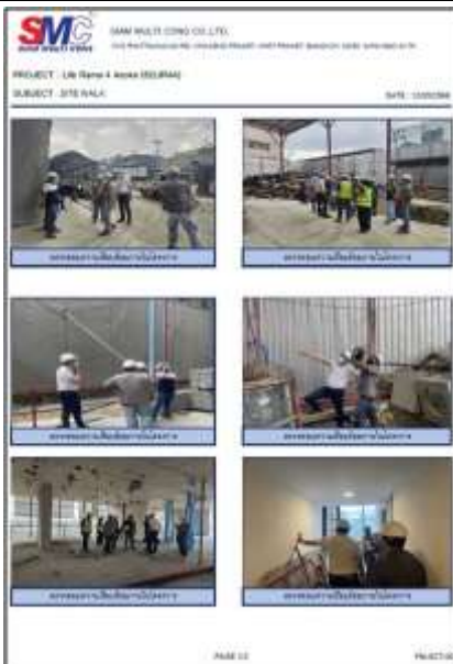
รูปที่ 41 เจ้าหน้าที่ตรวจสอบความเรียบร้อยภายในโครงการ