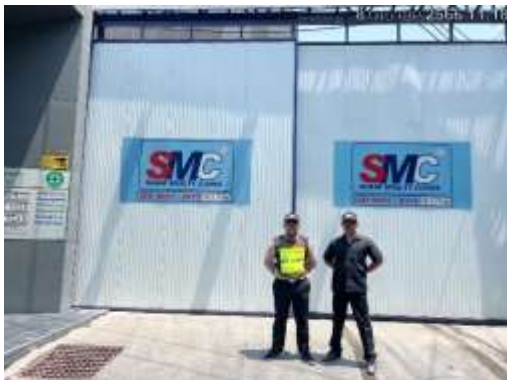
รูปที่ 10 เจ้าหน้าที่รักษาความปลอดภัย (รปภ.)