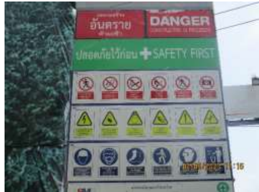
รูปที่ 2 ป้าย “เขตก่อสร้างอันตรายห้ามเข้า”