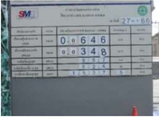
รูปที่ 6 ป้ายแสดงผลการตรวจวัดคุณภาพสิ่งแวดล้อม