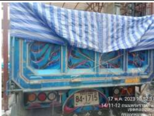
รูปที่ 18 ผ้าใบปิดคลุมท้ายรถบรรทุก