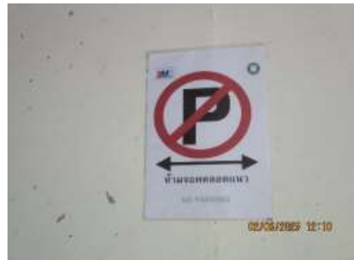
รูปที่ 11 ป้าย "ห้ามจอดตลอดแนว"