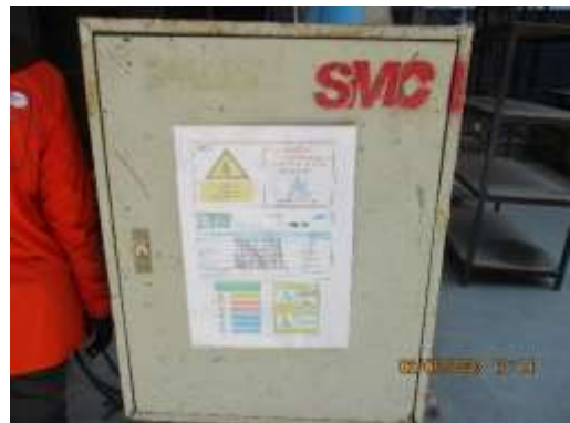
รูปที่ 51 ตู้ไฟ