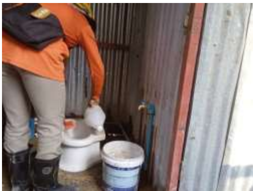
รูปที่ 29 เจ้าหน้าที่ล้างทำความสะอาดห้องน้ำ