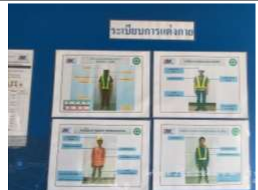
รูปที่ 55 ระเบียบการแต่งกาย