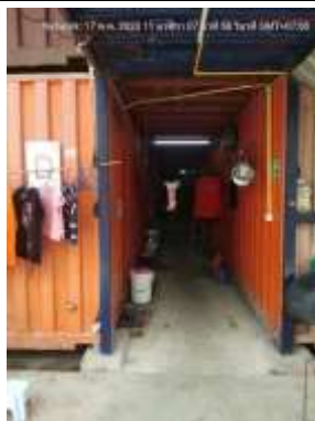
รูปที่ 73 บ้านพักคนงาน