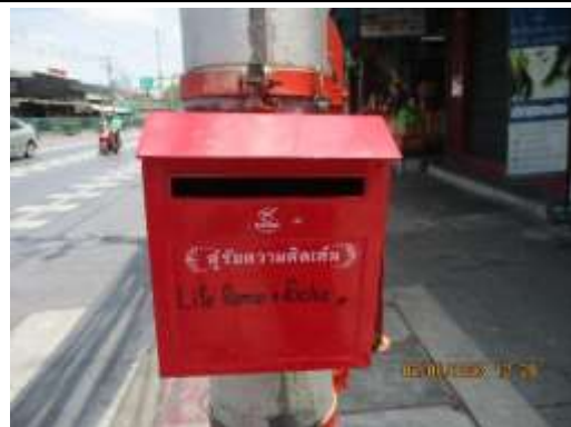
รูปที่ 4 กล่องรับความคิดเห็น