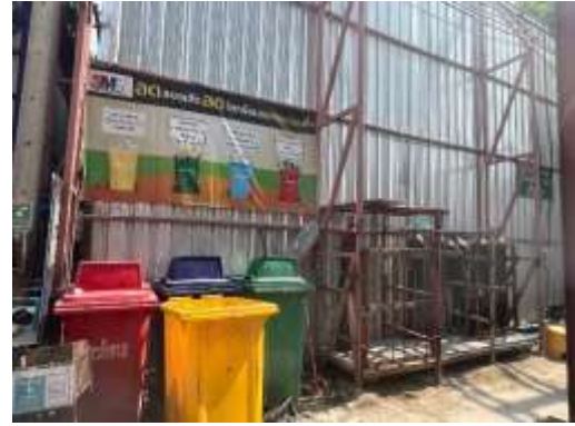
รูปที่ 52 ถังรองรับมูลฝอย และป้ายรณรงค์คัดแยกขยะ