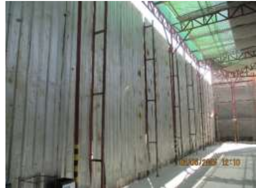
รูปที่ 8 รั้ว Metal Sheet สูง 6 เมตร ล้อมรอบบริเวณพื้นที่โครงการ