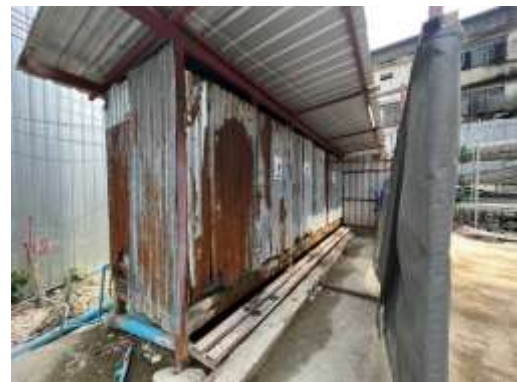
รูปที่ 54 ห้องน้ำ