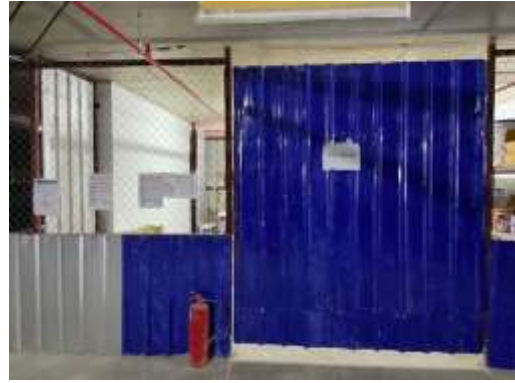
รูปที่ 69 ห้องเก็บสารเคมี