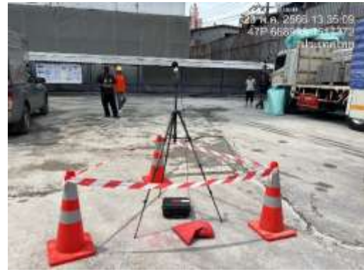
รูปที่ 32 ติดตั้งเครื่องตรวจวัดระดับเสียง และความสั่นสะเทือน