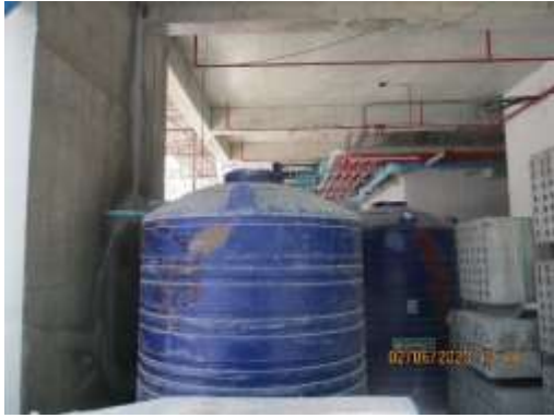
รูปที่ 47 ถังสำรองน้ำ