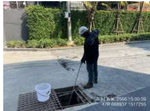
รูปที่ 33 เจ้าหน้าที่เก็บตัวอย่างคุณภาพน้ำทิ้ง