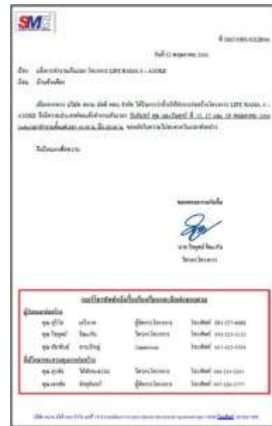
รูปที่ 40 แจ้งการทำงานเกินเวลา