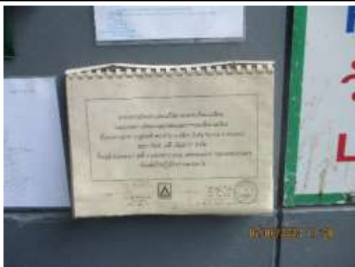
รูปที่ 5 รายงานมาตรการป้องกันและแก้ไขผลกระทบสิ่งแวดล้อมและมาตรการติดตามตรวจสอบผลกระทบสิ่งแวดล้อม