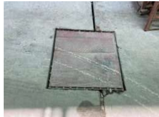
รูปที่ 53 รางระบายน้ำและปัดกักตะกอน