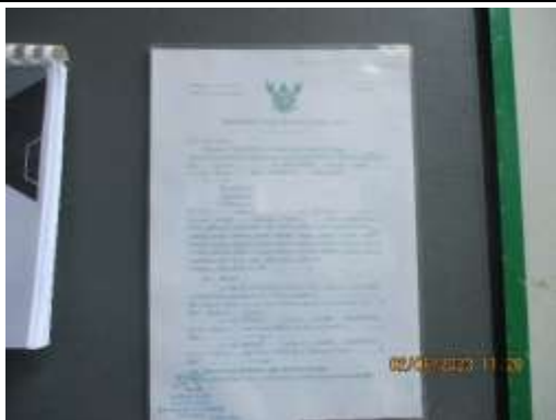
รูปที่ 3 ใบอนุญาตก่อสร้าง