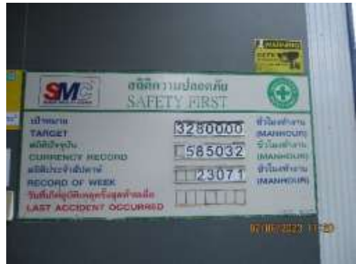
รูปที่ 50 ป้ายสถิติความปลอดภัย