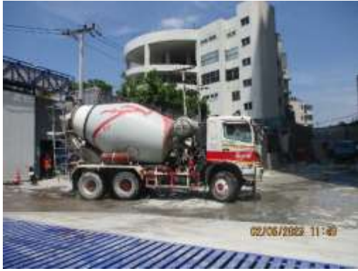
รูปที่ 25 รถผสมปูนสำเร็จรูป