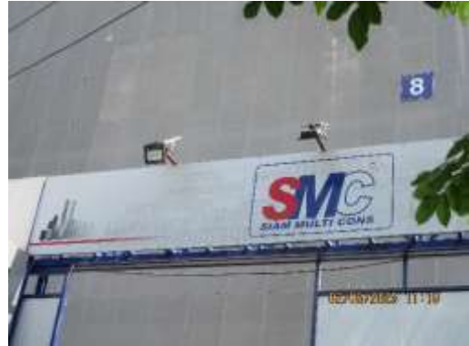
รูปที่ 16 ไฟฟ้าส่องสว่าง