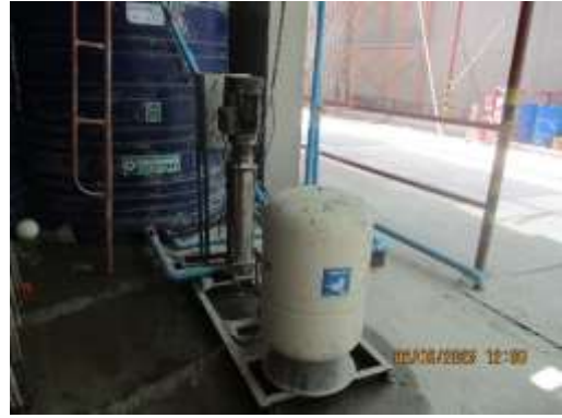
รูปที่ 48 เครื่องสูบน้ำ