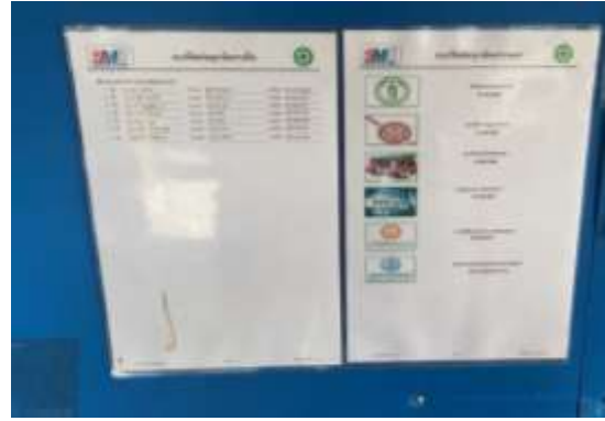
รูปที่ 7 เบอร์ติดต่อดูเงิน