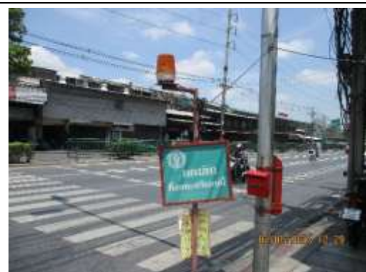
รูปที่ 44 ไฟกระพริบ