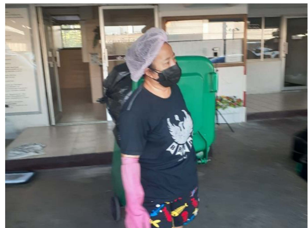
ภาพที่ 3-3 เจ้าหน้าที่ตรวจสอบถังขยะและห้องพักขยะ