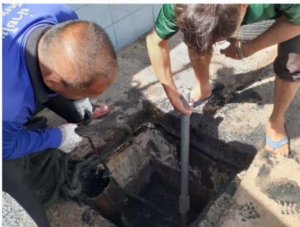
ภาพที่ 3-6 เจ้าหน้าที่ตรวจสอบระบบท่อระบายน้ำรอบ ๆ โครงการ