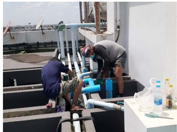
ภาพที่ 3-2 เจ้าหน้าที่ตรวจสอบการทำงานของระบบท่อน้ำ และระบบจ่ายน้ำประปา