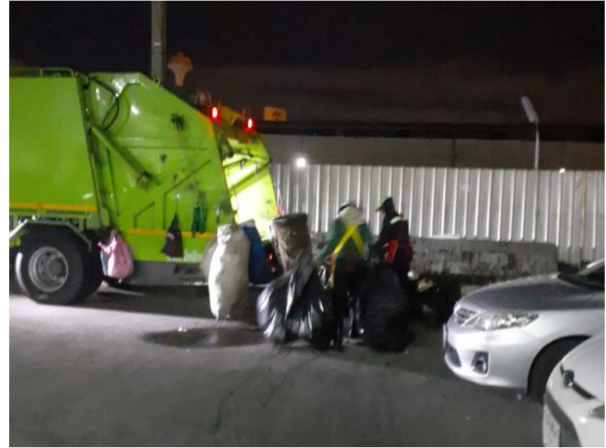
ภาพที่ 3-4 พนักงานคอยเก็บขยะ