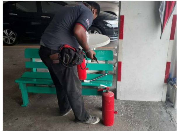
ภาพที่ 3-5 เจ้าหน้าที่ตรวจสอบระบบเตือนภัย และป้องกันอัคคีภัย