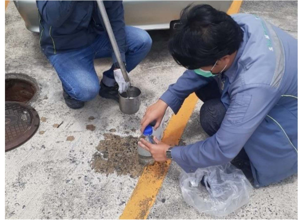
ภาพที่ 3-1 เจ้าหน้าที่ตรวจสอบคุณภาพน้ำทิ้ง