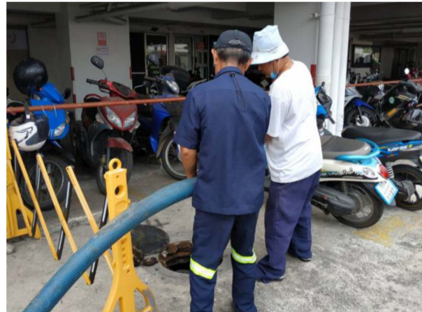
ภาพที่ 3-7 การสูบน้ำส่วนเกินเพื่อนำไปกำจัด