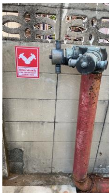
ภาพที่ 17 หัวรับน้ำดับเพลิง