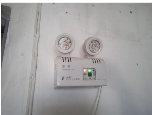
ภาพที่ 11 ไฟส่องสว่างฉุกเฉิน