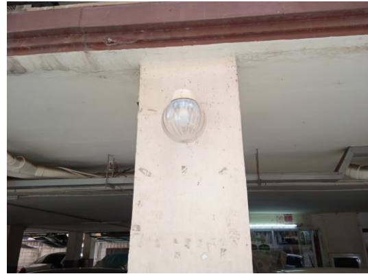
ภาพที่ 20 ไฟส่องสว่างทางเดิน