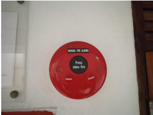
ภาพที่ 13 ปุ่มแจ้งเหตุฉุกเฉิน

รายงานผลการปฏิบัติตามมาตรการป้องกันและแก้ไขผลกระทบสิ่งแวดล้อม และมาตรการติดตามตรวจสอบคุณภาพสิ่งแวดล้อม (ระยะดำเนินการ) โครงการ ลาเมซอง 25 (อาคาร A) ประจำเดือน มกราคม-มิถุนายน พ.ศ. 2566