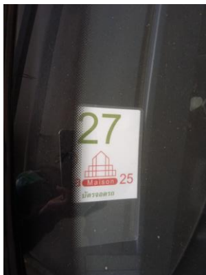
ภาพที่ 9 บัตร/สติ๊กเกอร์จอดรถ