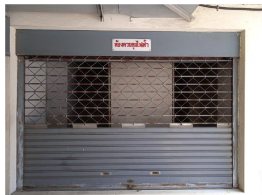
ภาพที่ 6 ห้องควบคุมระบบไฟฟ้า