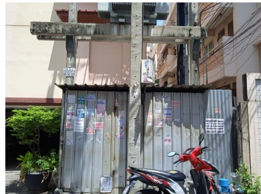
ภาพที่ 4 ห้องพักขยะ