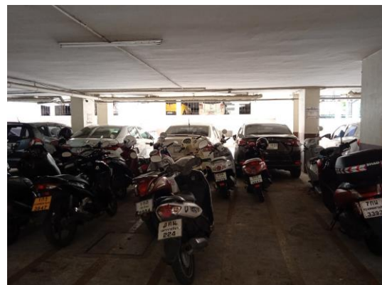
ภาพที่ 10 ที่จอดรถจักรยานยนต์