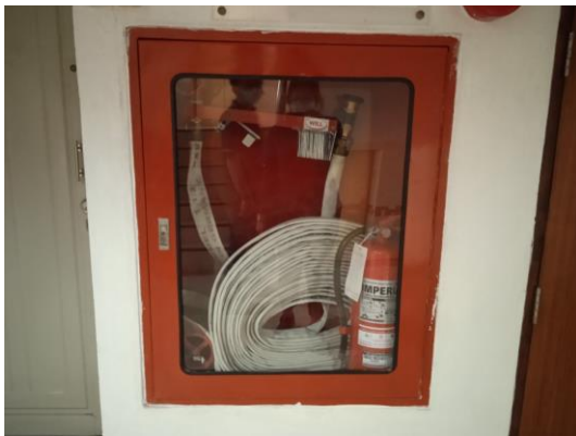
ภาพที่ 15 สายฉีดน้ำดับเพลิง