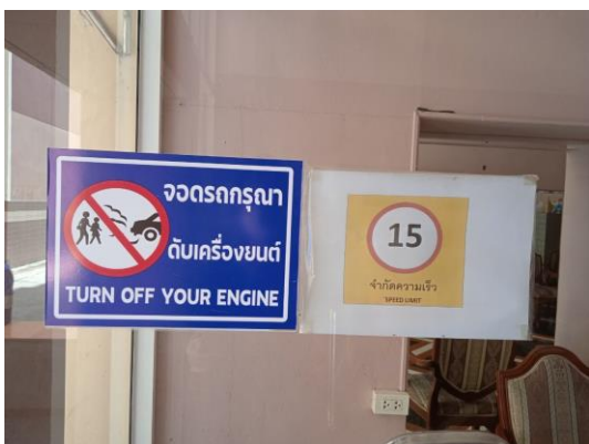
ภาพที่ 23 ป้ายจำกัดความเร็วของรถ