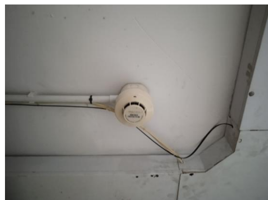
ภาพที่ 12 เครื่องตรวจจับควัน