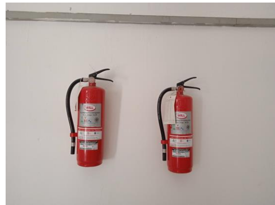
ภาพที่ 16 ถังเคมีดับเพลิง