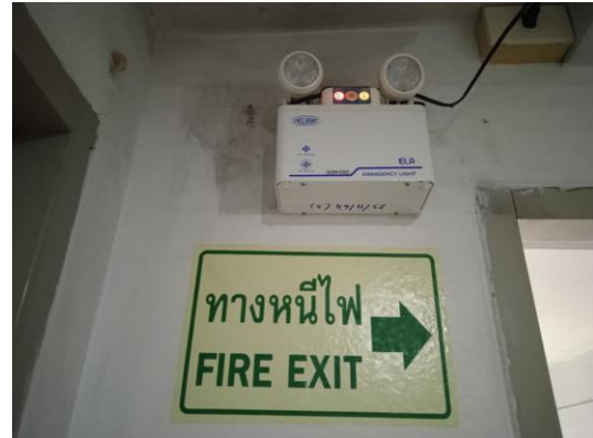
ภาพที่ 14 ป้ายบอกเส้นทางหนีไฟ