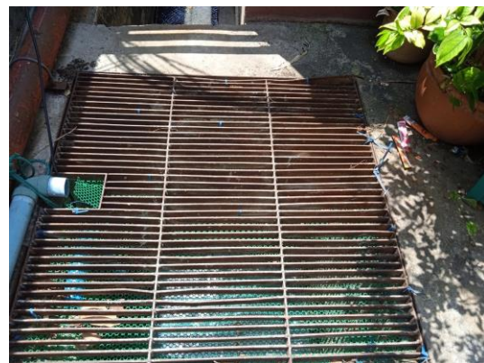
ภาพที่ 22 ตะแกรงดักขยะ