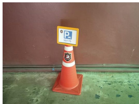
ภาพที่ 24 กรวยจราจร