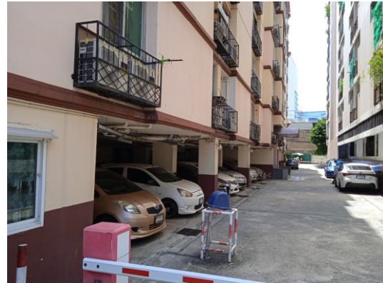
ภาพที่ 8 ที่จอดรถยนต์