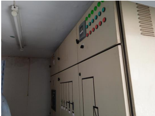
ภาพที่ 7 ตู้ควบคุมระบบไฟฟ้า

รายงานผลการปฏิบัติตามมาตรการป้องกันและแก้ไขผลกระทบสิ่งแวดล้อม และมาตรการติดตามตรวจสอบคุณภาพสิ่งแวดล้อม (ระยะดำเนินการ) โครงการ ลาเมซอง 25 (อาคาร A) ประจำเดือน มกราคม-มิถุนายน พ.ศ. 2566