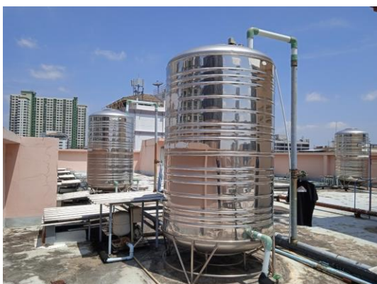
ภาพที่ 5 ถังพักน้ำชั้นดาดฟ้า