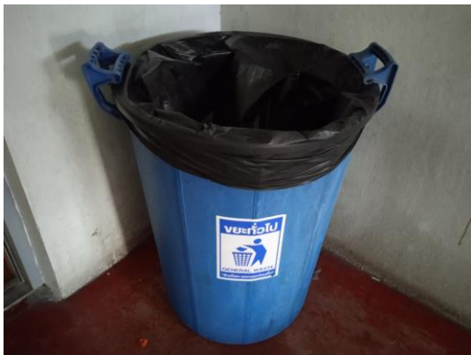
ภาพที่ 3 ถังขยะ