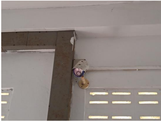
ภาพที่ 19 กล้องวงจรปิด

รายงานผลการปฏิบัติตามมาตรการป้องกันและแก้ไขผลกระทบสิ่งแวดล้อม และมาตรการติดตามตรวจสอบคุณภาพสิ่งแวดล้อม (ระยะดำเนินการ) โครงการ ลามะซอง 25 (อาคาร A) ประจำเดือน มกราคม-มิถุนายน พ.ศ. 2566