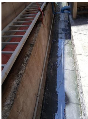
ภาพที่ 21 รางระบายน้ำ