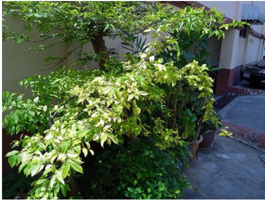
ภาพที่ 1 พื้นที่สีเขียวหน้าโครงการ

รายงานผลการปฏิบัติตามมาตรการป้องกันและแก้ไขผลกระทบสิ่งแวดล้อม และมาตรการติดตามตรวจสอบคุณภาพสิ่งแวดล้อม (ระยะดำเนินการ) โครงการ ลามะซอง 25 (อาคาร A) ประจำเดือน มกราคม-มิถุนายน พ.ศ. 2566