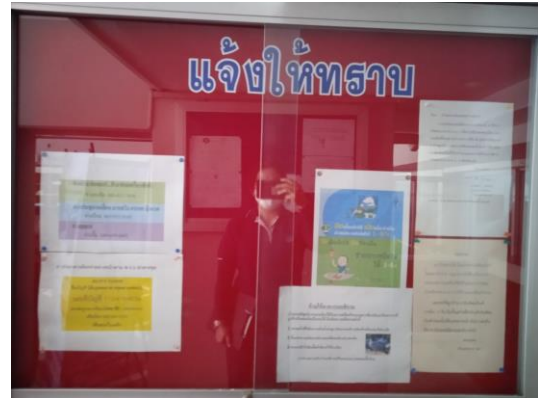
ภาพที่ 2 บอร์ดประชาสัมพันธ์