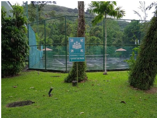
ภาพที่ 13 จุดรวมพล

รายงานผลการปฏิบัติตามมาตรการป้องกันและแก้ไขผลกระทบสิ่งแวดล้อม และมาตรการติดตามตรวจสอบคุณภาพสิ่งแวดล้อม (ระยะดำเนินการ) โรงแรม เลอ เมริเดียน ภูเก็ต บีช รีสอร์ท ประจำเดือน มกราคม-มิถุนายน พ.ศ. 2566