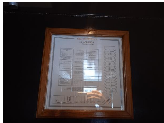
ภาพที่ 10 แผนผังเส้นทางหนีไฟ