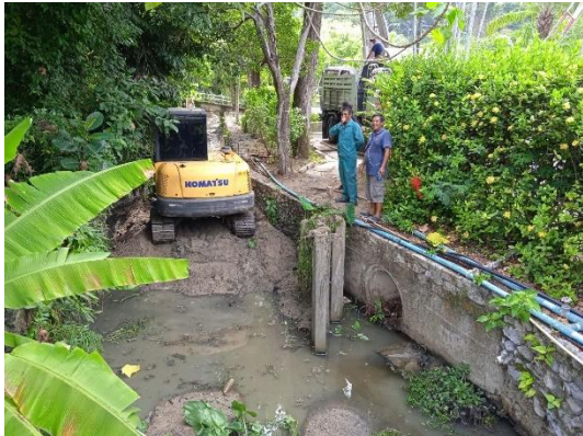
ภาพที่ 1 รางระบายน้ำฝน

รายงานผลการปฏิบัติตามมาตรการป้องกันและแก้ไขผลกระทบสิ่งแวดล้อม และมาตรการติดตามตรวจสอบคุณภาพสิ่งแวดล้อม (ระยะดำเนินการ) โรงแรม เลอ เมริเดียน ภูเก็ต บีช รีสอร์ท ประจำเดือน มกราคม-มิถุนายน พ.ศ. 2566