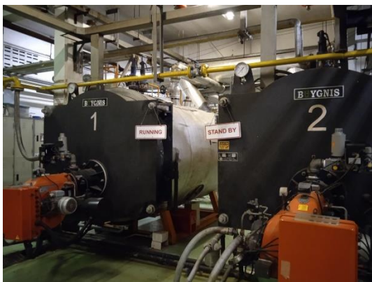
ภาพที่ 21 เครื่องผลิตไอน้ำ (Boiler)