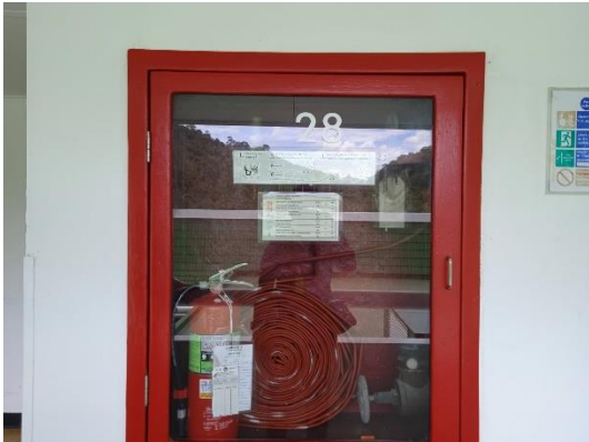
ภาพที่ 7 อุปกรณ์ป้องกันอัคคีภัย

รายงานผลการปฏิบัติตามมาตรการป้องกันและแก้ไขผลกระทบสิ่งแวดล้อม และมาตรการติดตามตรวจสอบคุณภาพสิ่งแวดล้อม (ระยะดำเนินการ) โรงแรม เลอ เมริเดียน ภูเก็ต บีช รีสอร์ท ประจำเดือน มกราคม-มิถุนายน พ.ศ. 2566