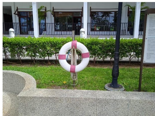
ภาพที่ 28 ห่วงยางชูชีพ