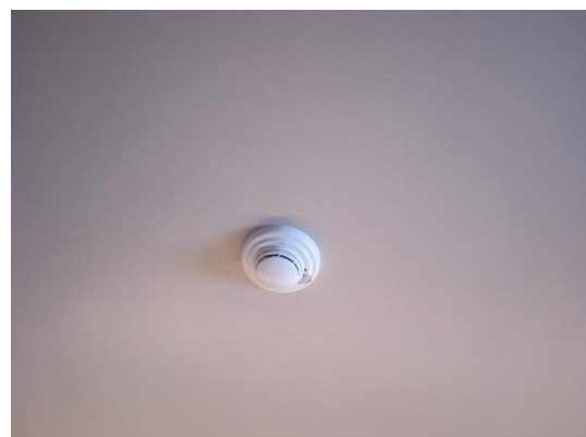
ภาพที่ 6 เครื่องตรวจจับควัน