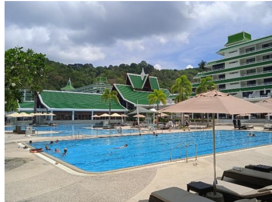
ภาพที่ 26 สระว่ายน้ำ