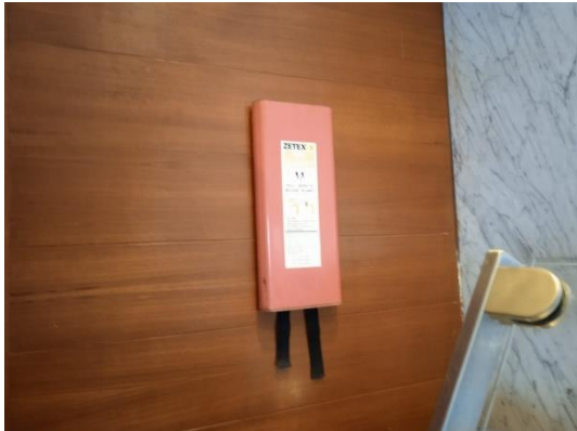
ภาพที่ 25 ผ้าห่มกันไฟ

รายงานผลการปฏิบัติตามมาตรการป้องกันและแก้ไขผลกระทบสิ่งแวดล้อม และมาตรการติดตามตรวจสอบคุณภาพสิ่งแวดล้อม (ระยะดำเนินการ) โรงแรม เลอ เมริเดียน ภูเก็ต บีช รีสอร์ท ประจำเดือน มกราคม-มิถุนายน พ.ศ. 2566