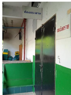
ภาพที่ 22 ห้องพักขยะอันตรายและรีไซเคิล