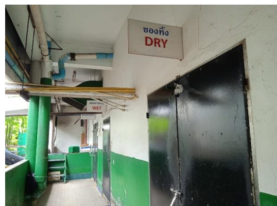
ภาพที่ 24 ห้องพักขยะแห้ง