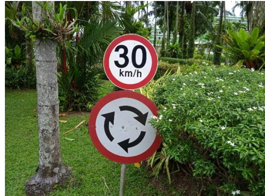
ภาพที่ 20 ป้ายจำกัดความเร็ว