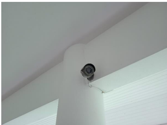
ภาพที่ 31 กล้องวงจรปิด

รายงานผลการปฏิบัติตามมาตรการป้องกันและแก้ไขผลกระทบสิ่งแวดล้อม และมาตรการติดตามตรวจสอบคุณภาพสิ่งแวดล้อม (ระยะดำเนินการ) โรงแรม เลอ เมริเดียน ภูเก็ต บีช รีสอร์ท ประจำเดือน มกราคม-มิถุนายน พ.ศ. 2566