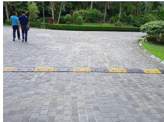
ภาพที่ 14 สันชะลอความเร็ว