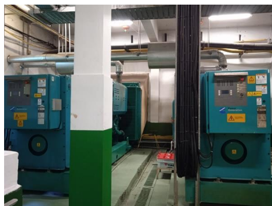
ภาพที่ 36 เครื่องกำเนิดไฟฟ้าสำรอง