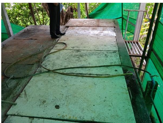
ภาพที่ 17 บ่อดักไขมัน