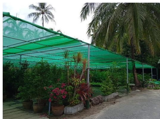
ภาพที่ 30 เรือนเพาะชำ