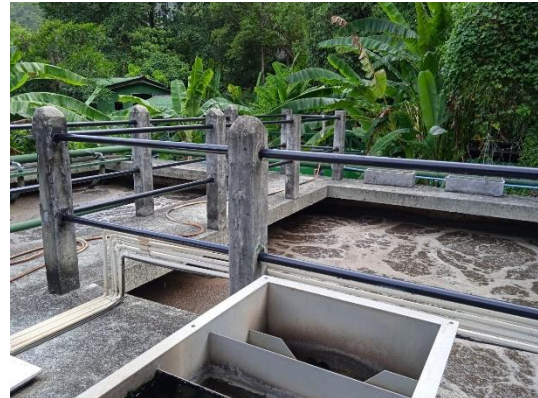
ภาพที่ 2 ระบบบำบัดน้ำเสีย