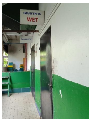
ภาพที่ 23 ห้องพักขยะเปียก