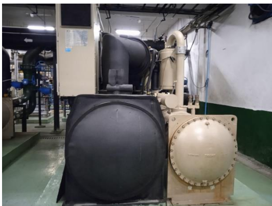
ภาพที่ 3 Chiller