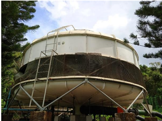
ภาพที่ 19 หอผึ่งเย็น (Cooling)

รายงานผลการปฏิบัติตามมาตรการป้องกันและแก้ไขผลกระทบสิ่งแวดล้อม และมาตรการติดตามตรวจสอบคุณภาพสิ่งแวดล้อม (ระยะดำเนินการ) โรงแรม เลอ เมริเดียน ภูเก็ต บีช รีสอร์ท ประจำปีเดือน มกราคม-มิถุนายน พ.ศ. 2566