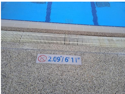
ภาพที่ 27 ป้ายบอกความลึกสระว่ายน้ำ