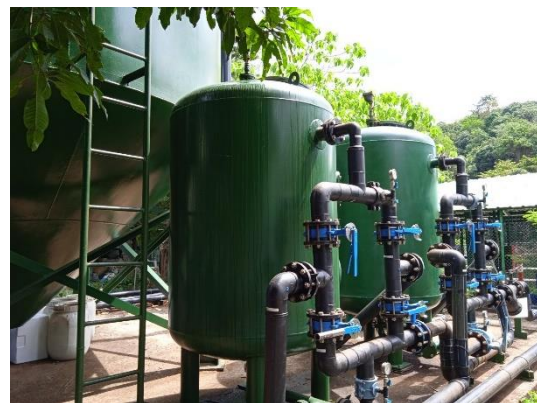
ภาพที่ 16 ระบบปรับปรุงคุณภาพน้ำ