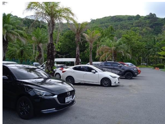
ภาพที่ 32 ลานจอดรถยนต์