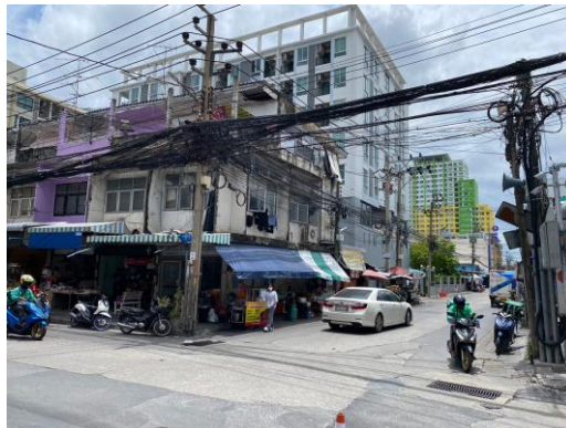
ทิศใต้ ติดกับ อาคารพาณิชย์ ขนาดความสูง 3 ชั้น