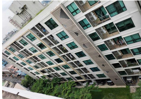
ทิศตะวันตก ติดกับ คอนโด สุภาลัย คิวท์ รัชโยธิน-พหลโยธิน 34