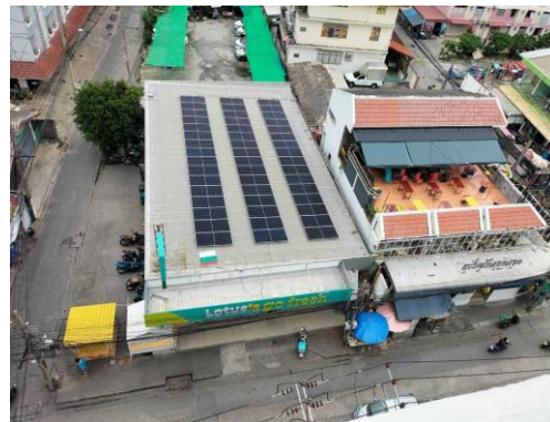
ทิศตะวันออก ติดกับ อาคารพาณิชย์ ขนาดความสูง 3 ชั้น จำนวน 4 คูหา และ LOTUS'S GO FRESH