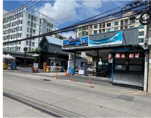
ทิศเหนือ ติดกับ โครงการ Block space พหลโยธิน 34