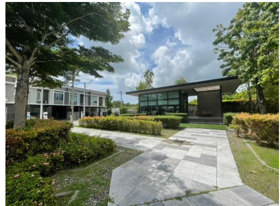
รูปที่ 1-1 สภาพภายในพื้นที่โครงการ