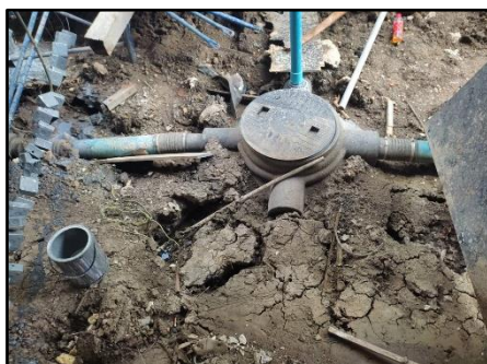
รูปที่ 1-5 ระบบบำบัดน้ำเสีย

น้ำเสียที่เกิดขึ้นจากกิจกรรมในระยะก่อสร้าง ส่วนใหญ่มาจากน้ำเสียจากห้องน้ำ ห้องส้วมและน้ำเสียจากการชำระล้างทำความสะอาดสิ่งต่างๆ ภายในโครงการ และน้ำเสียที่เกิดขึ้น จะได้รับการบำบัดด้วยระบบบำบัดน้ำเสียสำเร็จรูปชั่วคราวจนได้มาตรฐานคุณภาพน้ำทิ้ง ก่อนระบายออกนอกพื้นที่ก่อสร้าง ดังแสดงในรูปที่ 1-5