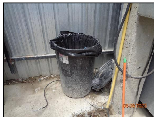
รูปที่ 1-7 ถังมูลฝอย วางโดยรอบบริเวณพื้นที่ก่อสร้าง