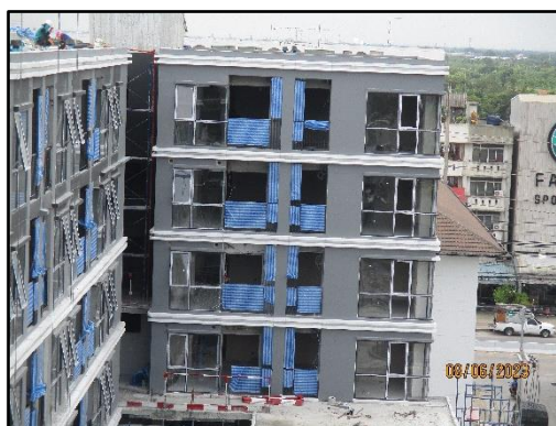
รูปที่ 1-8 สภาพปัจจุบันของโครงการ