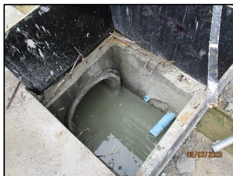
รูปที่ 1-6 รางระบายน้ำชั่วคราว