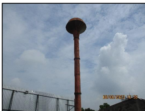
รูปที่ 1-4 แทงค้ำน้ำบาดาล

โครงการใช้น้ำจากบ่อน้ำบาดาลของทางโครงการดังแสดงในรูปที่ 1-4 ซึ่งสามารถจำแนกออกเป็น 2 ประเภท คือ น้ำใช้สำหรับงานก่อสร้าง และน้ำใช้สำหรับคนงาน ดังนั้น กิจกรรมการ ใช้น้ำในระยะก่อสร้าง ส่วนใหญ่จะมาจากการใช้น้ำของคนงานก่อสร้าง เพื่อการชำระล้าง ห้องน้ำห้องส้วม และการทำความสะอาด พื้นที่หลังเลิกงาน