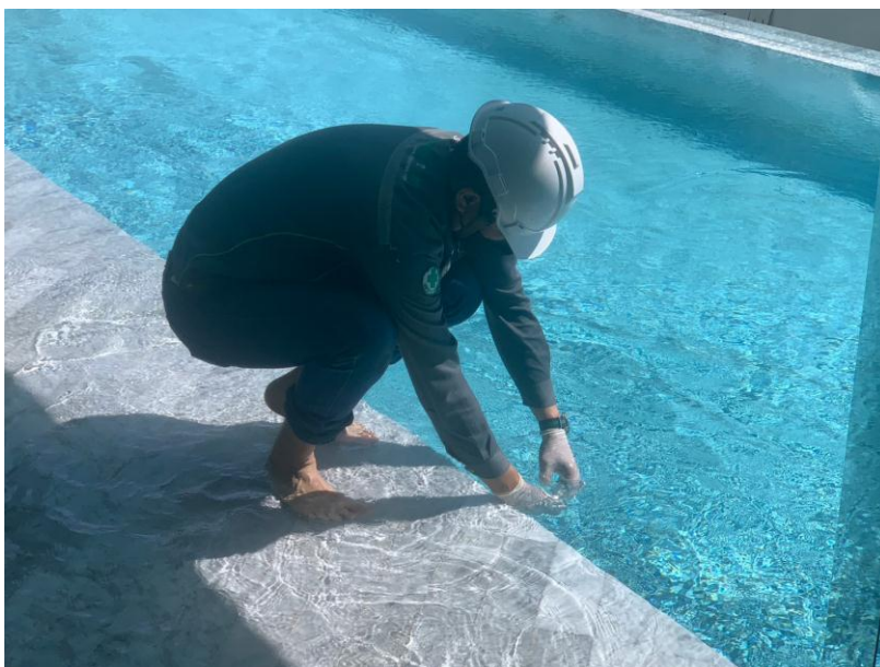
สระว่ายน้ำบริเวณส่วนลึก