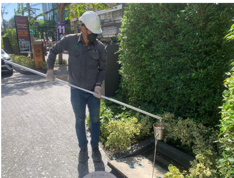
บ่อพักน้ำสุดท้ายของระบบระบายน้ำของโครงการก่อนระบายลงสู่ระบบระบายน้ำด้านหน้าโครงการ 1 จุด

รูปที่ 3-1 จุดตรวจวัดคุณภาพน้ำโครงการ CHAPTER CHULA-SAMYAN (แซปเตอร์ จุฬา-สามย่าน) บริษัท พฤษภา เรียวเอสเตท จำกัด (มหาชน) ระหว่างเดือนมกราคม – มิถุนายน พ.ศ.2566