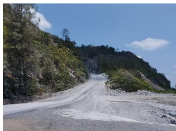
เส้นทางเข้าสู่พื้นที่ประทานบัตร