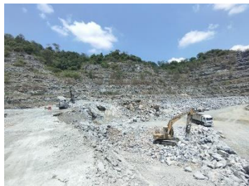
พื้นที่ทำเหมืองปัจจุบัน