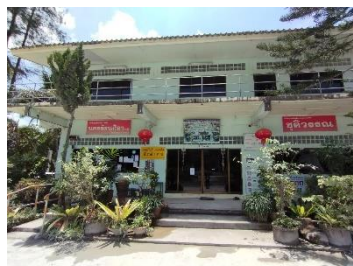
สำนักงานโครงการ