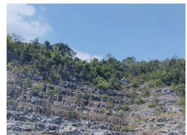
พื้นที่ขุดไม่ด้านทิศใต้ ระยะ 150 เมตร