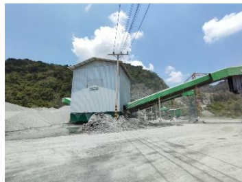
โรงโม่หินของโครงการ