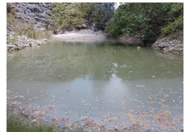
บ่อดักตะกอนของโครงการ