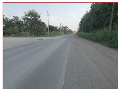
ถนนลาดยางส่วนบุคคลของหมู่บ้าน

ที่มา : แผนที่ภูมิประเทศมาตราส่วน 1: 50,000 ของกรมแผนที่ทหาร ลำดับชุด L7018 ราว 4935 IV