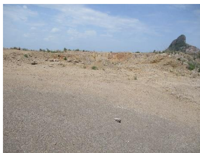
พื้นที่หน้าเหมืองปัจจุบัน