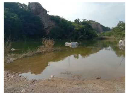
บ่อรับน้ำของโครงการ