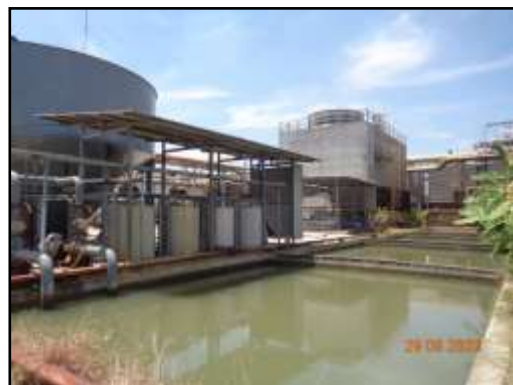
รูปที่ 2-30 บ่อพักน้ำดิบภายในพื้นที่โครงการ