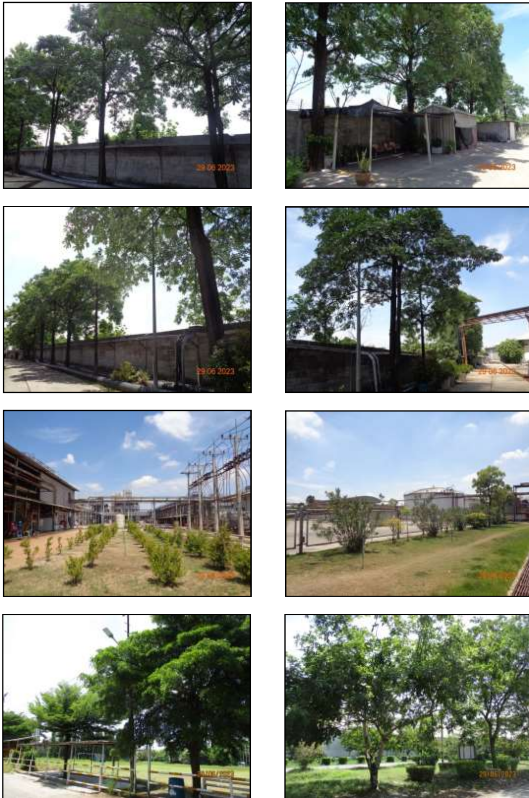
รูปที่ 2-38 พื้นที่สีเขียวโดยรอบโครงการ