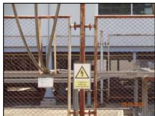
รูปที่ 2-33 ป้ายเตือนต่างๆ ภายในพื้นที่โครงการ