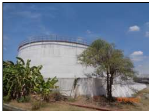
รูปที่ 2-41 คันคอนกรีตล้อมรอบถังเก็บเอทานอล