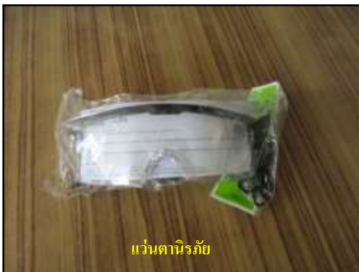
แว่นตานิรภัย