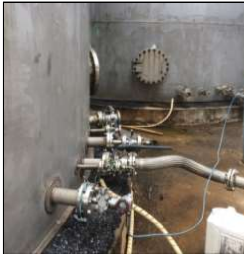
รูปที่ 2-44 การติดตั้ง High level transmitter และ level meter บริเวณถังเก็บเอทานอล