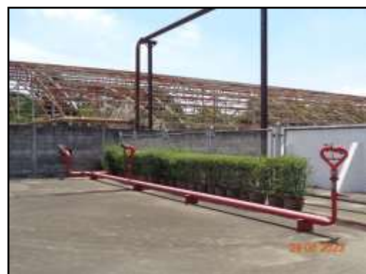
รูปที่ 2-42 ท่อน้ำดับเพลิงโดยรอบพื้นที่ส่วนผลิตและถังเก็บเอทานอล