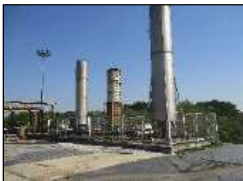
รูปที่ 2-50 ระบบผลิตก๊าซชีวภาพของโครงการ