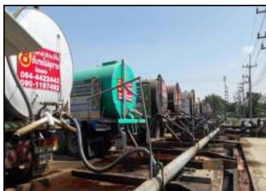
รูปที่ 2-19 รถบรรทุกขนส่งน้ำกากส่า