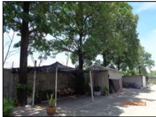
รูปที่ 2-40 เรือนเพาะชำและแปลงอนุบาลกล้าไม้ เพื่อเพาะพันธุ์กล้าไม้ สำหรับปลูกทดแทนในบริเวณพื้นที่สีเขียว