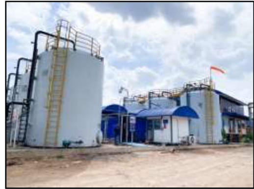
รูปที่ 2-6 ระบบ Bio scrubber ของโครงการ