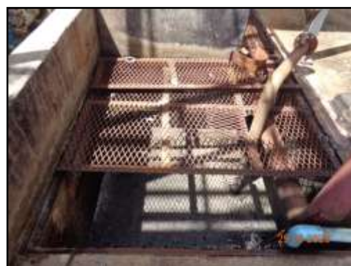
รูปที่ 2-24 รางระบายน้ำเสียภายในพื้นที่โครงการ