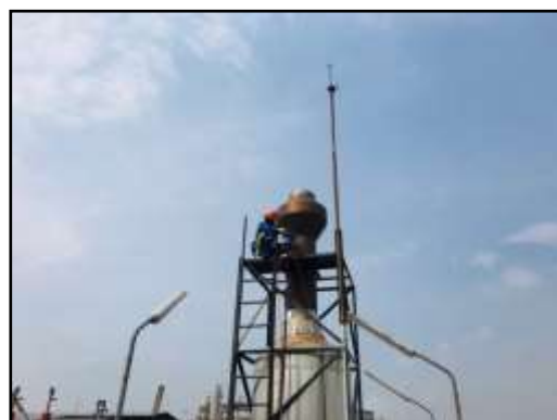
รูปที่ 2-2 ปล่องเครื่องกำเนิดไฟฟ้า (Gas Engine Generator)