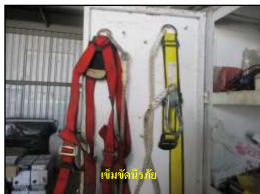
เข็มขัดนิรภัย