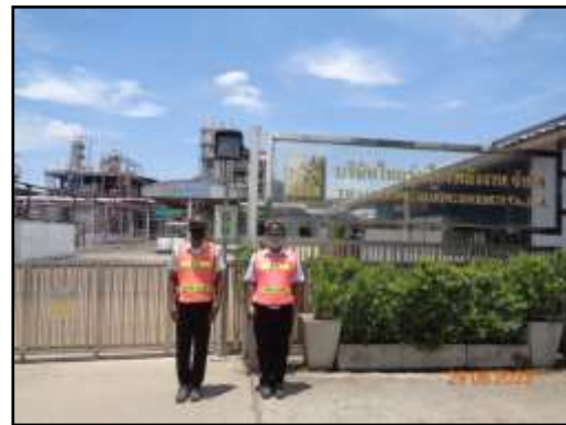
รูปที่ 2-31 เจ้าหน้าที่รักษาความปลอดภัย ภายในพื้นที่โครงการ