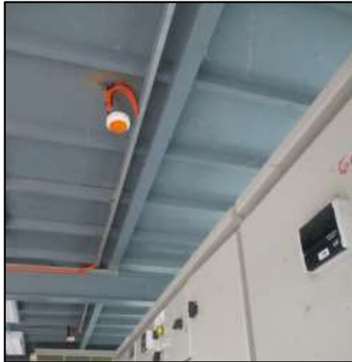
รูปที่ 2-43 อุปกรณ์ตรวจจับการรั่วไหลของเอทานอล และตรวจจับเปลวไฟ