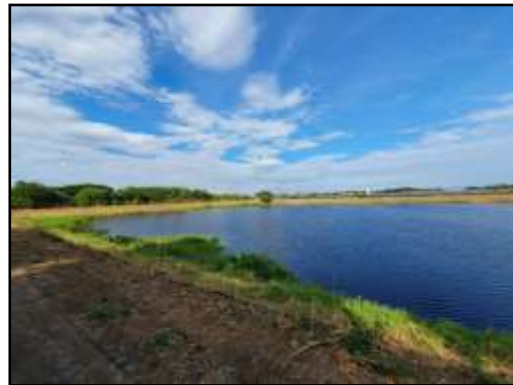
รูปที่ 2-28 ป่อหนองน้ำ ของโครงการ