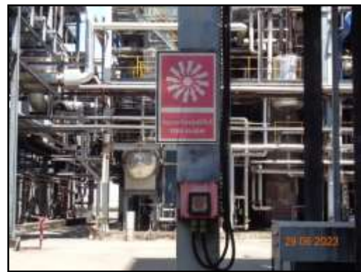
รูปที่ 2-55 ระบบป้องกันและระงับอัคคีภัยภายในพื้นที่โครงการ