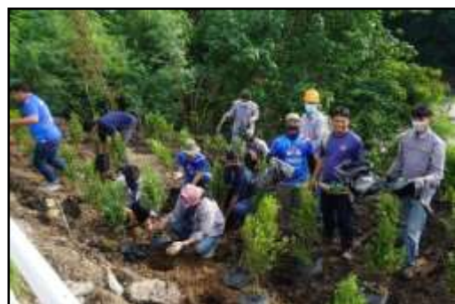
รูปที่ 2-39 การปลูกต้นไม้ยืนต้น โดยรอบโครงการและบริเวณด้านประชิดแม่น้ำป่าสัก