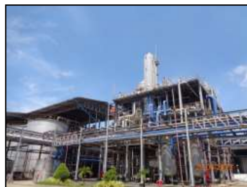
รูปที่ 2-15 ถังหมัก หอกลิ้น และหอกำจัดน้ำที่เป็นระบบปิด