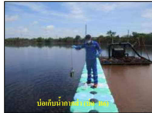
รูปที่ 2-11 บ่อเก็บน้ำกากส่าของโครงการ