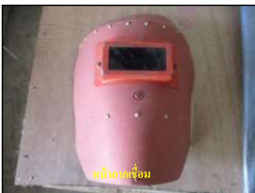
หน้ากากเชื่อม