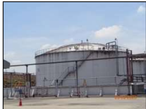
รูปที่ 2-17 ถังเก็บเอทานอล