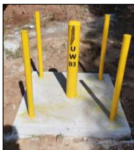
รูปที่ 2-27 บ่อสังเกตการณ์ (Monitoring Well) บริเวณพื้นที่โครงการ