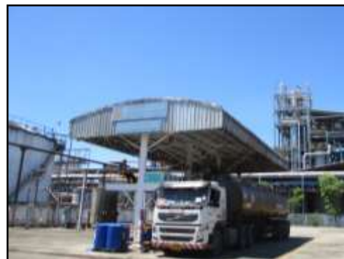
รูปที่ 2-18 รถบรรทุกขนส่งเอทานอล