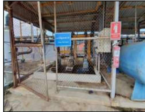
รูปที่ 2-13 อาคารปั๊มสูบน้ำ