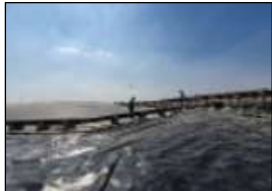
รูปที่ 2-7 การตรวจวัดปริมาณก๊าซไฮโดรเจนซัลไฟด์ ในบริเวณพื้นที่ที่มีความเสี่ยง