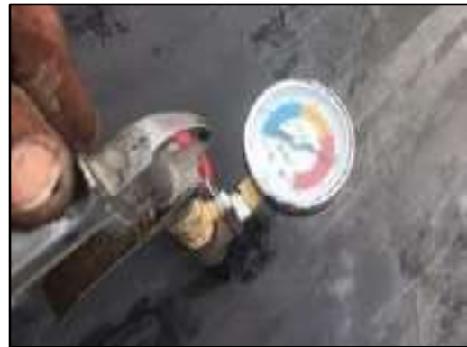
รูปที่ 2-26 การตรวจสอบสภาพของพลาสติก HDPE คลุมบ่ออย่างสม่ำเสมอ