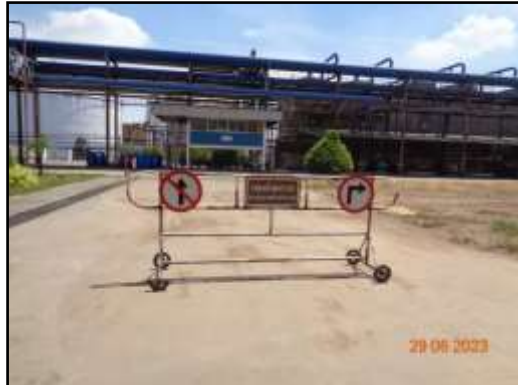
รูปที่ 2-32 สัญญาณจราจรภายในพื้นที่โครงการ