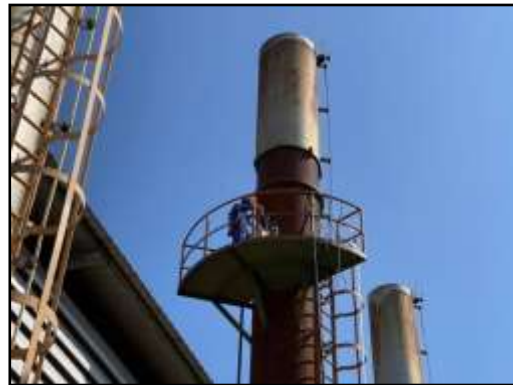
รูปที่ 2-1 ปล่องระบายอากาศของหม้อน้ำ ขนาด 20 ตัน