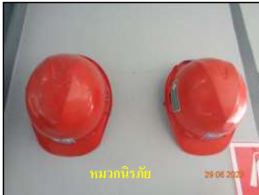
หมวกนิรภัย