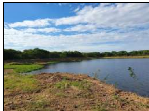
รูปที่ 2-56 พื้นที่ติดตั้งหน่วยผลิตไฟฟ้าจากพลังงานแสงอาทิตย์แบบทุ่นลอย (Floating Solar Panels) บนบ่อหนองน้ำ (บ่อ B5)