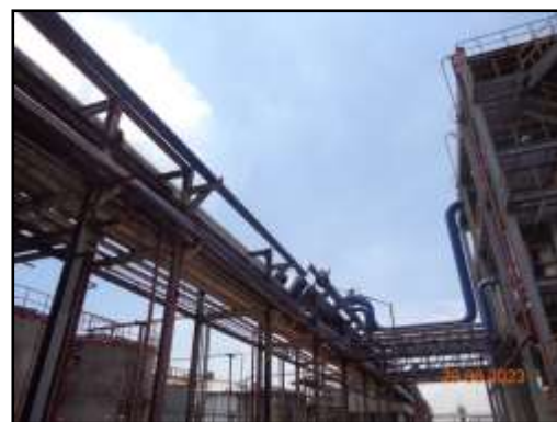
รูปที่ 2-14 ระบบขนส่งกากน้ำตาล เข้าสู่พื้นที่โครงการเพื่อใช้ในกระบวนการผลิตเป็นระบบท่อ