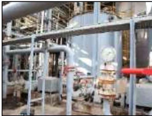
รูปที่ 2-46 มาตรวัด (Flow meter) เพื่อตรวจสอบการไหลของกากน้ำตาล