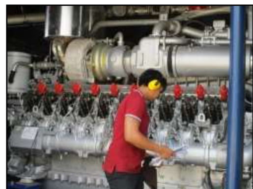
รูปที่ 2-21 พนักงานสวมใส่อุปกรณ์ป้องกันอันตรายส่วนบุคคลขณะปฏิบัติงาน