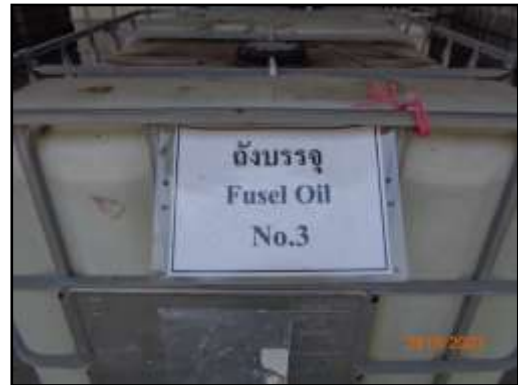
รูปที่ 2-16 ถังเก็บฟูเซลออยล์