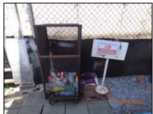
รูปที่ 2-35 ถังขยะภายในโครงการ