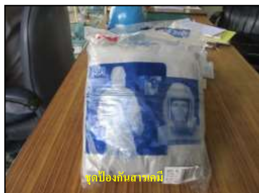
ชุดป้องกันสารเคมี