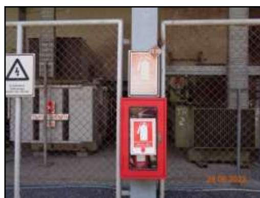
รูปที่ 2-54 ถังดับเพลิงภายในพื้นที่โครงการ