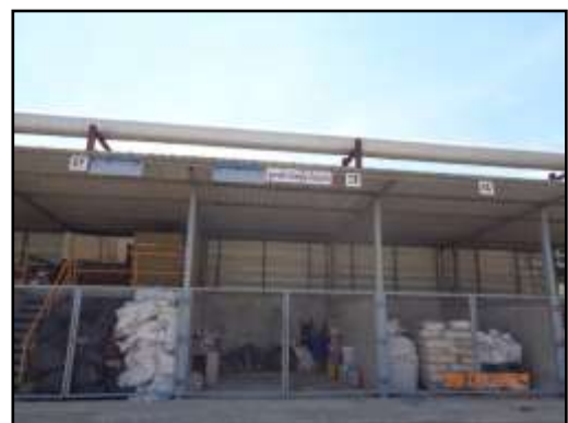
รูปที่ 2-36 พื้นที่เก็บขยะมูลฝอยหรือสิ่งปฏิกูลและวัสดุที่ไม่ใช้แล้ว