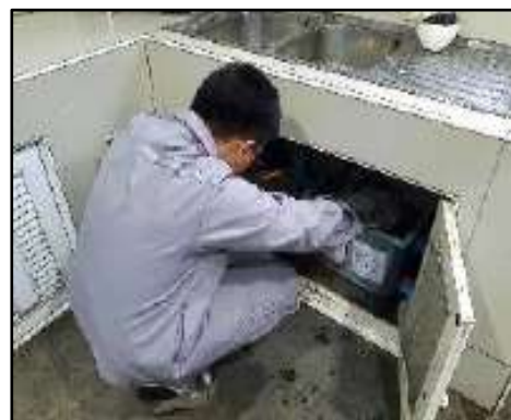
รูปที่ 2-25 ถังดักไขมันในโรงอาหาร