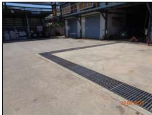
รูปที่ 2-23 รางระบายน้ำฝนรอบพื้นที่โครงการ