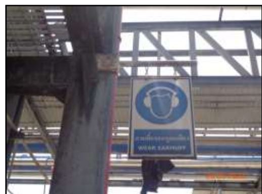
รูปที่ 2-20 ป้ายเตือน ให้สวมใส่อุปกรณ์ป้องกันอันตรายขณะปฏิบัติงาน