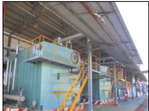
รูปที่ 2-4 หม้อน้ำ (Boiler)