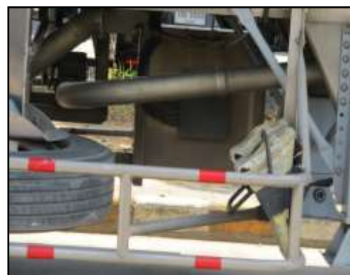
รูปที่ 2-34 อุปกรณ์ดับเพลิงในรถบรรทุกที่ใช้ภายในโครงการ