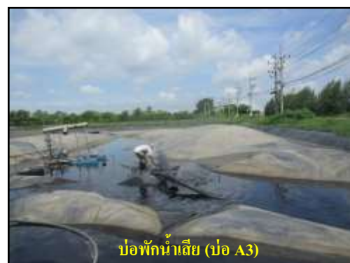
รูปที่ 2-10 บ่อพักน้ำเสียของโครงการ