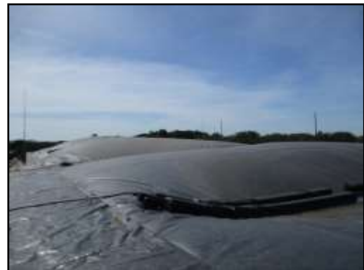
รูปที่ 2-8 ระบบบำบัดน้ำเสียของโครงการ