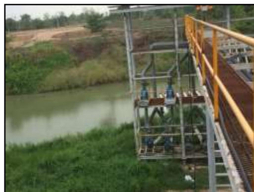
รูปที่ 2-29 สถานีสูบน้ำดิบแม่น้ำป่าสัก