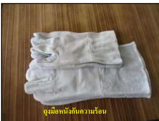
ถุงมือหนังกันความร้อน