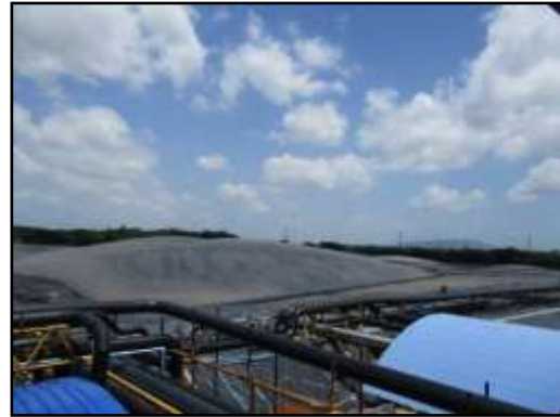
รูปที่ 2-9 พลาสติก HDPE ปิดคลุมบ่อพักน้ำเสียของโครงการ