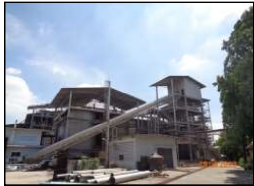
รูปที่ 2-3 ปล่องระบายของหม้อน้ำ ขนาด 2 ตัน