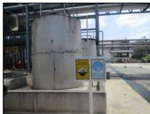
รูปที่ 2-51 ถังเก็บ NaOH