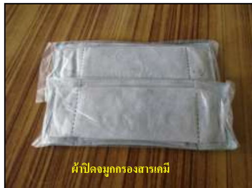
ผ้าปิดจมูกกรองสารเคมี