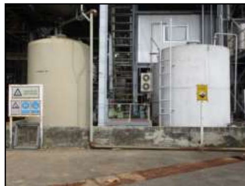
รูปที่ 2-52 ถังเก็บ H_2SO_4