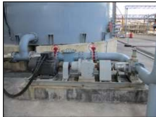
รูปที่ 2-47 ปั๊มสูบกากน้ำตาล