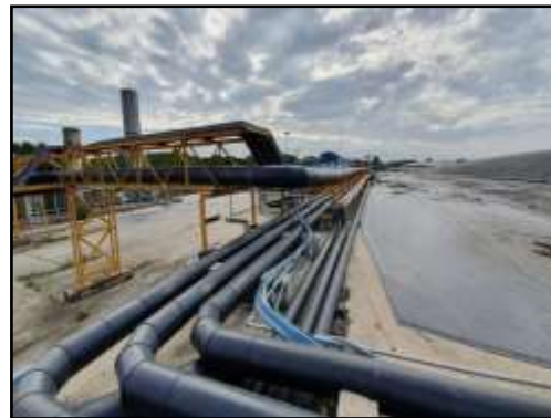
รูปที่ 2-48 ท่อที่ใช้ในการลำเลียงก๊าซชีวภาพของโครงการเป็นท่อ HDPE PE100/PN10