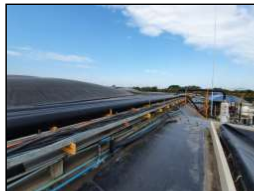
รูปที่ 2-12 บ่อหมักของระบบผลิตก๊าซชีวภาพ ของโครงการ