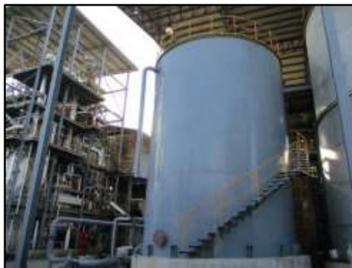
รูปที่ 2-45 ถังเก็บกากน้ำตาล