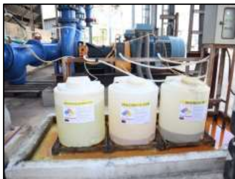
รูปที่ 2-53 ระบบที่รวบรวมสารเคมีกรณีรั่วไหล ไม่ให้ปนเปื้อนสู่แหล่งน้ำสาธารณะ