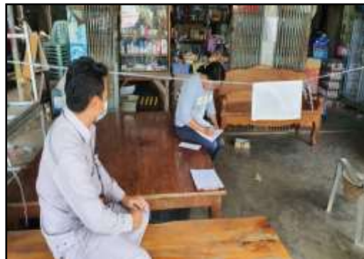
รูปที่ 2-37 การประชาสัมพันธ์ให้ความรู้ด้านต่างๆ แก่ชุมชนในพื้นที่