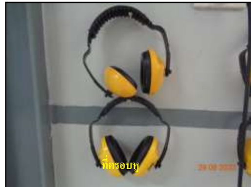
ที่ครอบหู