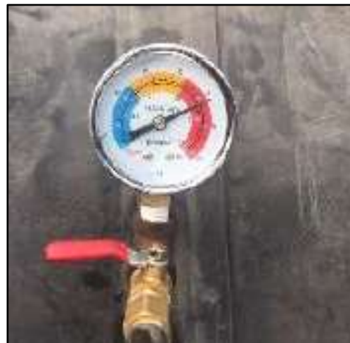
รูปที่ 2-49 การติดตั้งอุปกรณ์เพื่อความปลอดภัยของระบบท่อลำเลียงก๊าซชีวภาพ