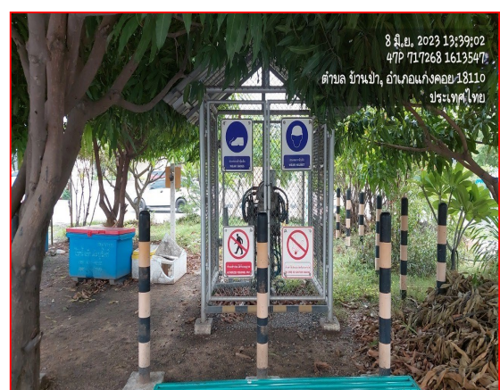
ป้ายเตือนแนวท่อส่งก๊าซฯ

ภาพที่ 3.2-1 ภาพถ่ายระบบรักษาความปลอดภัยบริเวณสถานีก๊าซโครงการท่อส่งก๊าซธรรมชาติไปยังสถานีบริการ NGV ของสมาคมขนส่งทางบกแห่งประเทศไทย พื้นที่ อ.แก่งคอย จ.สระบุรี