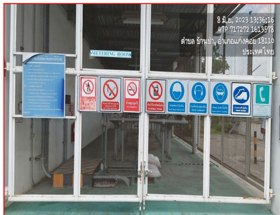
ป้ายเตือนความปลอดภัย