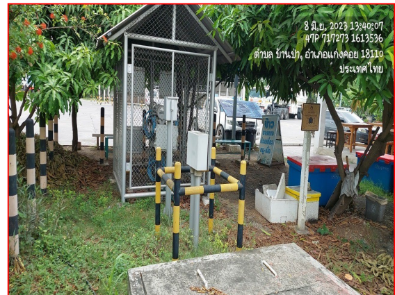
ป้ายเตือนแนวท่อส่งก๊าซฯ