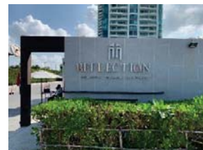
โครงการ Reflection Jomtien Beach Pattaya