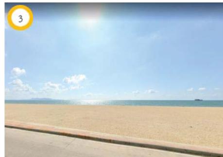
ถนนจอมเทียนสาย 1 และชายฝั่งทะเลอ่าวไทย