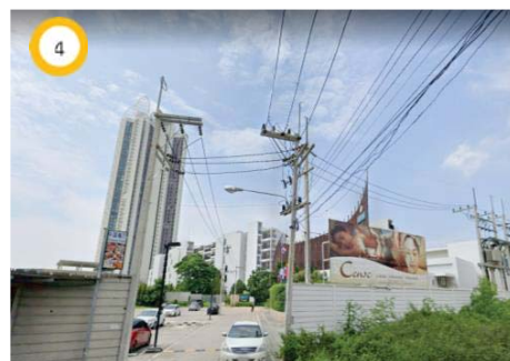
โรงแรม Centra by Centara Maris Resort Jomtien

ที่มา : ดัดแปลงจากภาพถ่ายดาวเทียมโปรแกรม Google Earth, 2022