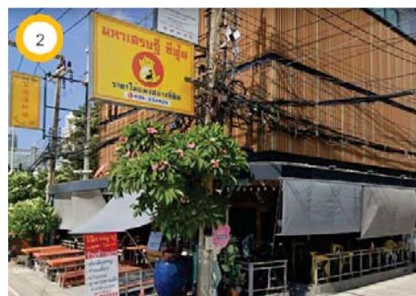
ร้านอาหารมหาเศรษฐีซีฟู้ด