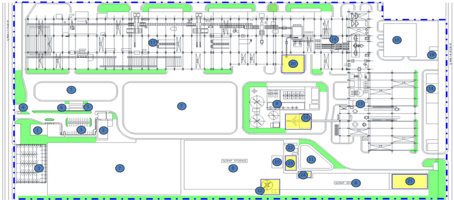
สัญลักษณ์