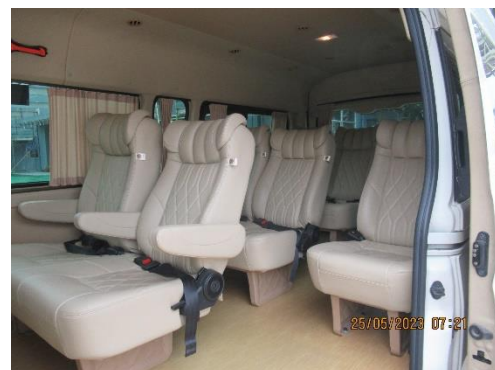
ภาพที่ 2-16 รถยนต์ของโครงการพร้อมเบอร์โทรศัพท์ติดต่อ