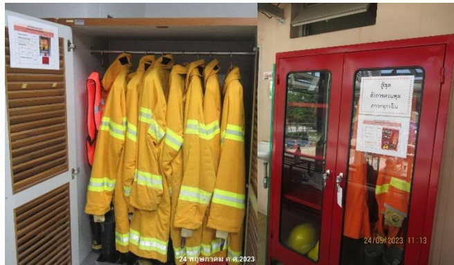
ภาพที่ 2-33 SCBA และชุดดับเพลิง