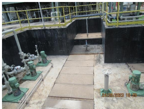
ภาพที่ 2-7 ถังแยกน้ำ-น้ำมัน