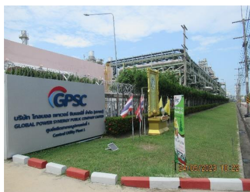
ภาพที่ 2-38 บริเวณพื้นที่สีเขียวของโครงการ