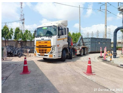
ภาพที่ 2-21 การขนส่งกากของเสีย