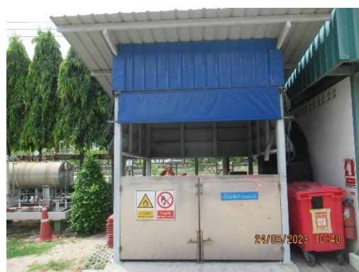
ภาพที่ 2-20 ภาพขณะรองรับขยะในพื้นที่โครงการและอาคารรวบรวมสิ่งปฏิกูลและวัสดุที่ไม่ใช้แล้ว