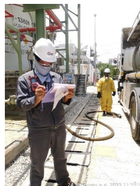
ภาพที่ 2-12 พนักงานสวมใส่อุปกรณ์ป้องกันอันตรายส่วนบุคคล