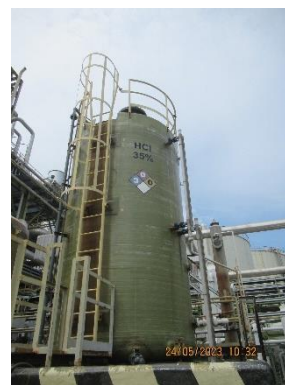
ภาพที่ 2-28 ถังเก็บสารละลาย HCl