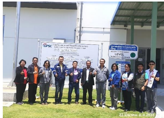
ภาพที่ 2-43 ผู้นำชุมชนเข้าเยี่ยมโครงการ