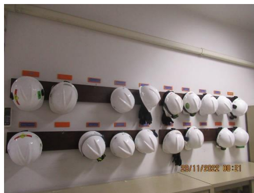
ภาพที่ 2-23 พื้นที่จัดเก็บอุปกรณ์ PPE