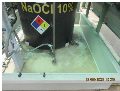
ภาพที่ 2-26 คันคอนกรีตป้องกันการรั่วไหลของสารเคมี