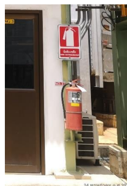
ภาพที่ 2-37 เครื่องดับเพลิงชนิดผง (Powder Extinguisher)