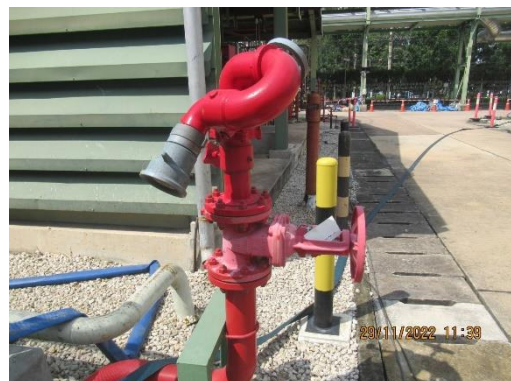
ภาพที่ 2-34 ตัวอย่างอุปกรณ์เตือนภัยและระงับเหตุฉุกเฉินของทางโครงการ