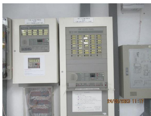
ภาพที่ 2-32 ตู้ควบคุมสัญญาณเตือนต่างๆ