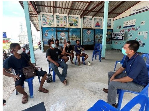
ภาพที่ 2-42 ลงพื้นที่สำรวจความคิดเห็นชุมชน และบันทึกข้อร้องเรียนหรือข้อเสนอแนะ