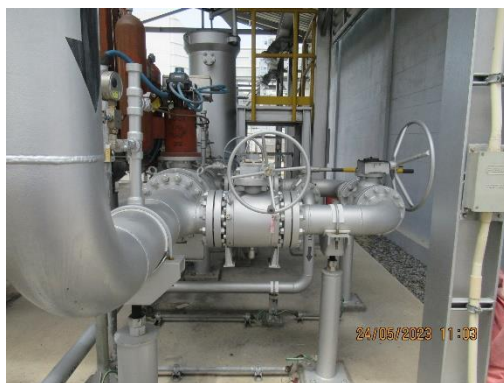
ภาพที่ 2-36 วาล์วควบคุมการจ่ายก๊าซ