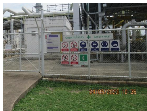
ภาพที่ 2-13 ป้ายเตือนอันตรายภายในพื้นที่โครงการ