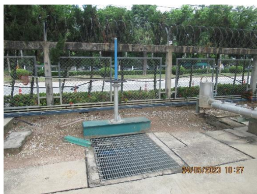
ภาพที่ 2-9 ประตูละบายน้ำของรางระบายน้ำฝน