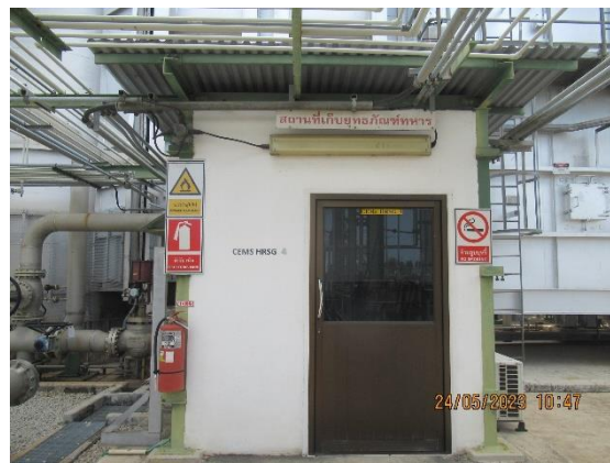
ภาพที่ 2-1 เครื่องตรวจวัดคุณภาพอากาศ (CEMs) ของโครงการ