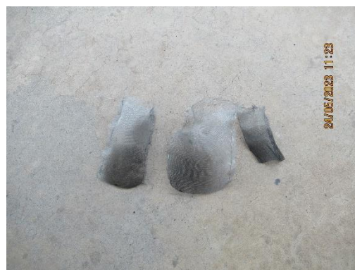
ภาพที่ 2-17 อุปกรณ์ดักจับลูกไฟติดกับท่อไอเสียรถยนต์