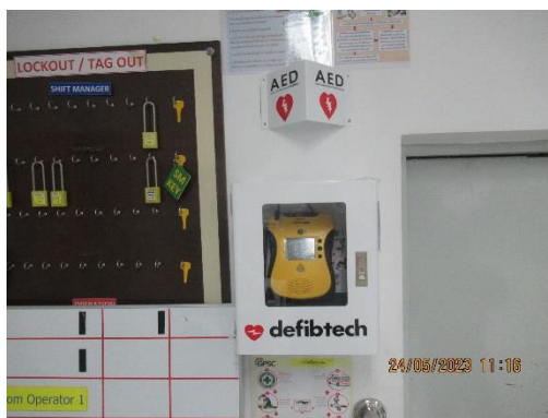
ภาพที่ 2-39 เครื่องกระตุกหัวใจไฟฟ้าแบบอัตโนมัติ