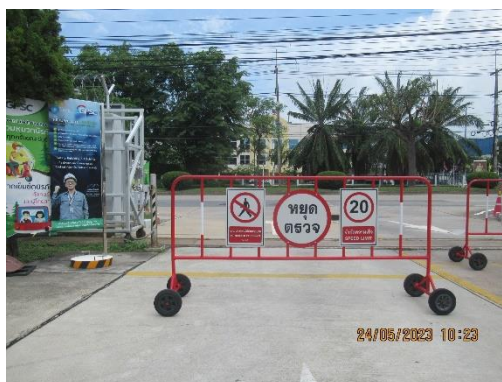
ภาพที่ 2-18 ป้ายจำกัดความเร็วในพื้นที่โครงการ