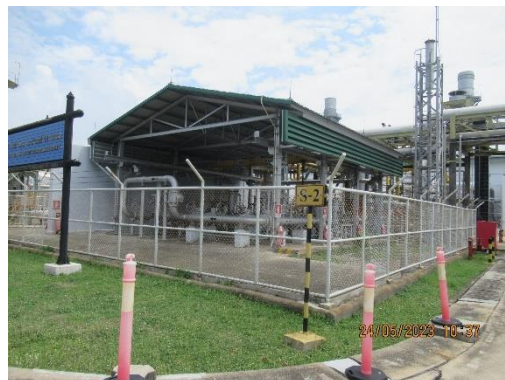
ภาพที่ 2-35 สถานีควบคุมความดันและวัดปริมาตรก๊าซ (MRS)