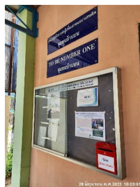
ภาพที่ 2-40 ตู้รับฟังความคิดเห็นบริเวณใกล้เคียงโครงการ และที่ทำการประธานชุมชน