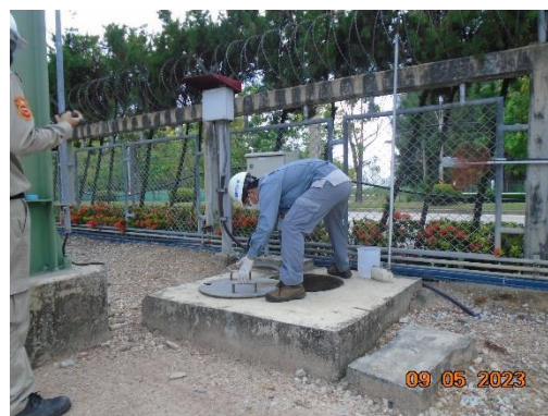
ภาพที่ 2-6 ป่อตรวจสอบคุณภาพน้ำทิ้ง (Inspection Manhole)