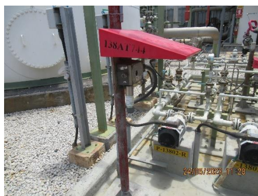
ภาพที่ 2-31 Gas Detector และ Ammonia Detector