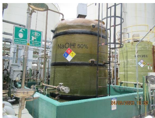
ภาพที่ 2-27 ถังเก็บสารละลาย NaOH