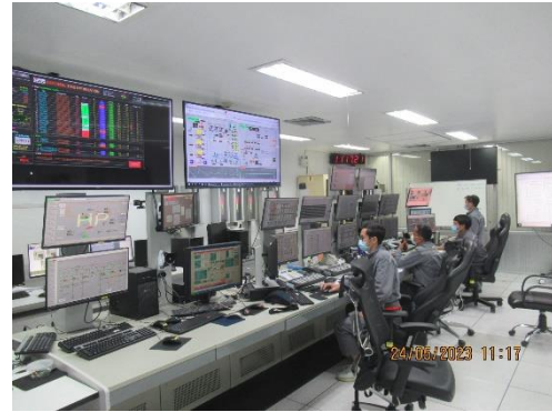
ภาพที่ 2-14 Control Room