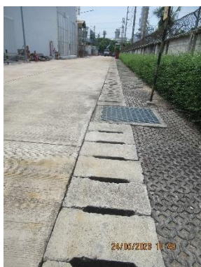
ภาพที่ 2-8 รางระบายน้ำฝน