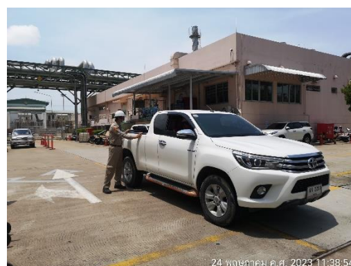
ภาพที่ 2-19 เจ้าหน้าที่อำนวยความสะดวกบริเวณทางเข้า-ออกของพื้นที่โครงการ