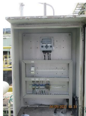
ภาพที่ 2-4 การติดตั้งเครื่องมือตรวจวัดคุณภาพน้ำอัตโนมัติ