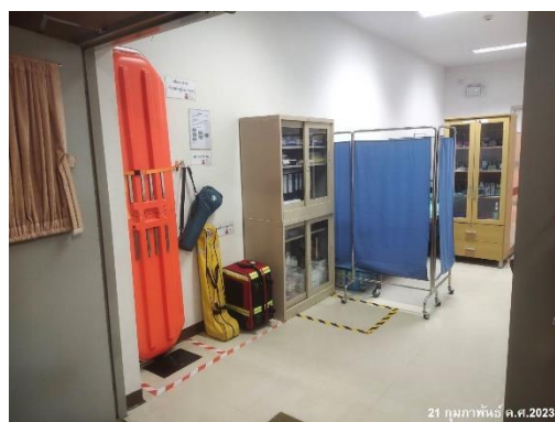
ภาพที่ 2-22 ห้องพยาบาล อุปกรณ์ First aid เวชภัณฑ์ ของโครงการ และรถตรวจการณ์