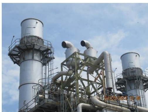
ภาพที่ 2-11 Silencer