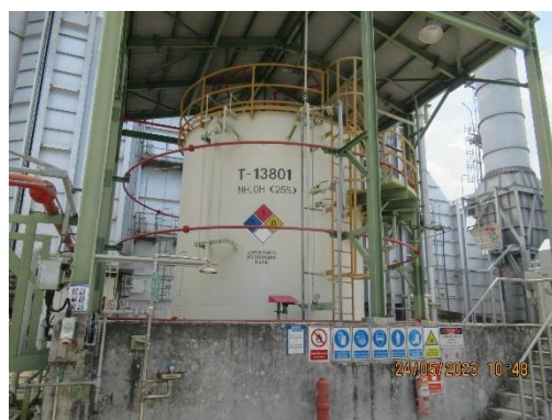
ภาพที่ 2-30 ถังเก็บสารละลาย \text{NH}_4\text{OH}