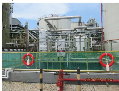
ภาพที่ 2-5 ถังปรับสภาพ (Neutralization Basin)