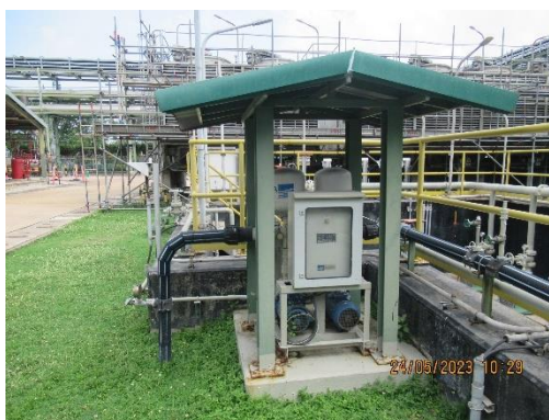
ภาพที่ 2-3 การติดตั้งอุปกรณ์เพื่อนำน้ำทิ้งกลับมาใช้ประโยชน์