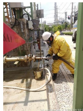
ภาพที่ 2-29 รถสุบถ่ายสารเคมี