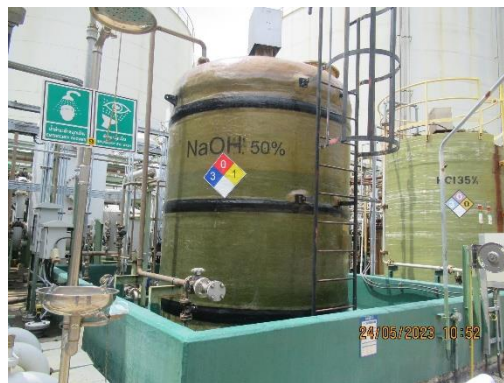
ภาพที่ 2-24 SDS และ NFPA Diamond