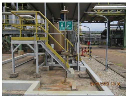
ภาพที่ 2-25 อ่างล้างตาและฝักบัวฉุกเฉิน