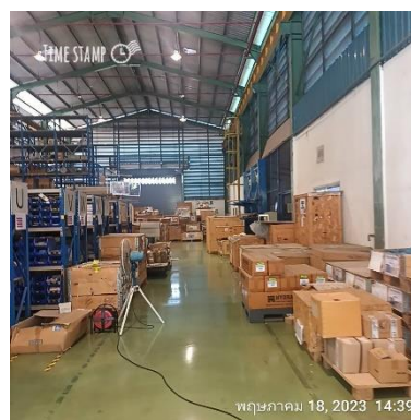
ภาพที่ 2-2 สถานที่จัดเก็บอุปกรณ์และอะไหล่สำรองในโรงงาน