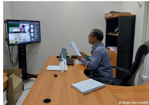
ภาพที่ 2-15 การอบรมพนักงานและผู้รับเหมา