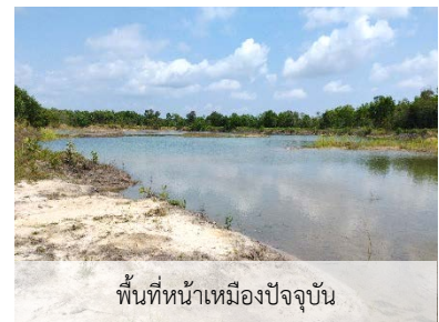
พื้นที่หน้าเมืองปัจจุบัน