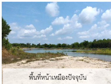
พื้นที่หน้าเมืองปัจจุบัน