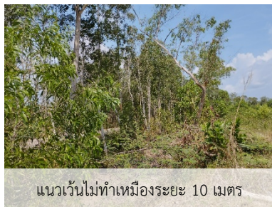
แนวเวนไม่ทำเหมืองระยะ 10 เมตร