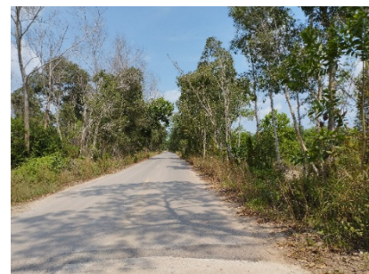
เส้นทางเข้าสู่พื้นที่โครงการ