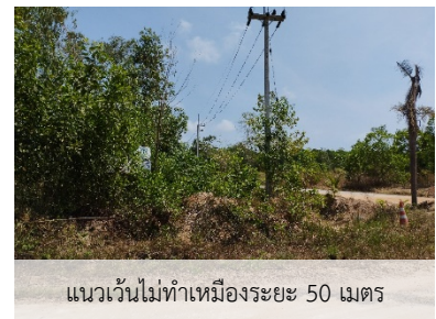
แนวเวนไม่ทำเหมืองระยะ 50 เมตร