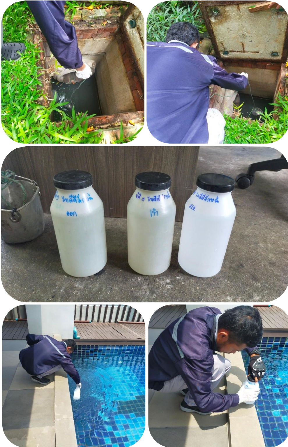
ภาพที่ 3.2-1(2) เก็บตัวอย่างน้ำบ่อบำบัดโครงการส่งตรวจสอบ