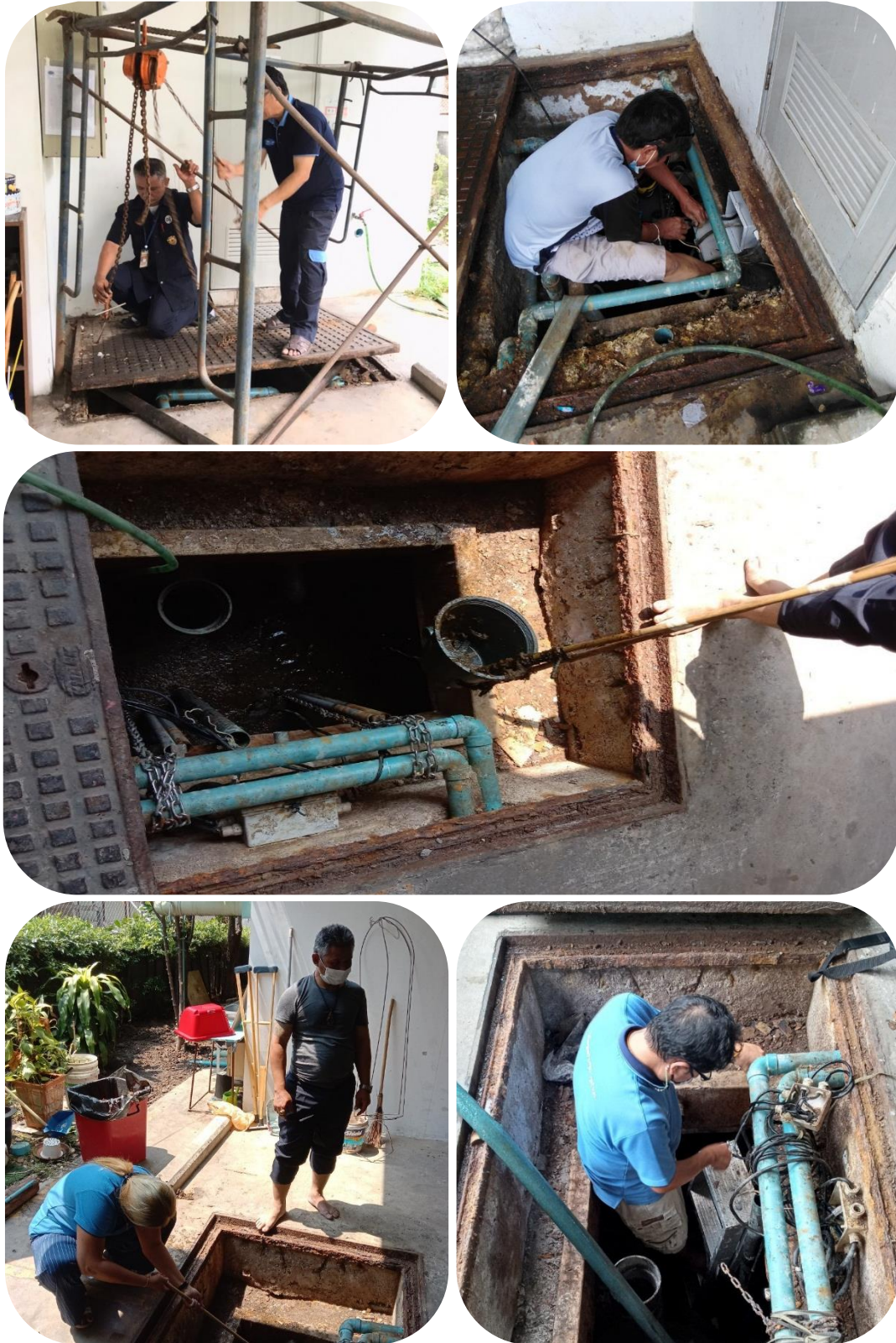
ภาพที่ 3.2-1 การดูแลระบบบำบัด