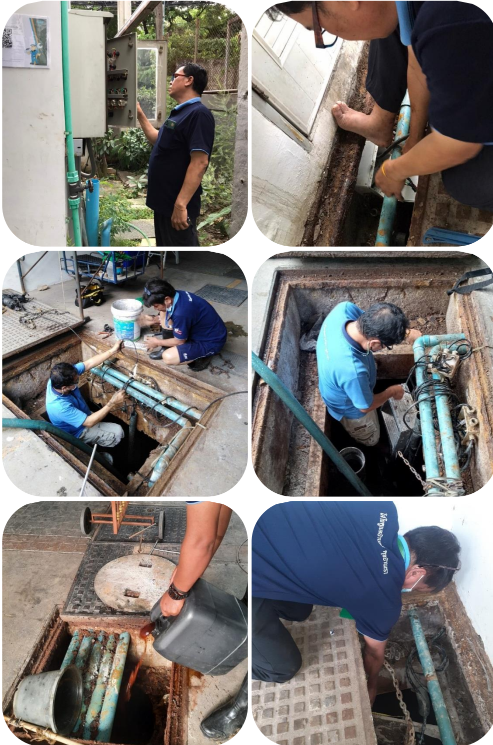
ภาพที่ 3.2-1(1) การดูแลระบบบำบัด