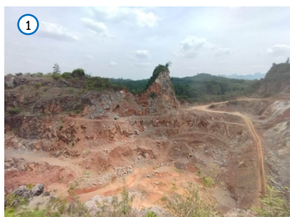
พื้นที่หน้าเหมือง