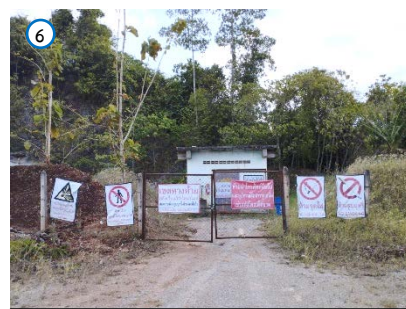
สถานที่เก็บวัตถุระเบิด