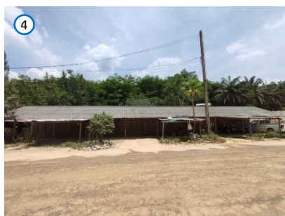
บ้านพักพนักงาน