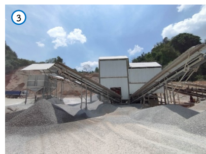
โรงโม่หินของโครงการ