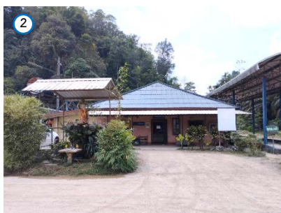
สำนักงานของโครงการ