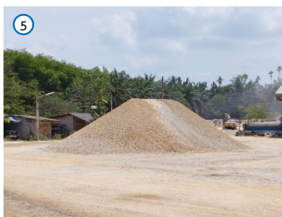
พื้นที่ลานกองแร่