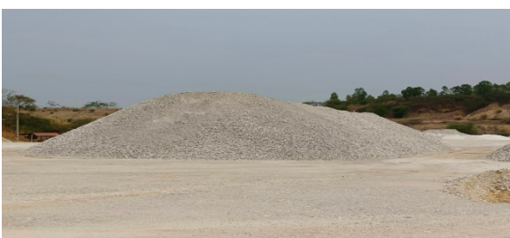
พื้นที่เก็บกองแร่ประทานบัตรที่ 29537/15092