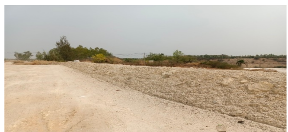
คันดินบริเวณขอบประทานบัตรที่ 29537/15092