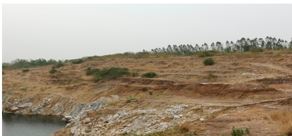
พื้นที่หน้าเหมืองประทานบัตรที่ 29537/15092