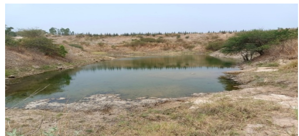
บ่อพักน้ำประทานบัตรที่ 29537/15092