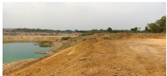
พื้นที่หน้าเหมืองประทานบัตรที่ 29536/15091