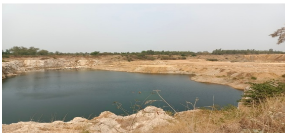
พื้นที่หน้าเหมืองประทานบัตรที่ 32253/16045