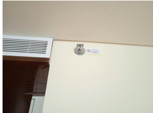
ภาพที่ 14 สปริงเกอร์ฉีดน้ำดับเพลิง