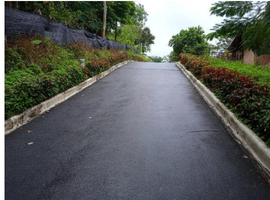
ภาพที่ 2 เส้นทางสัญจรในโครงการ