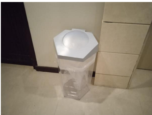
ภาพที่ 9 ถังขยะบริเวณพื้นที่โครงการ