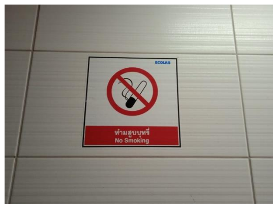
ภาพที่ 18 ป้ายเตือนห้ามสูบบุหรี่