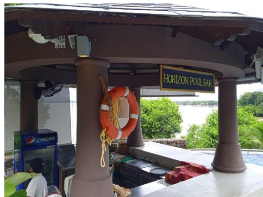
ภาพที่ 28 ท่วงยางชูชีพ