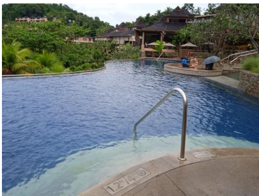
ภาพที่ 27 สระว่ายน้ำ