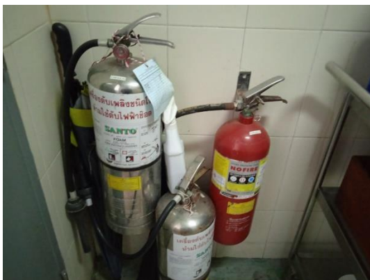
ภาพที่ 21 ถังเคมีดับเพลิง