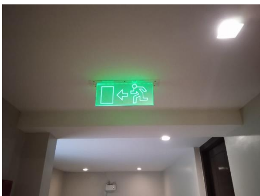
ภาพที่ 5 ป้ายแสดงทางหนีไฟ