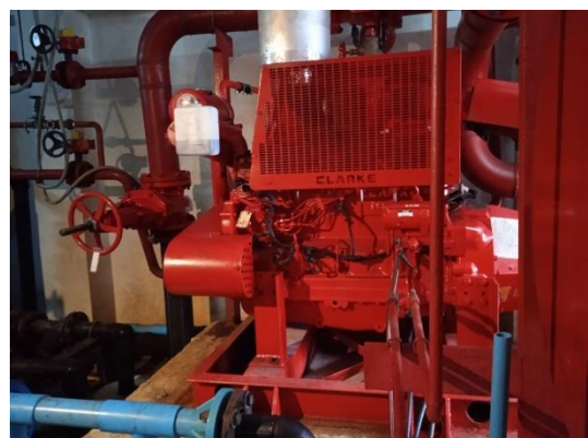
ภาพที่ 24 ปั๊มน้ำดับเพลิง