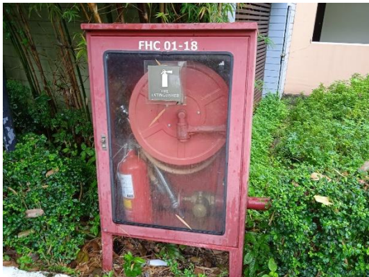
ภาพที่ 19 ตู้เก็บอุปกรณ์ดับเพลิง