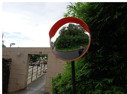
ภาพที่ 6 กระจกนูน