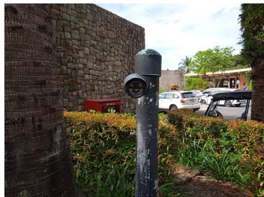
ภาพที่ 22 กล้องวงจรปิด