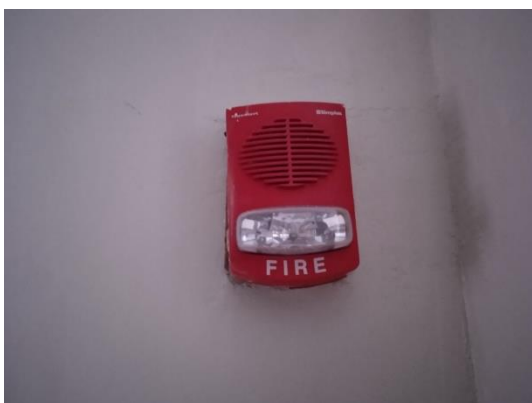
ภาพที่ 17 สัญญาณไฟฉุกเฉิน