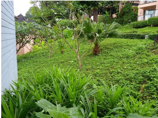
ภาพที่ 1 พื้นที่สีเขียวภายในโครงการ

โรงแรม เดอะ เวสทิน ลิโพรเบย์ รีสอร์ท แอนด์ สปา ภูเก็ต ประจำปีเดือน กรกฎาคม-ธันวาคม พ.ศ. 2565