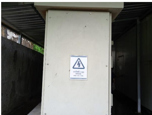
ภาพที่ 3 หม้อแปลงไฟฟ้า