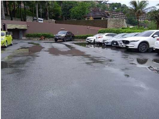
ภาพที่ 7 ลานจอดรถ