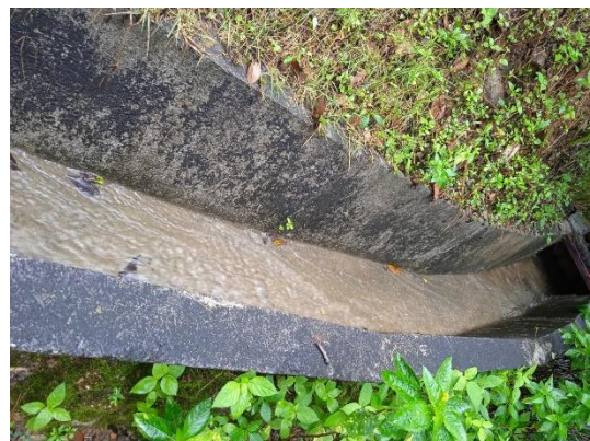
ภาพที่ 4 รางระบายน้ำฝน