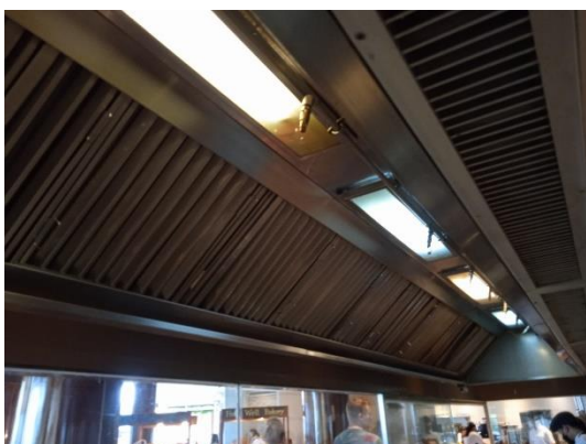
ภาพที่ 29 เครื่องดูดควันและกลิ่นในห้องครัว