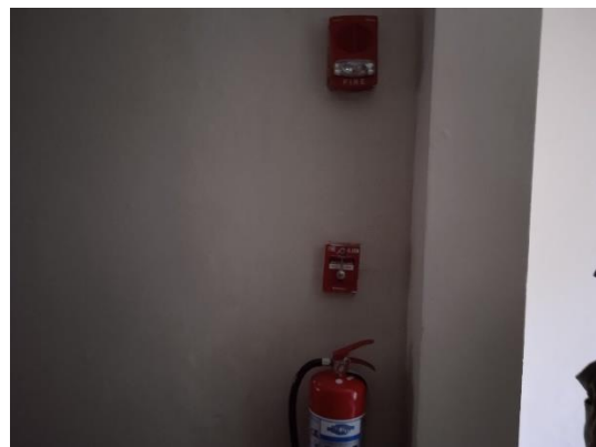
ภาพที่ 16 อุปกรณ์แจ้งเหตุฉุกเฉิน