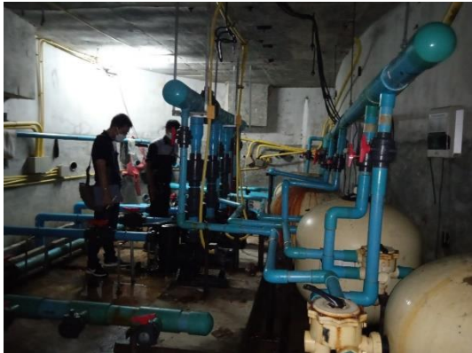
ภาพที่ 25 ระบบปรับปรุงคุณภาพน้ำสระว่ายน้ำ