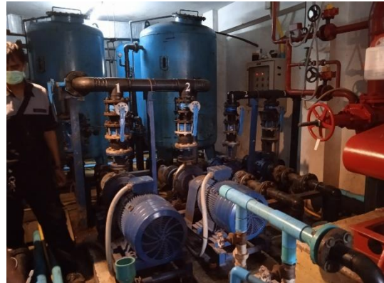
ภาพที่ 26 ระบบปรับปรุงคุณภาพน้ำใช้