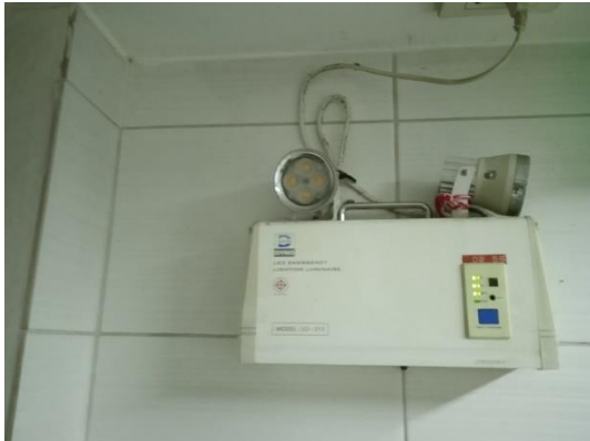
ภาพที่ 13 ไฟส่องสว่างฉุกเฉิน

โรงแรม เดอะ เวสทิน สิเธอร์เบย์ รีสอร์ท แอนด์ สปา ภูเก็ต ประจำเดือน กรกฎาคม-ธันวาคม พ.ศ. 2565