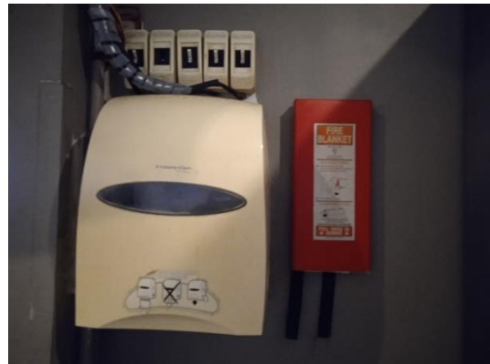
ภาพที่ 20 ผ้าห่มกันไฟ