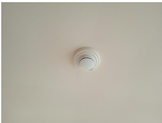
ภาพที่ 15 เครื่องตรวจจับควัน