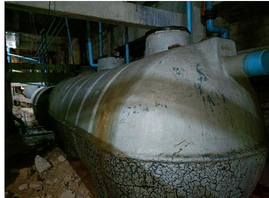
ภาพที่ 8 ระบบบำบัดน้ำเสีย