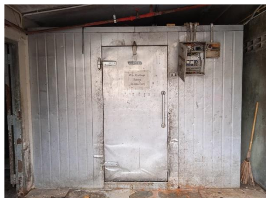
ภาพที่ 12 ที่พักขยะเปียก