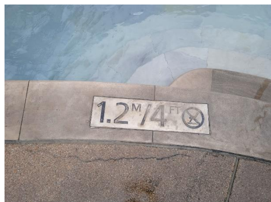
ภาพที่ 30 ป้ายบอกระดับความลึกสระว่ายน้ำ