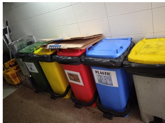
ภาพที่ 10 ถังขยะบริเวณห้องครัว