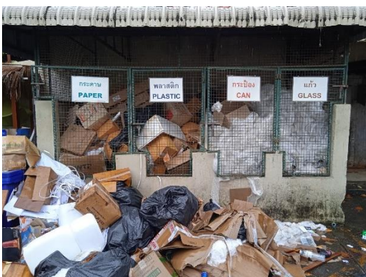
ภาพที่ 11 ที่พักขยะรีไซเคิล