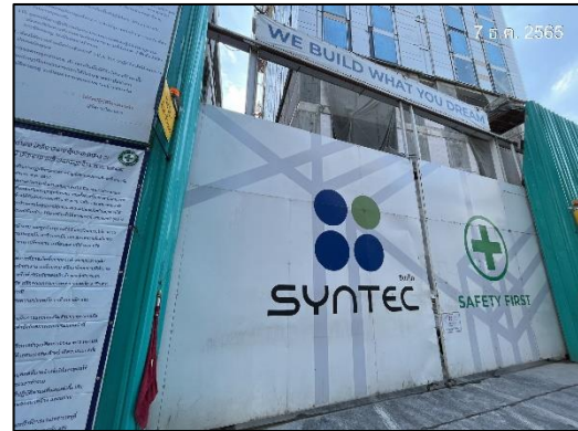
ภาพที่ 8 ประตูทางเข้า-ออกปิดทึบ