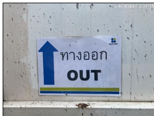
ภาพที่ 19 ป้ายแสดงทางเข้า-ออกพื้นที่โครงการ