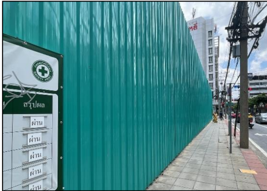
ภาพที่ 1 รั้ว Metal Sheet