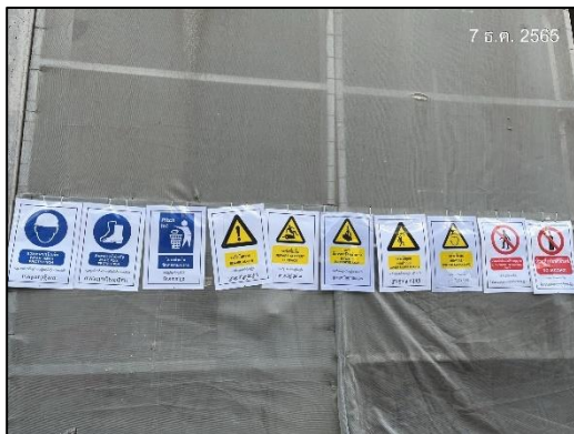
ภาพที่ 9 ป้ายเตือนอันตราย