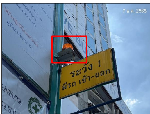
ภาพที่ 5 สัญญาณไฟกระพริบ