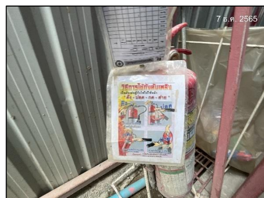
ภาพที่ 11 ถังดับเพลิง และป้ายแนะนำการใช้อุปกรณ์