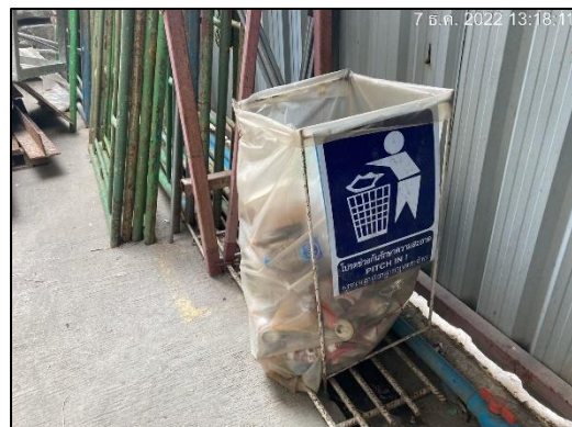
ภาพที่ 15 ถังรองรับมูลฝอย