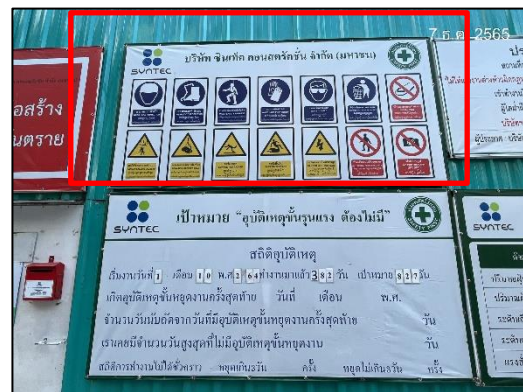
ภาพที่ 4 ป้ายแนะนำการทำงาน