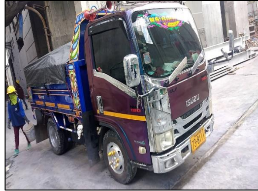
ภาพที่ 20 ผ้าใบปิดคลุมท้ายรถบรรทุก