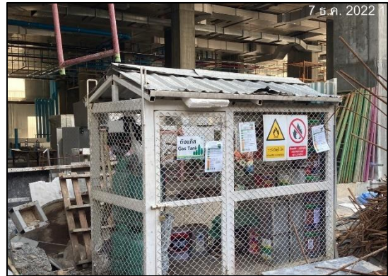
ภาพที่ 17 พื้นที่จัดเก็บวัสดุไวไฟ