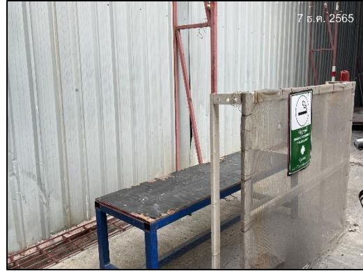
ภาพที่ 12 พื้นที่สูบบุหรี่