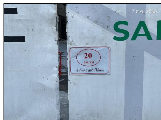
ภาพที่ 6 ป้ายจำกัดความเร็ว