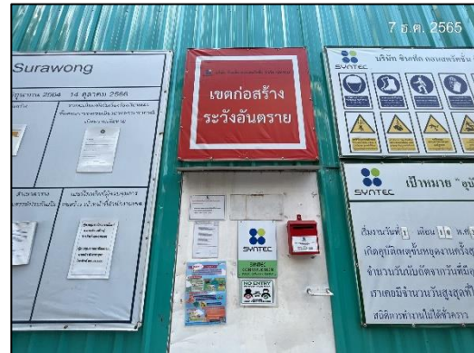
ภาพที่ 2 ป้ายแสดงเขตพื้นที่ก่อสร้าง