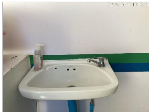
ภาพที่ 18 ห้องน้ำ ห้องส้วม