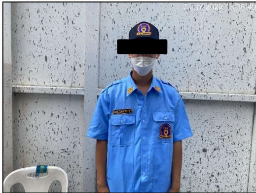
ภาพที่ 16 เจ้าหน้าที่รักษาความปลอดภัย