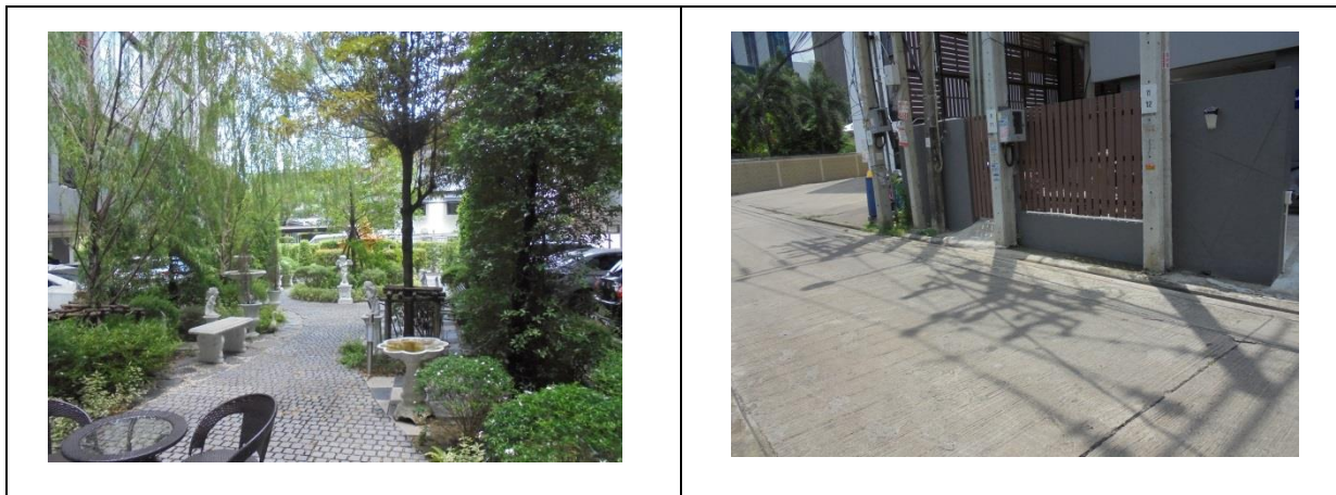
รูปที่ 1.7-1 สถานภาพปัจจุบันของโครงการ

สถานภาพของโครงการในปัจจุบัน ขณะทำการสำรวจเมื่อเดือนมิถุนายน 2565 พบว่า โครงการอยู่ในช่วงระยะดำเนินการ แสดงสถานภาพโครงการในปัจจุบันได้ดังรูปที่ 1.7-1