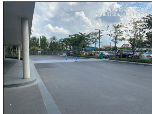
ภาพที่ 1.6-1 สถานภาพโครงการในปัจจุบัน