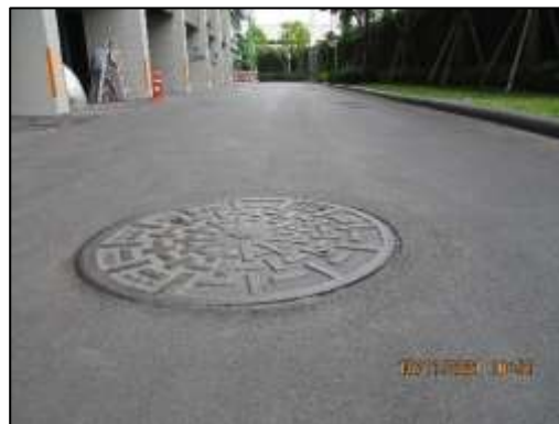
รูปที่ 1-4 ระบบบำบัดน้ำเสียของโครงการ ซึ่งฝังอยู่ใต้ดิน