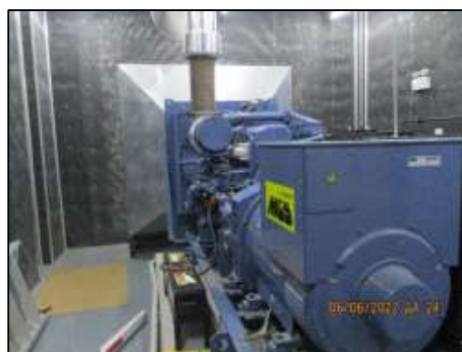
รูปที่ 1-7 เครื่องกำเนิดไฟฟ้า