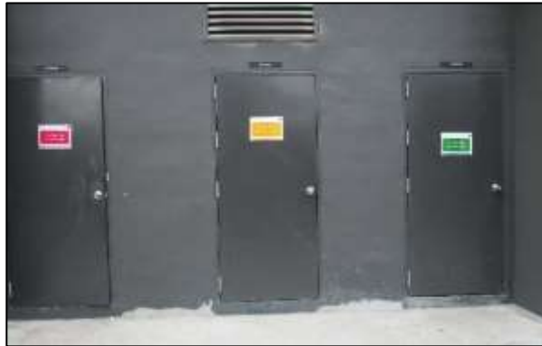
รูปที่ 1-5 ที่พักขยะรวม

ขยะที่เก็บได้จากห้องพักขยะประจำชั้น จะขนย้ายไปเก็บยังที่พักขยะรวม บริเวณชั้นที่ 1 จำนวน 3 ห้อง แยกเป็นห้องขยะแห้ง และขยะรีไซเคิล จำนวน 1 ห้อง และห้องพักขยะเปียก จำนวน 1 ห้อง และห้องพักขยะอันตราย จำนวน 1 ห้อง สามารถเก็บขยะได้นานมากกว่า 3 วัน ดังแสดงในรูปที่ 1-5