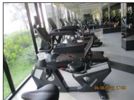
รูปที่ 1-10 (ต่อ) พื้นที่สีเขียว และพื้นที่นันทนาการของโครงการ