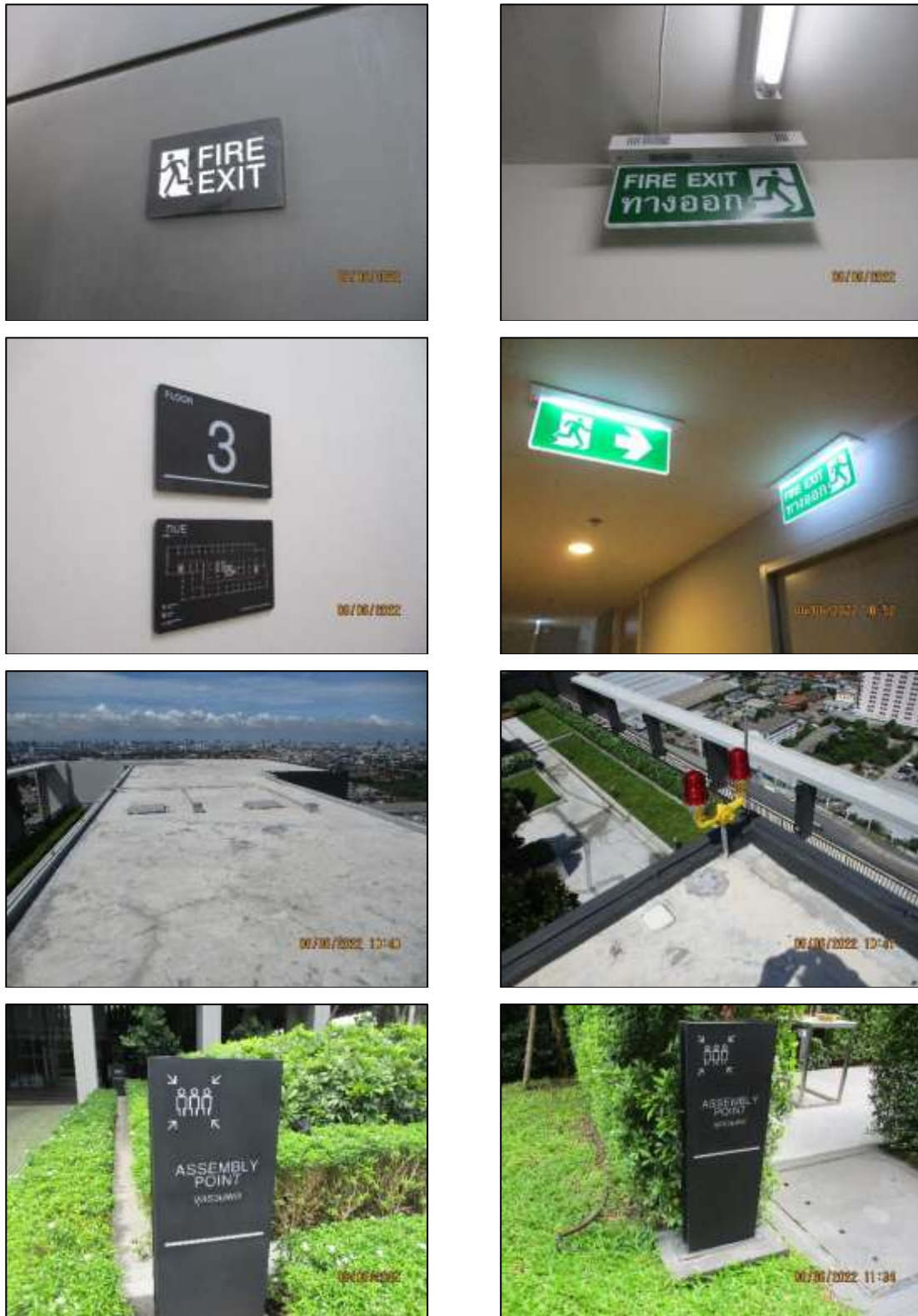
รูปที่ 1-9 (ต่อ) ระบบป้องกันอัคคีภัย