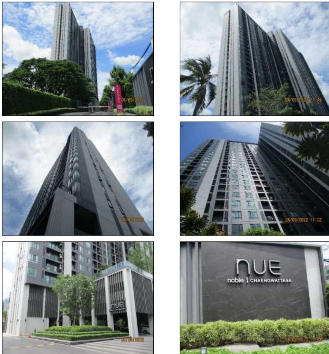
รูปที่ 1-2 สภาพปัจจุบันของโครงการ

ปัจจุบันโครงการอยู่ในช่วงเปิดดำเนินการ โดยโครงการได้รับใบรับรองการก่อสร้างอาคาร ตัดแปลงอาคาร หรือเคลื่อนย้ายอาคาร (อ.6) เรียบร้อยแล้ว ดังแสดงในภาคผนวก ก-3 และแสดงใน รูปที่ 1-2