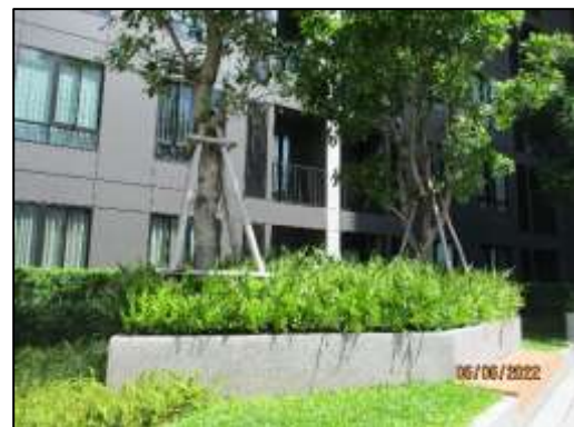
รูปที่ 1-10 พื้นที่สีเขียว และพื้นที่นันทนาการของโครงการ