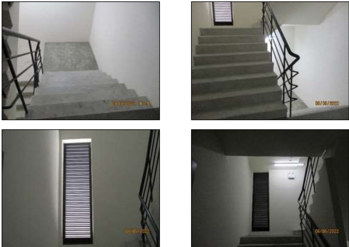
รูปที่ 1-8 ระบบระบายอากาศของบันไดหนีไฟ

2.2) โถงลิฟต์ดับเพลิง จัดให้มีลิฟต์ดับเพลิง จำนวน 1 ชุด โดยลิฟต์ดับเพลิงสามารถใช้เป็นลิฟต์โดยสารของอาคารด้วย มีความสูงตั้งแต่ชั้นใต้ดิน B2 ถึง ชั้นที่ 31 มีขนาดพื้นที่ประมาณ 6.8 ตร.ม. จัดให้เป็นระบบอัดอากาศด้วยพัดลมอัดอากาศ ขนาด 12,150 CFM จำนวน 2 ชุด ติดตั้งพัดลมอัดอากาศในชั้นที่ 3 และชั้นหลังคาภายในโถงลิฟต์ดับเพลิงจะรักษาความดันไม่น้อยกว่า 0.16 นิ้วน้ำ และพัดลมจะทำงานอัตโนมัติเมื่อเกิดเพลิงไหม้