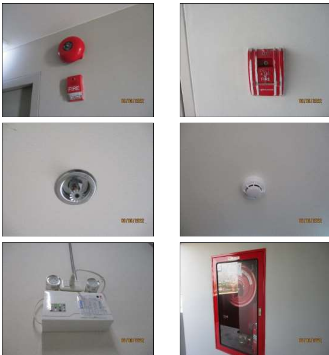
รูปที่ 1-9 ระบบป้องกันอัคคีภัย