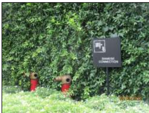
รูปที่ 1-3 หัวรับน้ำดับเพลิงนอกอาคาร

โครงการจัดให้มีหัวรับน้ำดับเพลิงนอกอาคาร จำนวน 2 หัว อยู่บริเวณพื้นที่จัดสวนหน้าอาคาร เป็นหัวรับน้ำแบบ 3 ทิศทาง เพื่อรับน้ำจากกรดดับเพลิงเดิมลงถังเก็บน้ำดับเพลิงใต้ดิน ดังแสดงในรูปที่ 1-3