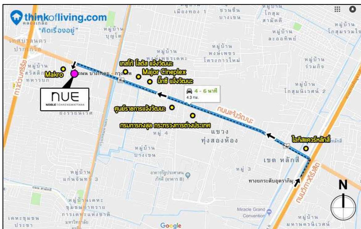
รูปที่ 1-1 แผนผังแสดงที่ตั้งโครงการ

โครงการอาคารชุดนิวโนเบิล เชียงวัฒนะ ของนิติบุคคลอาคารชุด นิว โนเบิล เชียงวัฒนะ ตั้งอยู่เลขที่ 65 หมู่ 8 ถนนเชียงวัฒนะ ตำบลบางตลาด อำเภอปากเกร็ด จังหวัดนนทบุรี ดังแสดงในรูปที่ 1-1