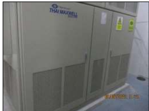
รูปที่ 1-6 หม้อแปลงไฟฟ้า