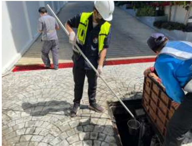
บ่อตรวจระบายน้ำ

รูปที่ 3-1 จุดตรวจวัดคุณภาพน้ำทิ้ง (Wastewater Quality) โครงการ The Vision ระหว่างเดือนกรกฎาคม – ธันวาคม พ.ศ.2565