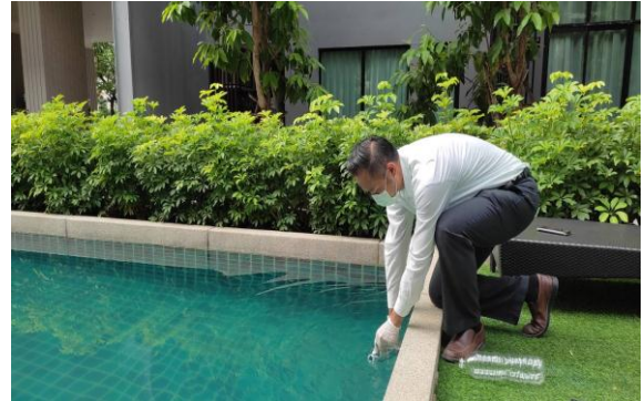
รูปที่ 3-2 จุดตรวจวัดคุณภาพน้ำสระว่ายน้ำ ของโครงการ SERENITY CONDOMINIUM ระหว่างเดือนกรกฎาคม - ธันวาคม พ.ศ.2565