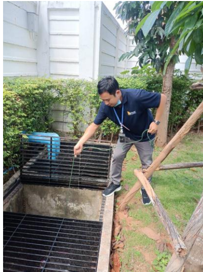
บ่อพักสุดท้าย

รูปที่ 3-1 จุดตรวจวัดคุณภาพน้ำทิ้ง (Wastewater Quality) ของโครงการ SERENITY CONDOMINIUM ระหว่างเดือนกรกฎาคม - ธันวาคม พ.ศ.2565