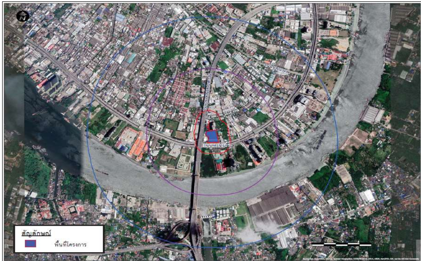
รูปที่ 2.1-1 แผนที่ตั้งโครงการ