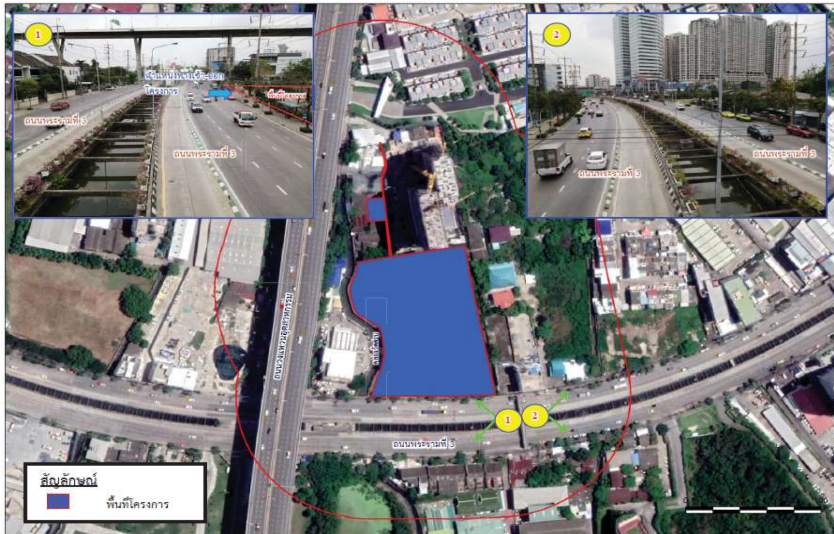
รูปที่ 2.6.9-1 ลักษณะทางกายภาพของถนนพระรามที่ 3 บริเวณด้านหน้าโครงการ