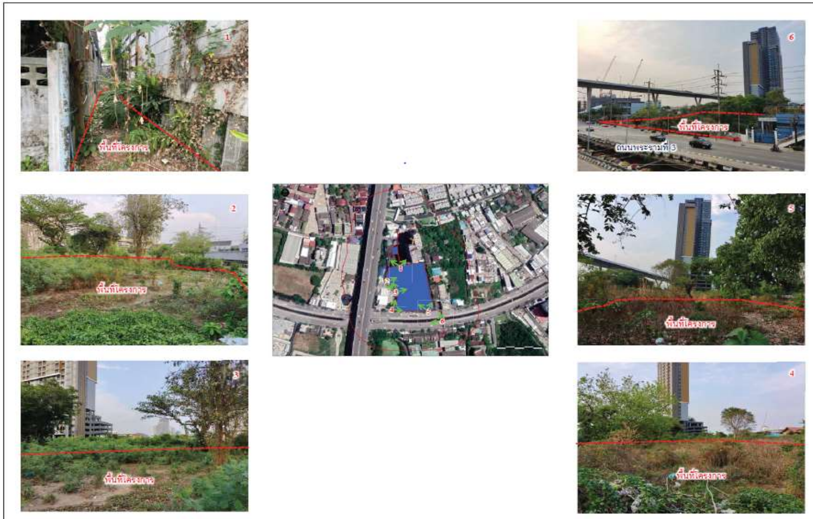
รูปที่ 2.1-3 สภาพพื้นที่ก่อนการพัฒนาโครงการ (เดือนมีนาคม 2564)