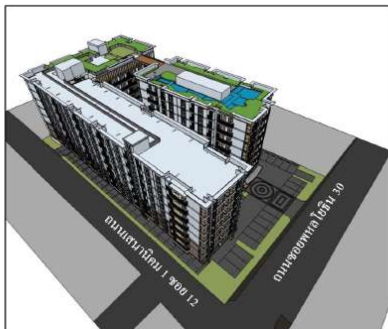
รูปที่ 2.3.1-1 แบบจำลองอาคารของโครงการ

อาคารชุดพักอาศัยของโครงการเป็นอาคารคอนกรีตเสริมเหล็กขนาดความสูง 8 ชั้นจำนวน 2 อาคาร (อาคาร A และ B) ความสูง 22.95 เมตร (ความสูงจากระดับพื้นดินที่ก่อสร้างถึงระดับพื้นชั้นดาดฟ้า) มีจำนวนห้องชุดพักอาศัยรวมทั้งสิ้น 309 ห้อง โครงการได้ออกแบบให้มีที่จอดรถยนต์รวมทั้งสิ้น 124 คัน (แบ่งเป็นที่จอดรถแบบปกติจำนวน 76 คัน คัน และที่จอดรถแบบติดตั้งระบบเคลื่อนย้ายรถด้วยเครื่องจักรกล (ระบบไฮดรอลิก) แบบ 2 ชั้นจำนวน 24 ช่องจอด สามารถจอดรถยนต์ได้รวม 48 คัน ( 2 คัน/ช่องจอด)) โดยภาพจำลองของอาคารโครงการแสดงดังรูปที่ 2.3.1-1