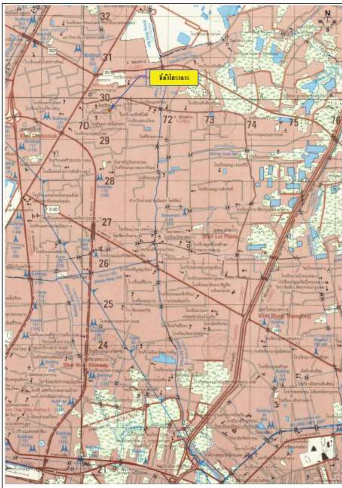
รูปที่ 2.1-1 ที่ตั้งของโครงการตามแผนที่ภูมิประเทศ 1 : 50,000 ของกรมแผนที่ทหาร