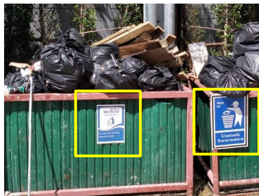
รูปที่ 14 ป้ายกำชับ “โปรดรักษาความสะอาด”