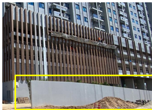
รูปที่ 1 รั้วชั่วคราว Metal Sheet สูง 6 เมตร และกำแพงคอนกรีตถาวร