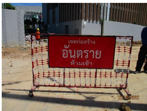
รูปที่ 2 ป้ายห้ามเข้าก่อนได้รับอนุญาต