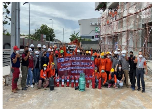
รูปที่ 32 ฝึกซ้อมดับเพลิงและฝึกซ้อมการอพยพหนีไฟ ประจำปี 2565