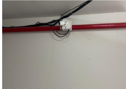
รูปที่ 34 กล้องวงจรปิด