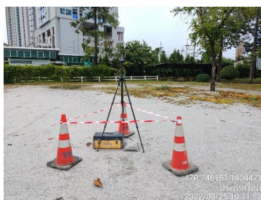
รูปที่ 18 ติดตั้งเครื่องตรวจวัดคุณภาพสิ่งแวดล้อม บริเวณพื้นที่ตลาดน้ำเกาะลอย