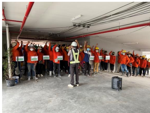
รูปที่ 10 กิจกรรม Safety Talk