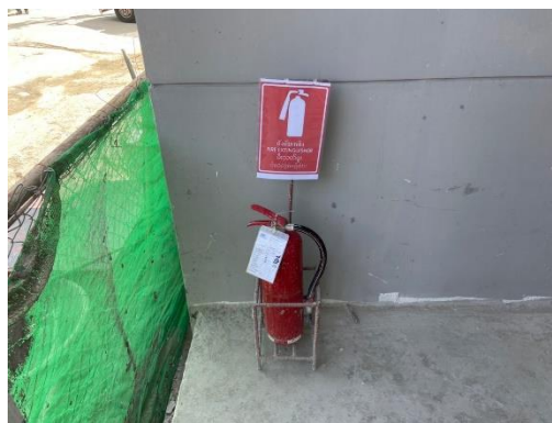
รูปที่ 27 ถังดับเพลิง และป้ายการตรวจสอบการใช้งาน