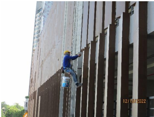
รูปที่ 37 อุปกรณ์ป้องกันอันตรายส่วนบุคคล (PPE)