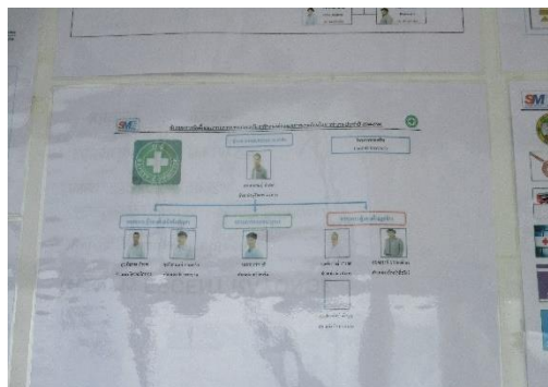
รูปที่ 26 ผังแสดงการจัดตั้งคณะกรรมการความปลอดภัย อาชีวอนามัยและสภาพแวดล้อมในการทำงาน ประจำปี 2564-2566