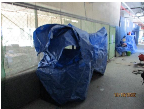
รูปที่ 5 ผ้าใบปิดคลุมวัสดุก่อสร้าง