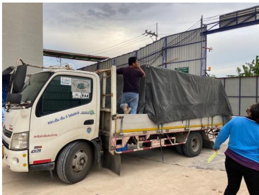
รูปที่ 8 ผ้าใบปิดคลุมท้ายรถบรรทุก