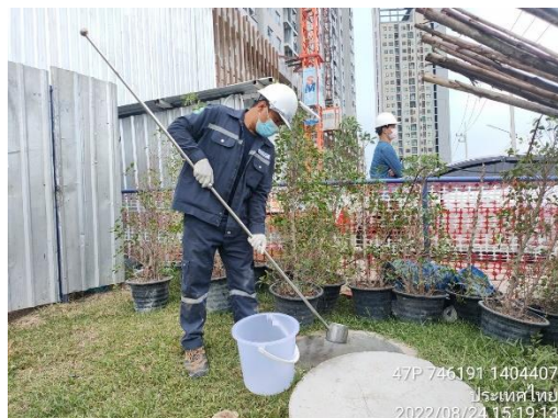
รูปที่ 17 ติดตั้งเครื่องตรวจวัดคุณภาพสิ่งแวดล้อม บริเวณพื้นที่โครงการ (ต่อ)