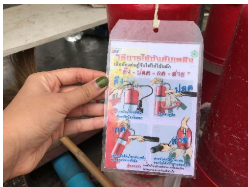
รูปที่ 28 ป้ายแนะนำวิธีการใช้งาน