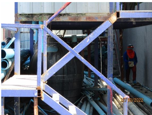
รูปที่ 20 ระบบบำบัดน้ำเสีย