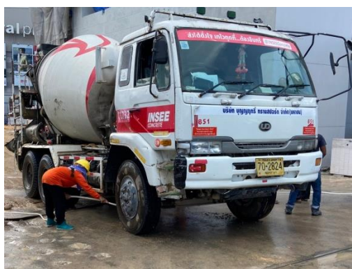
รูปที่ 15 รถผสมปูนสำเร็จรูป