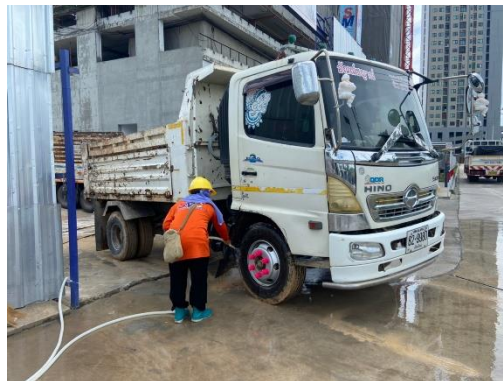
รูปที่ 9 เจ้าหน้าที่ล้างทำความสะอาดล้อรถบรรทุก ก่อนออกจากโครงการ