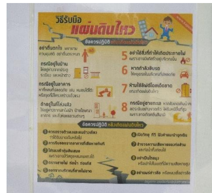
รูปที่ 36 ป้ายประชาสัมพันธ์การปฏิบัติตัวเมื่อเกิดเหตุแผ่นดินไหว