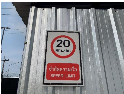
รูปที่ 11 ป้ายจำกัดความเร็ว