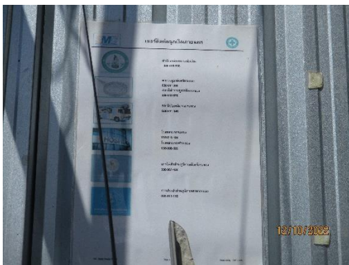
รูปที่ 38 เบอร์ติดต่อดูเงินเดือน