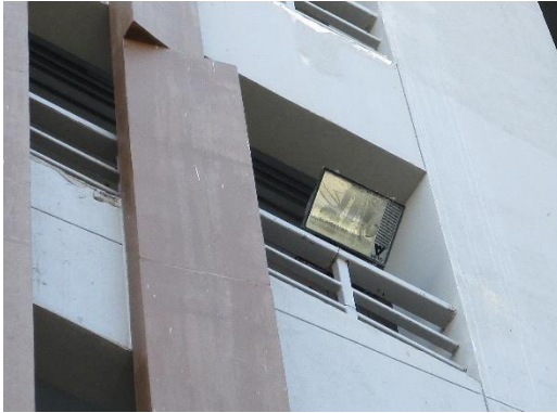
รูปที่ 33 ไฟฟ้าส่องสว่าง