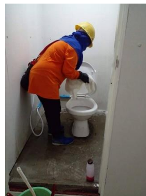
รูปที่ 21 เจ้าหน้าที่ทำความสะอาดห้องน้ำ