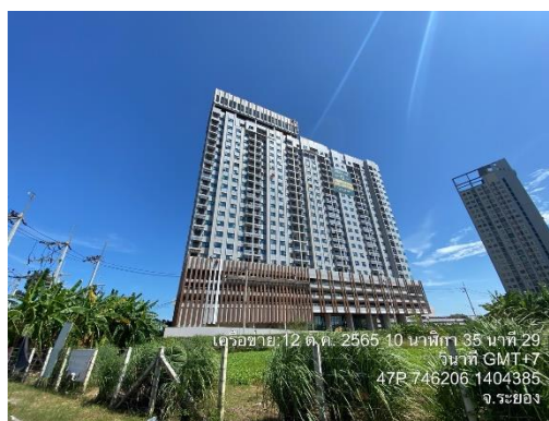
รูปที่ 40 สภาพปัจจุบันของโครงการ ณ เดือนตุลาคม พ.ศ.2565