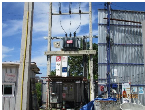
รูปที่ 30 หม้อแปลงไฟฟ้าของโครงการและตู้ไฟฟ้าชั่วคราว