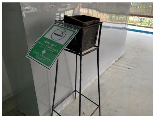
รูปที่ 29 พื้นที่สำหรับสูบบุหรี่