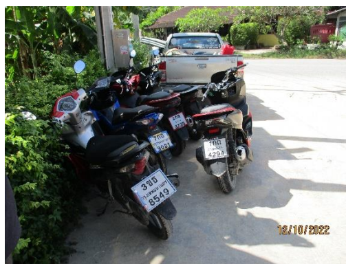
รูปที่ 12 พื้นที่จอดรถ