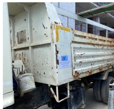
รูปที่ 24 ป้ายประชาสัมพันธ์บริเวณข้างรถบรรทุก