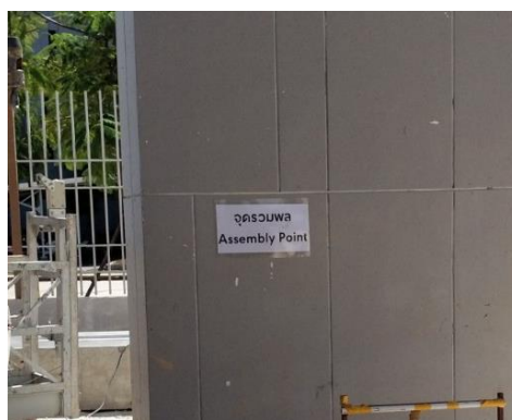
รูปที่ 31 จุดรวมพล