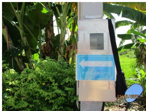
รูปที่ 39 ป้ายทางเข้า-ออกโครงการ