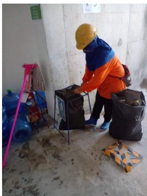
รูปที่ 25 การทำความสะอาดภาชนะรองรับมูลฝอย