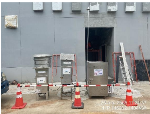
รูปที่ 17 ติดตั้งเครื่องตรวจวัดคุณภาพสิ่งแวดล้อม บริเวณพื้นที่โครงการ