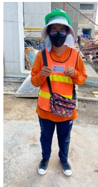
รูปที่ 35 การแต่งการของคนงาน