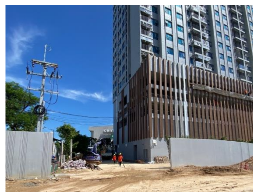
รูปที่ 16 ทางเข้า-ออกโครงการ