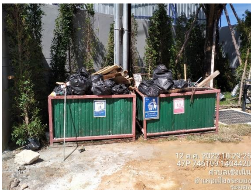
รูปที่ 13 ถังรองรับมูลฝอย