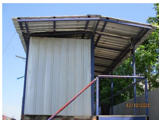
รูปที่ 19 ห้องน้ำ-ห้องส้วม