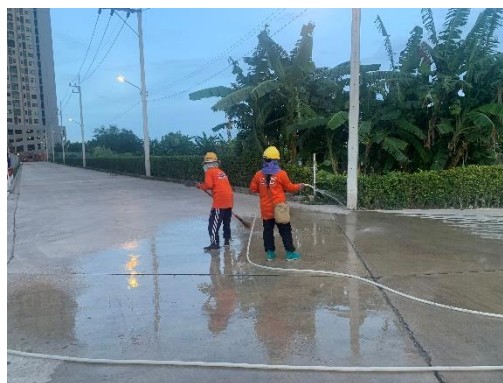
รูปที่ 7 เจ้าหน้าที่ทำความสะอาดบริเวณทางเข้า-ออกโครงการ