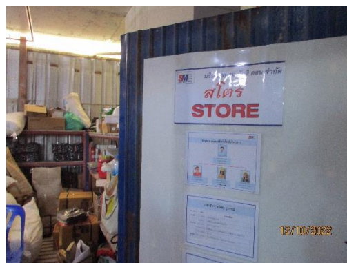
รูปที่ 4 สโตร์ (STORE)