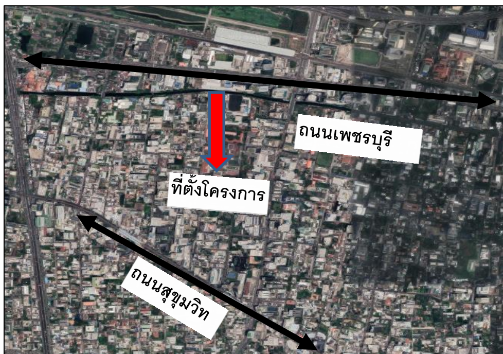
รูปที่ 1-1 แผนผังแสดงที่ตั้งโครงการ

โครงการ SOL HOTEL TOWER 1 ของบริษัทโซลิเทร โฮเทล จำกัด ตั้งอยู่ที่ ซอยสุขุมวิท 13 แขวง 1-1 ถนนสุขุมวิท แขวงคลองเตยเหนือ เขตวัฒนา กรุงเทพมหานคร มีขนาดพื้นที่ 1-0-15 ไร่ (1,660.00 ตารางเมตร) แสดงผังรูปที่ 1-1 โดยเส้นทางการคมนาคมสามารถเดินทางได้ด้วยรถยนต์ โดยใช้เส้นทางหลักในการเข้าสู่พื้นที่โครงการ คือ ถนนสุขุมวิท และถนนเพชรบุรีตัดใหม่