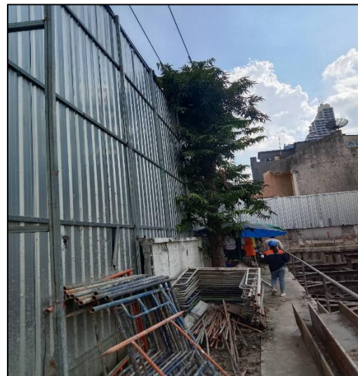
รูปที่ 1-2 สภาพปัจจุบันของโครงการ