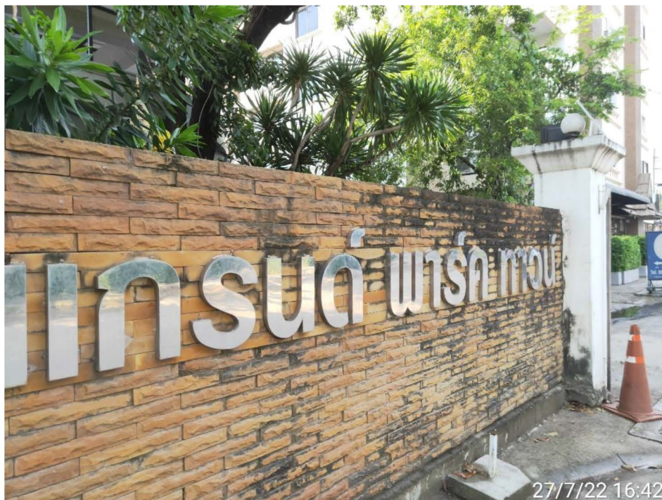
ภาพที่ 1-2 บริเวณด้านหน้าของโครงการ

ปัจจุบันโครงการ อาคารชุดพักอาศัย แกรนด์ พาร์ค ทาวน์ ก่อสร้างและเปิดดำเนินการโดยมีผู้ เข้าพักอาศัยภายในโครงการเป็นที่เรียบร้อยแล้ว