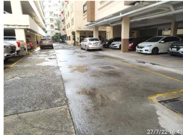
ภาพที่ 1-3 บริเวณภายในโครงการ